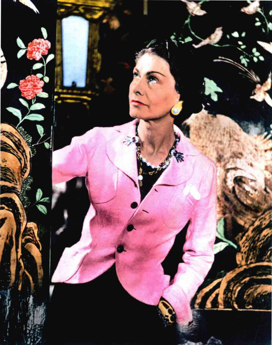
△摄于1937年，在巴黎丽兹酒店，香奈儿身穿香奈儿小西服，背景是著名的古科罗曼德尔屏风。