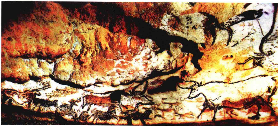
图1-1-4 拉斯科洞窟主厅壁画