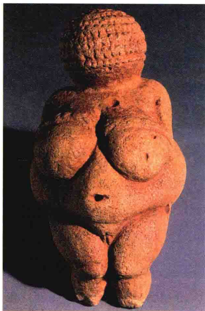
图1-1-1 威伦多夫的维纳斯

人们在欧洲西南部和南部地区的一些洞窟岩壁上发现有人工绘制的比较集中的大面积壁画。壁画所表现的内容多为动物，有奔跑的鬣狗、犀牛、野马、驯鹿、受伤的野牛、猛犸等。创作者利用洞窟地势、岩石的面积大小、表面凹凸状况、石纹变化和明暗走向来安排动物。表现手法基本写实、线条简练自由、有一定的明暗变化。所用颜色可能是从赤铁矿石和其他矿石中提取出的暗红色、深黄色、棕褐色和深褐色等。这些作品生动、形象，具有一定