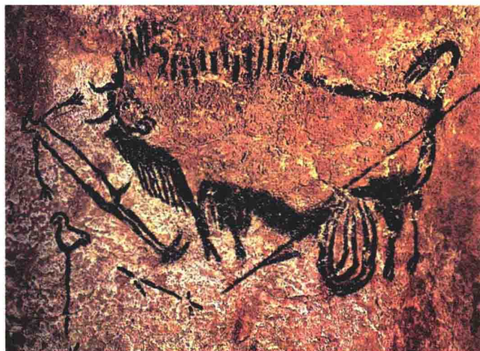
法国拉斯科洞窟壁画

有些画是直接墙上刻出来的，有些画在刻过了之后还会上色。远古人类使用的颜料是用有色黏土和动物油脂混合而成的，通常只有红、黄两种