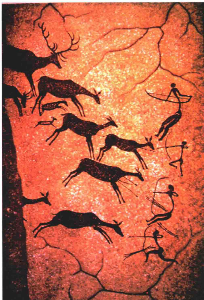
法国拉斯科洞窟壁画

法国拉斯科洞窟被誉为“史前的卢浮宫”，洞窟中的动物壁画是人类美术史上最早的绘画记录，距今已有 15000 年左右。图上这幅壁画表现的是原始人类拿着弓箭射杀野鹿的场景。