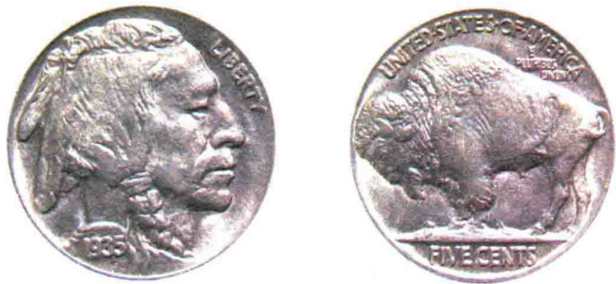
美国5美分硬币，一面是印第安人头像，一面是美洲野牛像

远古人类在画这些画的时候，洞穴里非常暗。因为当时的洞穴是没有窗户的，唯一的光线就是火把发出的光。那么，他们为什么要画这些画呢？当然，这些画不可能仅仅是用来装饰洞壁的。我们认为当时的人们画这些画是为了祈求好运，就像有些民族把马蹄铁挂在门外，希望可以辟邪、带来好运一样。当然，他们可