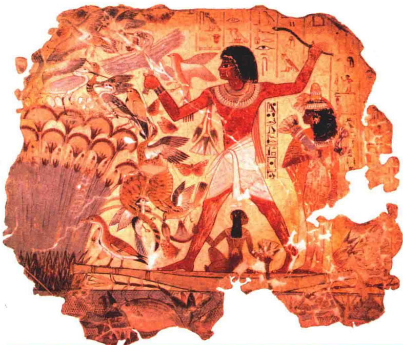
《捕禽图》 埃及陵墓壁画

我们现在有各种各样的颜色，但古埃及人只有红色、黄色、绿色和蓝色四种鲜艳的颜色，以及黑色、白色和褐色。不过，古埃及人的画都很难褪色。你们知道，现在要找到不褪色的颜料是非常难的。窗帘、沙发罩，甚至衣服的颜色都会褪掉，除非它们是耐晒型的。然而古埃及人画的画，直到今天，颜色都还和几千年刚画好的时候一样鲜艳。因为古埃及人使用的颜料是不容易褪色的颜料，而且他们的画长期藏在太