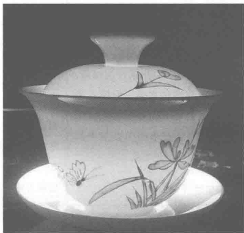
图 1-3 盖碗

清朝的茶盏、茶壶通常以陶或瓷制作，以康乾时期最为繁荣，“景瓷宜陶”最为出色。清时的茶盏，以康熙、雍正、乾隆时期盛行的盖碗最负盛名（图 1-3）。