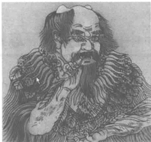
图 1-1 神农氏

“茶之为饮，发乎神农氏”，唐代茶圣陆羽在《茶经》中的记载广为流传（图 1-1）。这符合我国常常把一切与农业、与植物相关的事物起源最终都归结于神农氏的传统。