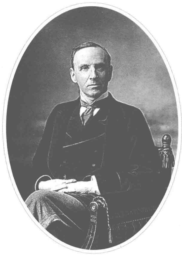
约翰·莫雷 (John Morley) 像