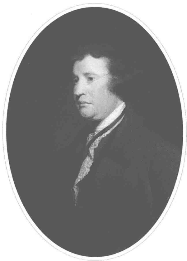
埃德蒙·伯克 (Edmund Burke) 像