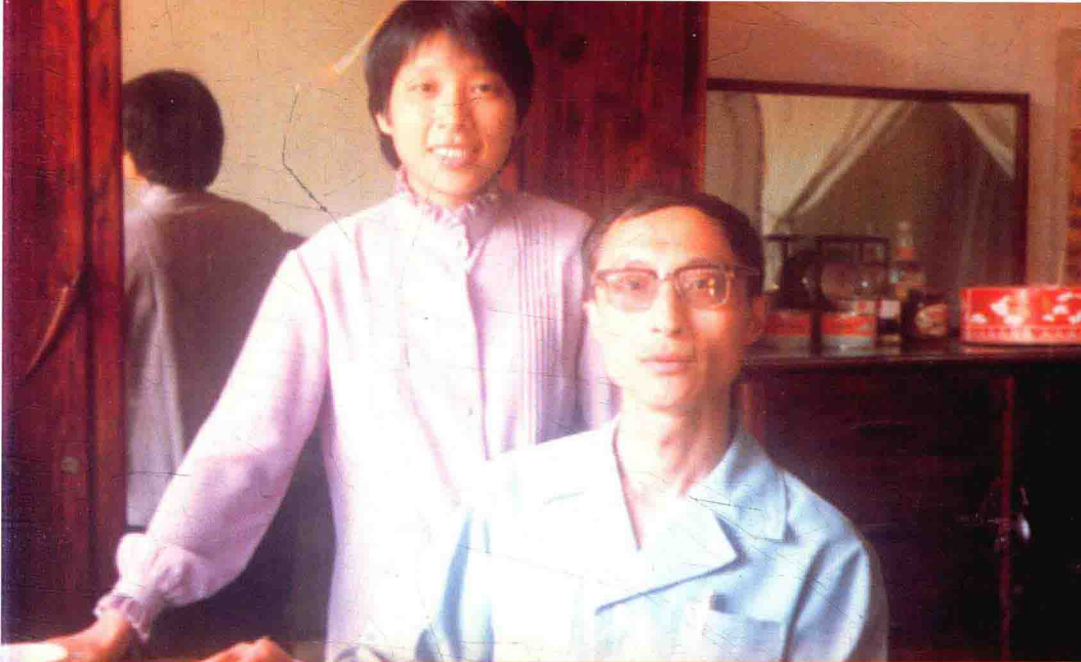
本书作者与妻子在陈家场的新房内，摄于1985年。