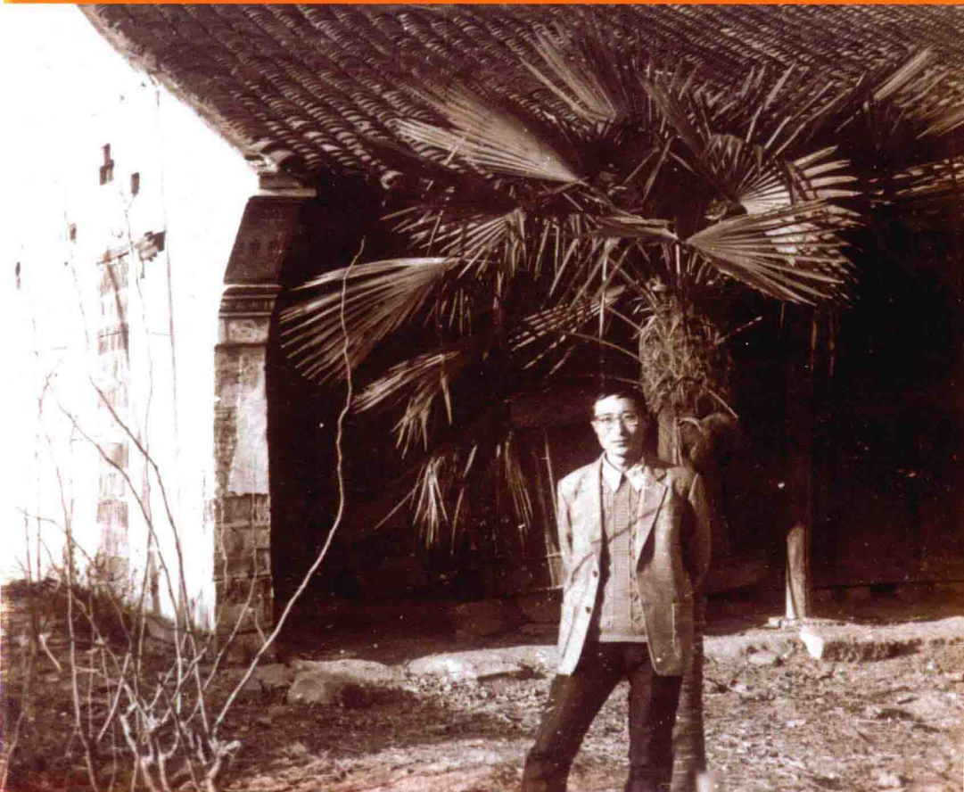
本书作者在陈家场自家的房子前，摄于1988年。