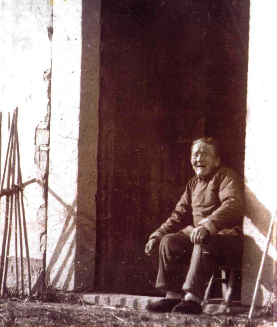
陈家场一位世纪老人坐在家门口，摄于1989年。