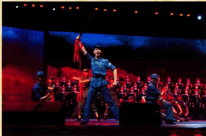
表演合唱《大刀进行曲》