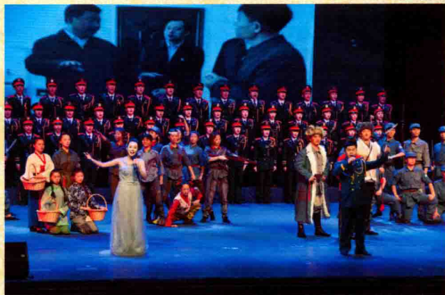
全体演员共同唱响《歌唱祖国》