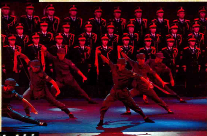
表演合唱《大刀进行曲》