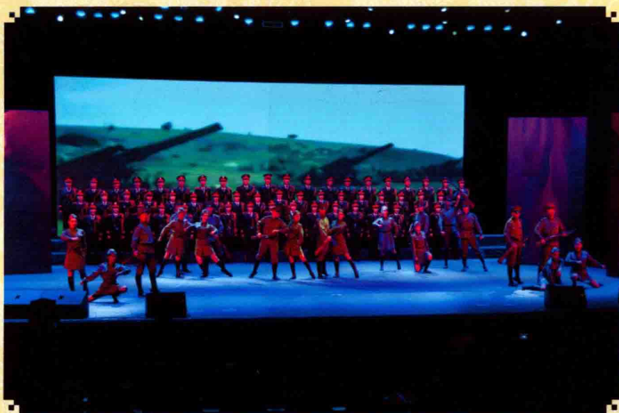
表演合唱《神圣的战争》