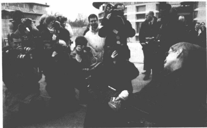
图1 霍金来参加报告会，吸引了600多名与会者和媒体记者

霍金60岁生日的庆祝活动，2002年1月在剑桥大学隆重举行。在数学科学中心召开了两个会：1月7—10日的学术讨论会和11日的报告会。在报告会上，霍金和4个科学家做了普及演讲，英国BBC电视4台在2002年8月5—8日播放了这些演讲，题目是《霍金演讲》（ The Hawking Lectures ），也就是我们选编在这里的东西。