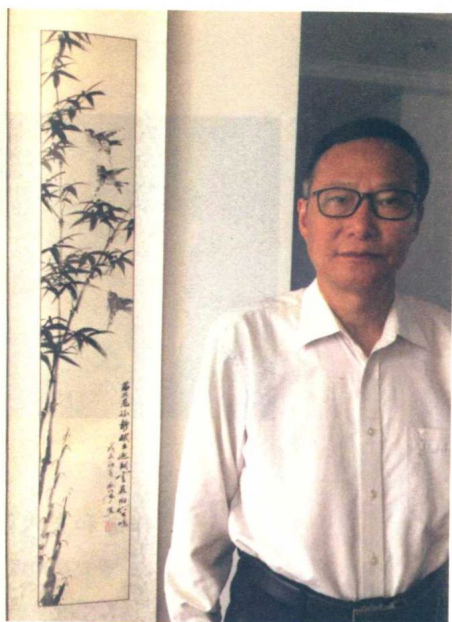
作者和其父创作的墨竹图