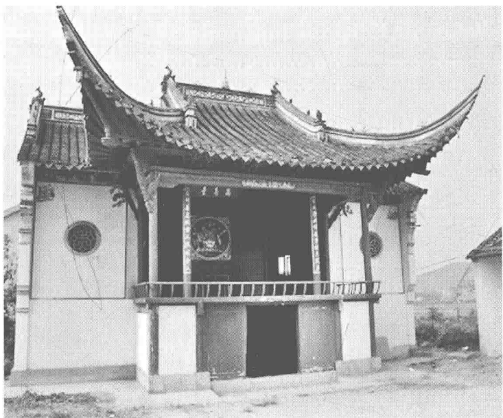
南京市高淳区刘家陇万寿台

间 6.6 米，进深一间 2.94 米，面积约 20 平方米。台面立柱左右写有木联：“生旦净丑诸虚事指点实事；忠奸善恶托古人提醒今人。”戏楼为砖木结构，仿殿宇式建筑，台口左右屋面起翘，台内顶设方形藻井，檐口、天壁、梁枋刻有各类木雕，造型古朴大方。台顶正中有一方斗式藻井。一般上季做庙会，下季唱秋戏。戏楼后台板壁上，留有光绪三十一年（1905）农历七月二十日“全福班”及民国初年演出时题在后台板壁上的戏目：《天关楼》《龙凤旗下》《白虎堂》《定军山》《女绑子》《置田庄》《磨豆腐》《北良关》《渭水河》《朝贺》《朱砂痣》和“找戏”《遗翠花》等 20 多个日夜场演出的剧目单。1958 年兴修水利时戏台被毁。2004 年经修缮，恢复原貌。2006 年列为省级文物保护单位。参见《南京文化志·戏曲编》，中国书籍出版社 2003 年版。