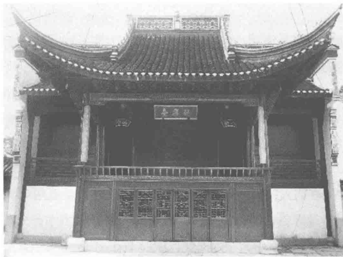
南京市高淳区淳溪镇吴氏宗祠观乐台

位于江苏省南京市高淳区淳溪镇吴氏宗祠内。始建于清乾隆四十六年（1781）。坐南面北。前台歇山顶，后台硬山顶。过路台，一面观。中央两柱间有屏风木板隔成前、后台，俗称“天壁”，以便前台演戏，后台化装。天壁左右，为上下场门。前台两侧间，隔成“乐台”和“包厢”。台顶，正中构筑三层八角形藻井，四周置以“平棋”天花。该戏楼大小木雕共计80余幅，均为精雕细刻。正台“天壁”上有一幅方形高浮雕“双凤戏牡丹”图，边长2.3米。凤凰造型优美，形态逼真。仰观藻井，其间有浮雕“双龙戏珠”图。穿枋下四角，木雕垂莲花篮，篮内分别刻出桃花、荷花、菊花、水仙，象征春夏秋冬四季繁华。台前立柱与横枋之间的木雕“斜撑”，刻画出两只雄狮，狮头下俯，狮尾上翘，狮背上站立文武天官。横连台口柱上的额枋，分别刻出戏文，内容有“郭子仪做寿”、“佘太君百岁挂帅”、“诸葛亮借东风”等典故。台口额枋与檐檩之间，分别挑出14攒“凤头昂”斗栱。高淳主要流行阳腔目连戏，主要有弋阳腔、余姚腔两种，民间称为“阳腔”。1938年，陈毅率新四军一支队挺进高淳，司令部就设在宗祠内。1982年，高淳县淳溪镇吴氏宗祠观乐