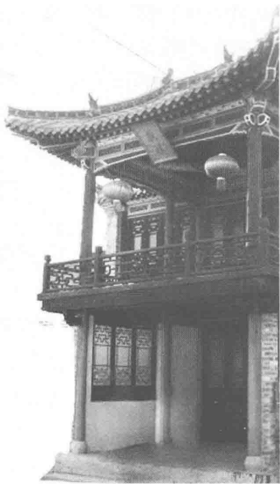
/ 邳州市土山镇关帝庙戏楼 /

位于江苏省徐州市邳州市土山镇关帝庙的一进院与二进院之间。始建于清代中后期。过路台，坐南朝北。通面阔三间 10.6 米，通进深 8.986 米，台高 7.925 米。原墙体基本完好，室内排水槽等为清代遗存，正脊、垂脊、垂兽、排山、滴子、梁架、檩条、楼地板为民国遗存。根据戏台遗址分析和对知情者的调查，戏楼为二层，主楼明间向北出抱厦一间，和上楼连为勾连搭式。戏台底层东西以墙围护，北面敞开，二层北立面两根角柱和主楼明间二层两根檐柱围成一间，屋顶为七檩歇山式。由戏楼两翼楼梯上主楼二层，北面安装窗户以别内外，南面明间有窗供采光通风，为演员化装休息之用。底层明间向南有券门，作为庙内的主要通道。另外，庙内院落东侧亦尚存一观戏楼，称东观戏楼，建于民国时期，面阔三间 9.72 米，进深 5.81 米，高 7.176 米，上下共计六间。西侧观戏楼建筑已倒塌，仅存建筑遗址。2005 年始，徐州市组织力量，对关帝庙进行维修，对戏楼进行了有依据的复建。2006 年被列为省级文物保护单位。参见束有春《江苏戏曲文物研究》，大众文艺出版社 2008 年版。