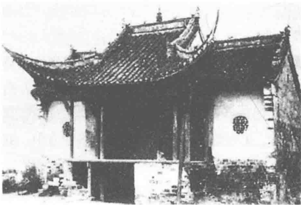
/ 南京市高淳区刘家陇祠山庙戏台 /

位于江苏省南京市高淳区固城镇刘家陇村祠山庙内。始建于清乾隆十四年（1749）。过路台，单檐歇山顶，三面观。前台面阔 6.6 米，进深 3 米。后台三间。平面呈凸字形。正间屋脊高出边间，台口左右屋面起翘。戏楼内顶设