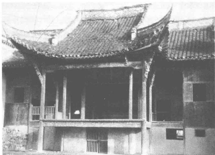
南京市高淳区沧溪三元观戏楼

字形，两旁有子台。梁架结构为九檩五柱穿斗造，通高 11.2 米。正间屋面高耸，次间略低。圆木柱，通柱造。前檐两角柱上部设斜撑。正台檐口有“沧浪一曲”横额，为清代桐城派古文学家方苞所题；两侧楹联“功名富贵一时事，离合悲欢千古情”，为清本邑文人邢鹤撰写。台板壁绘有“丹凤朝阳”、“腾蛟起舞”两幅画。戏楼分上下两层，中堂天壁系镂空圆窗，雕有通花“双龙戏珠”，以此为界，分为前后台。两旁副台上下场门楣书“出将”、“入相”；楼顶藻井绘有“踏雪寻梅”、“羲之爱鹅”等画。戏楼前有一大四合院，占地 800 余平方米，可容 3000 多人观戏。院中两株古红杨树，覆盖着整个大院，绿荫遮盖到前台屋面。