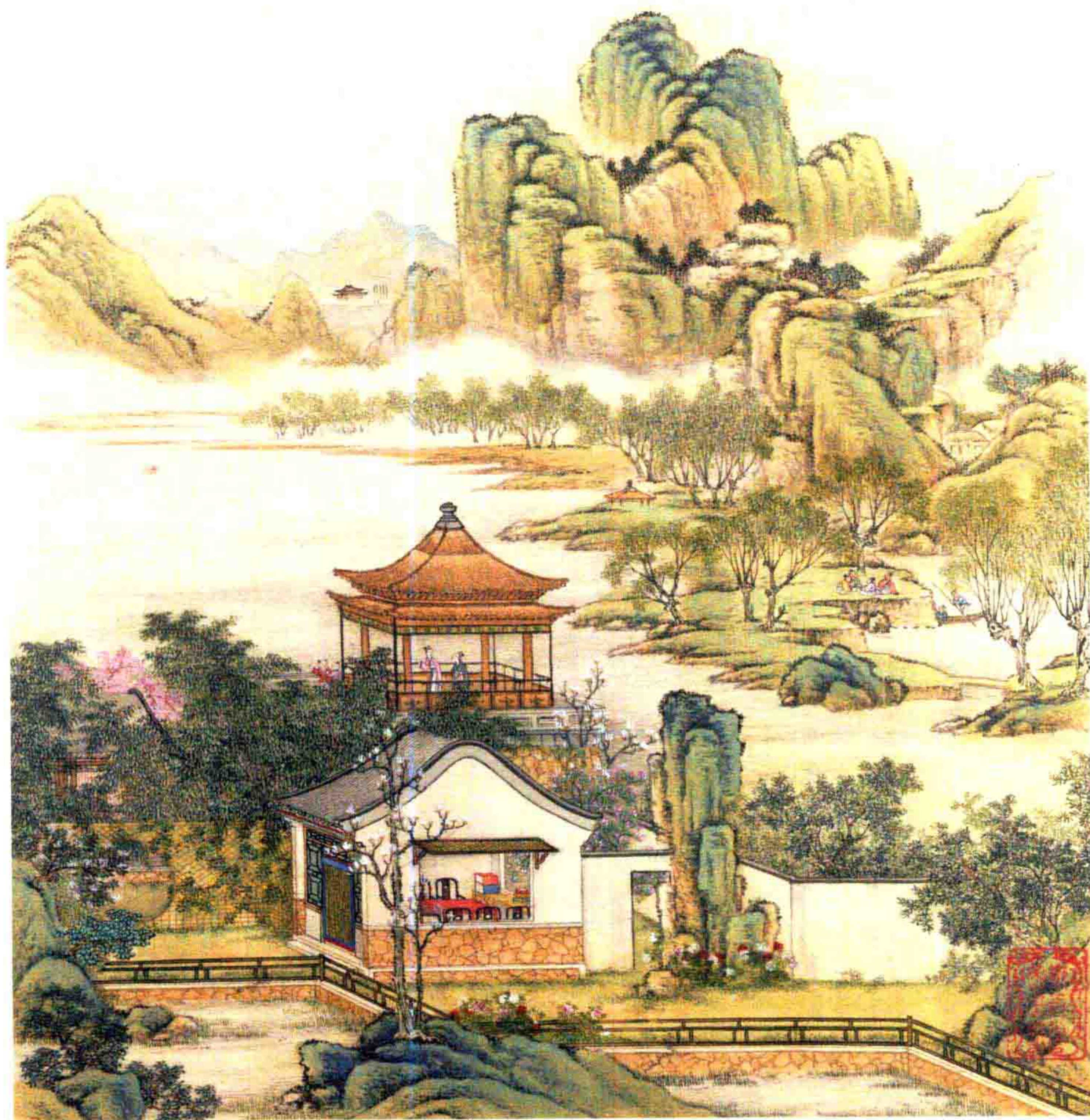
山水楼阁图册 「清」陈枚