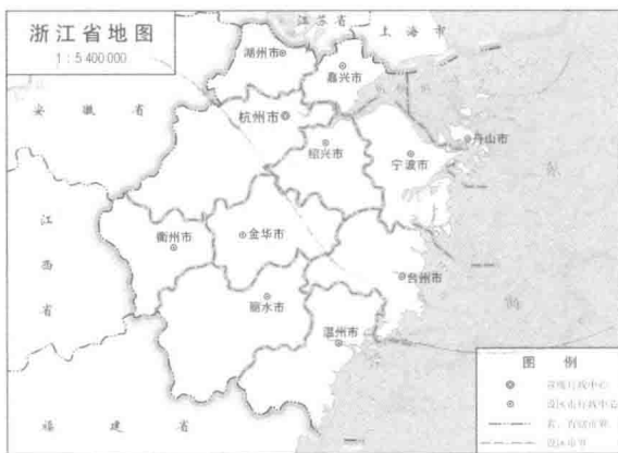
浙江省地图——浙江省测绘与地理信息局组织编制[浙S(2010)280号]