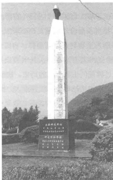
长兴群山岩层中的金钉子