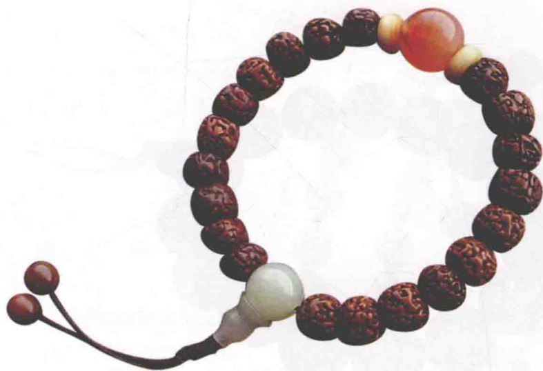
图0-6 21颗金刚菩提佛珠