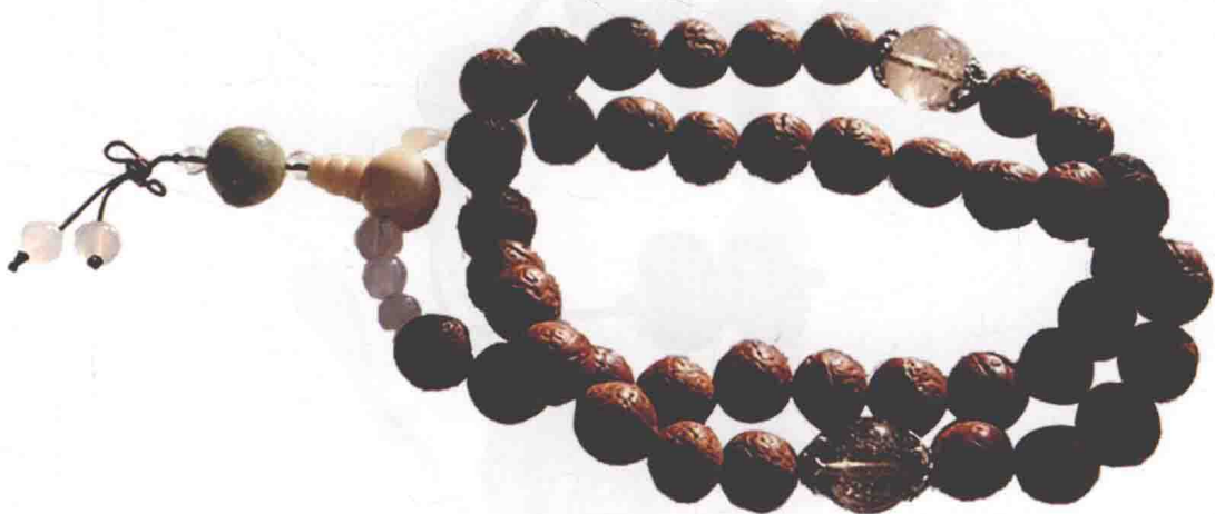
图0-4 42颗凤眼菩提子佛珠