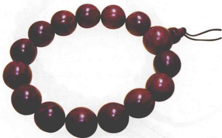
图0-8 14颗小叶紫檀佛珠