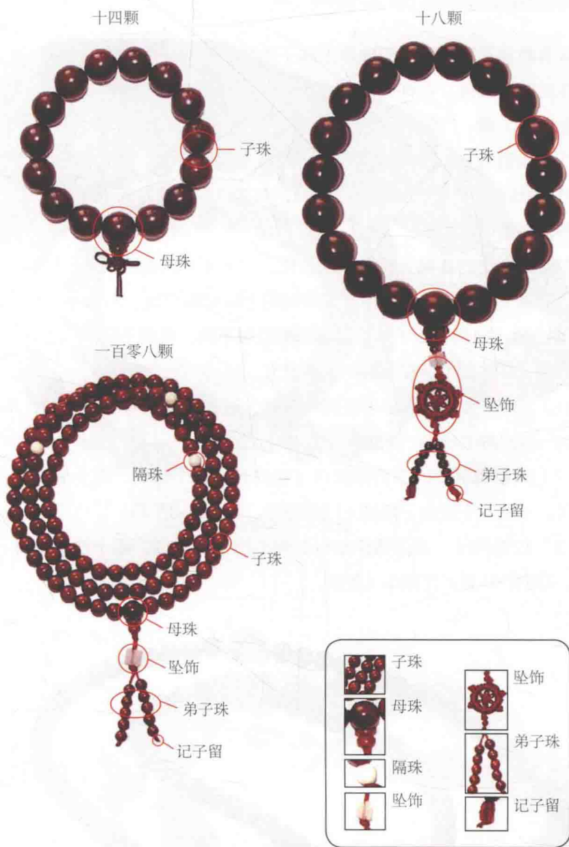
图0-1 佛珠组成示意图

在母珠的另一端，以10颗为一小串，如同算盘珠一样，采用十进位，用来计算掐捻过的数目。