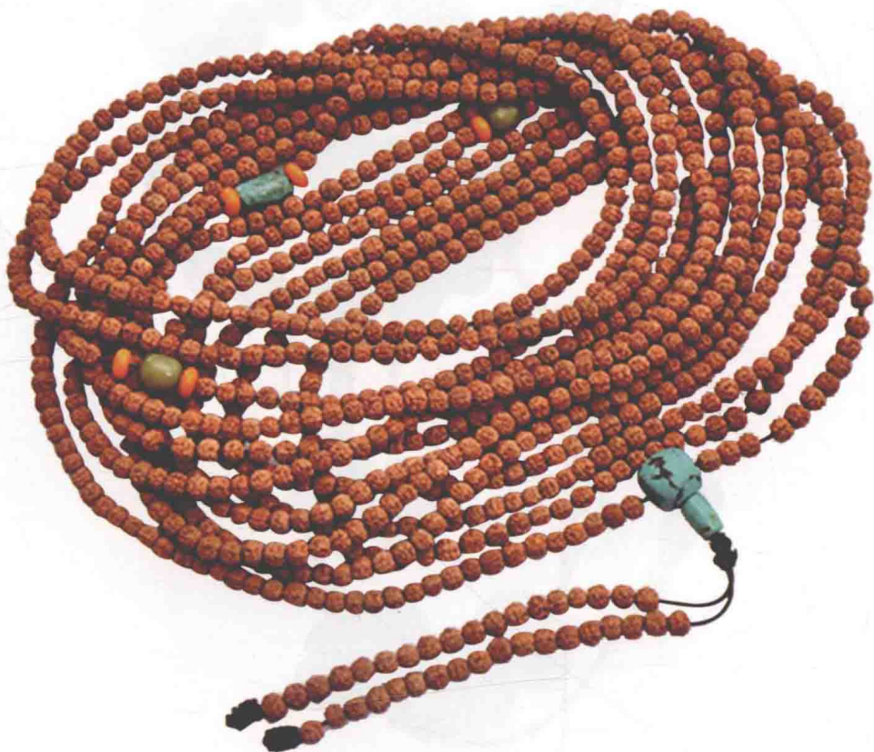
图0-9 1080颗小金刚菩提佛珠