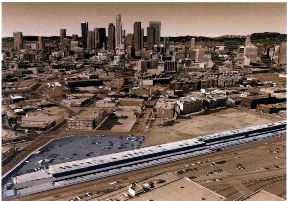
位于洛杉矶城中二街上的 SCI-Arc 超长校舍

更加丰富的教员。第一任院长叫做雷·凯帕 (Ray Kappe)，他们提出新的建筑学院是一个“没有围墙的大学” (college without walls)，也就是希望学校更多地和社会发生关系，与现实建筑设计项目有更密切的关系，应用性更强，人文性更强。这个学校从那个时候开始，已经成为世界上极为罕见的独立建筑学院之一，和百年老校 AA 有可比之处。