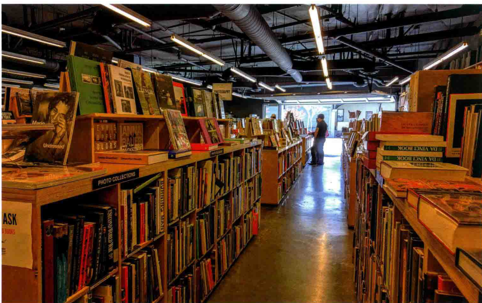
圣塔菲一号社区内的建筑-艺术专业书店

筑和所在的土地，因此关系还是变成了租赁，南加州建筑学院继续努力打官司，终于在2011年成功地用2310万美元代价买下了这个建筑的产权，因此，学院终于可以永久性在这里了。我前面说到的“圣塔菲一号”是一个开发商在2004年购买了圣塔菲大道路西的紧靠洛杉矶河的一片狭长的土地，宣布要在这里建一片40层高的塔楼，内中有384套高级豪华公寓。我们现在看到的“一号”，是完成的第一部分，后面相继会有塔楼出现的。