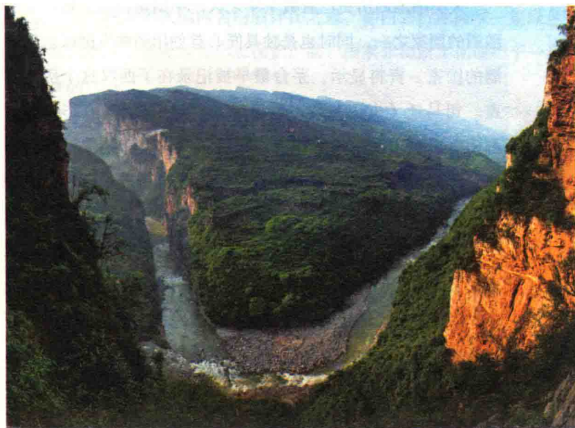
溢彩流光的赤水河孕育了飘香万里的茅台酒

一代又一代的茅台人艰苦创业和继承创新，不断在前人基础上对生产、技术、工艺进行孜孜不倦的探索和升级，正是国酒茅台发展经久不衰的驱动力与生命力。这甘美醇香的杯中尤物，从问世那天起，便逐