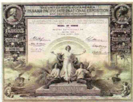
1915年巴拿马国际博览会茅台获奖证书

一个世纪的风风雨雨就这么过去了，这一掷，一直在深刻地影响着这片神奇的土地，一直在引领着茅台人，教诲着茅台人——不忘初心，将美酒的品质看成生命，看成尊严，要以一颗如那位酒师一般的赤