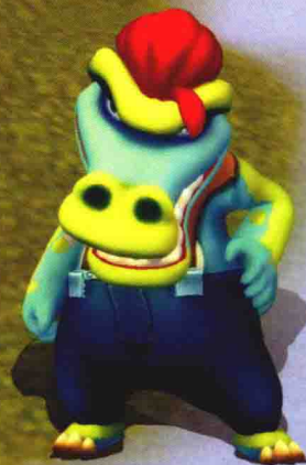
经常与大吉作对的红毛