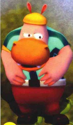
经常与大吉 作对的阿呆