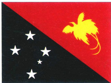
巴布亚新几内亚国旗