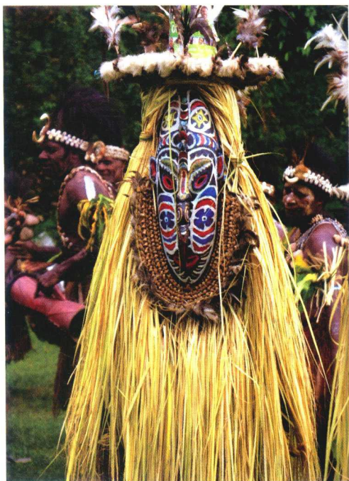
传统民族欢迎仪式