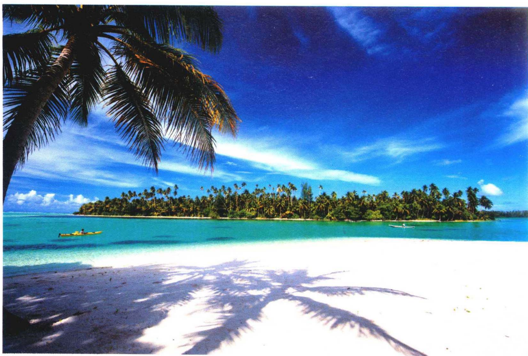
海岛景观