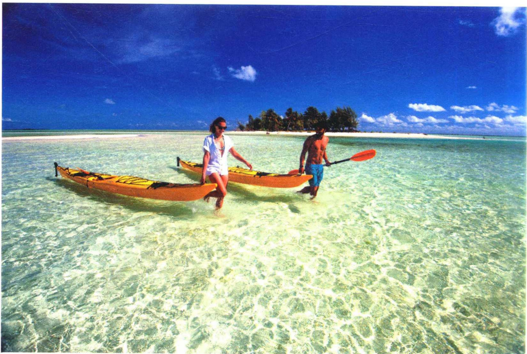
海滩风光