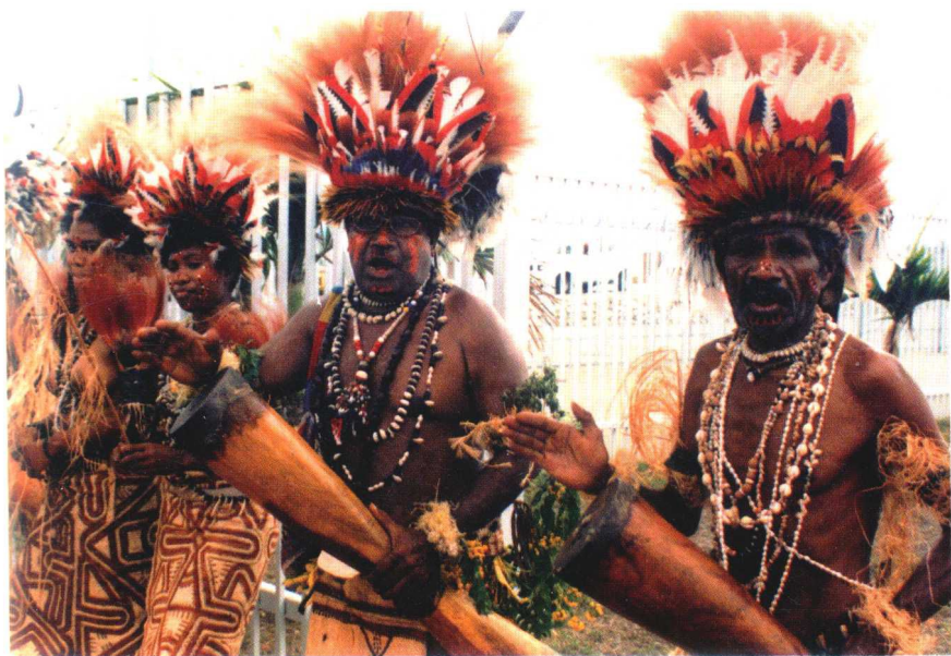
传统民族欢迎仪式