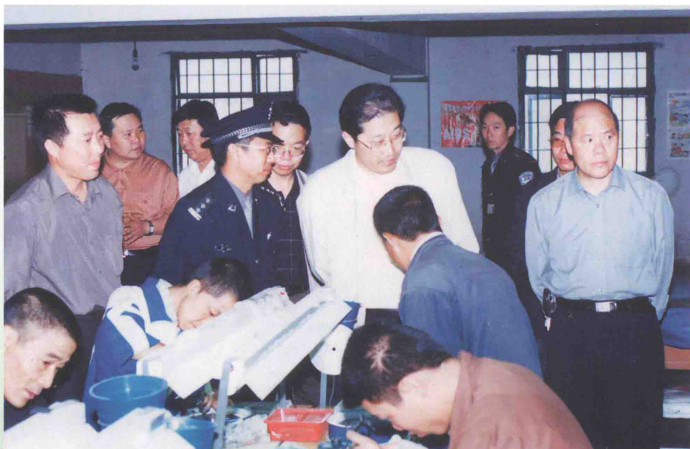
2005年7月，六盘水市委书记辛维光（前排右二），市委副书记周庄生（前排右一），市委常委、市委政法委书记何冀（后排左二），市委常委、市委秘书长李彦芳（后排左三）到六盘水戒毒劳教所视察工作。