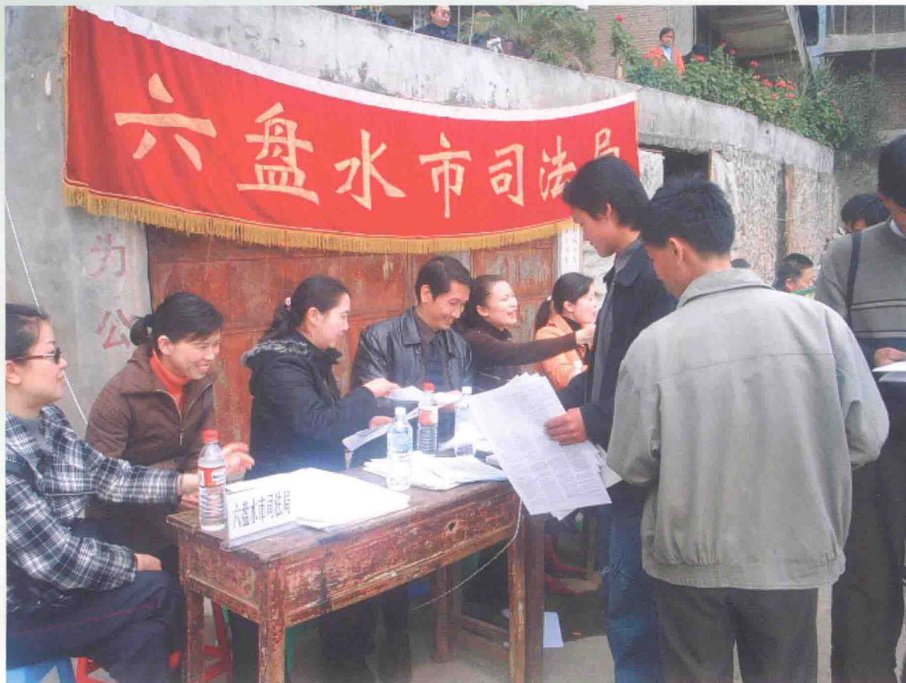
六盘水市司法局开展“三下乡”法制宣传活动。