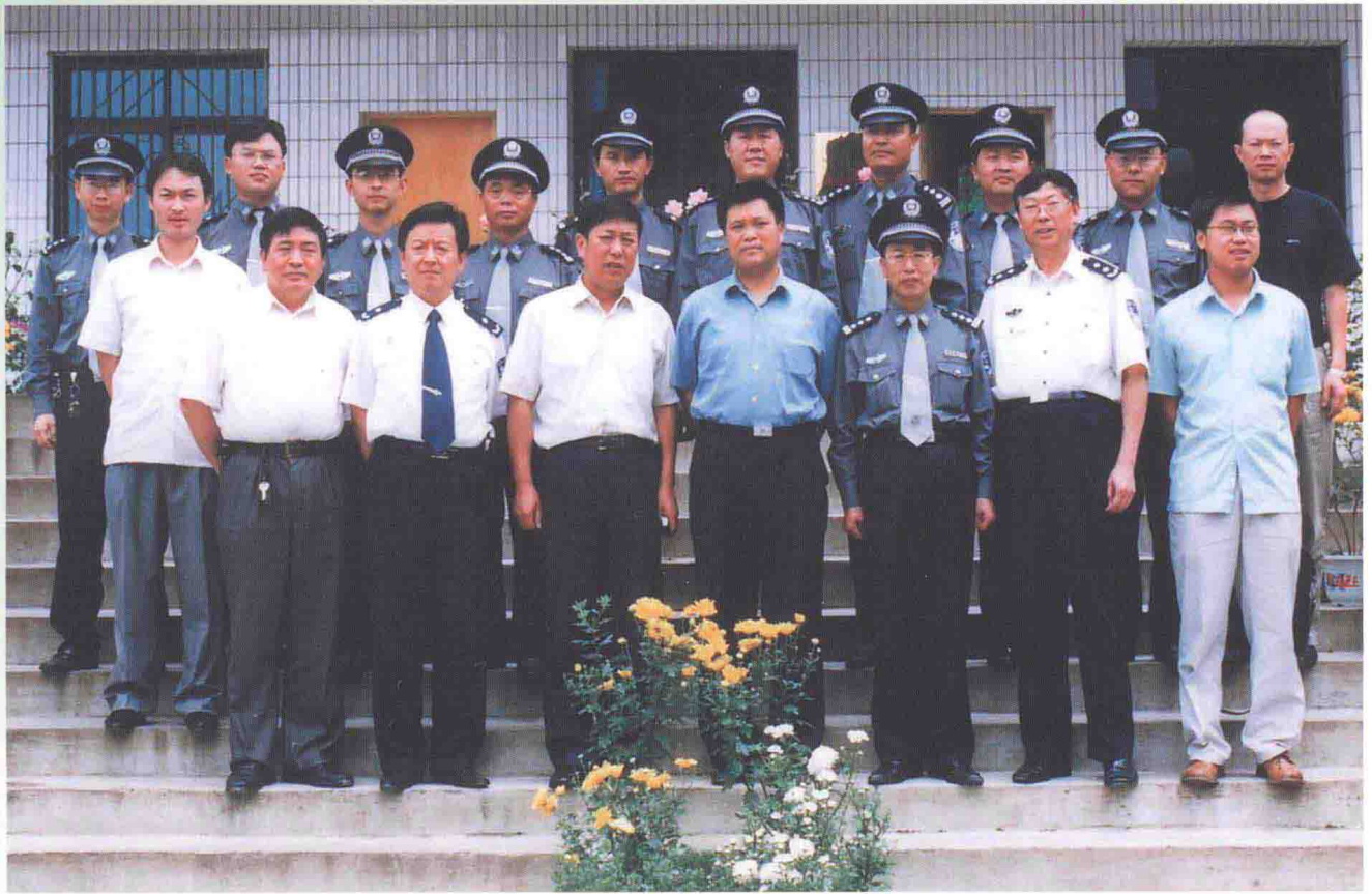
2004年7月，司法部劳教局局长李如林（前排左四）在省劳教局局长胡金岭（前排左六）、副局长何川（前排左二），六盘水市委常委、政法委书记何冀（前排左三）、六盘水市司法局局长魏兴周（前排左一）、市戒毒劳教所所长李柏岩（前排左五）等同志的陪同下到劳教所检查指导工作。