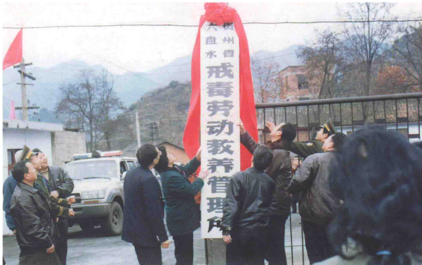
1995年12月27日，六盘水戒毒劳教所挂牌成立。省政府副省长张玉芹，省劳教局局长郑映武，六盘水市委书记管彦鹤，市委副书记黄美贤，市政府副市长田万昌，市司法局局长李玉华等同志出席挂牌仪式。