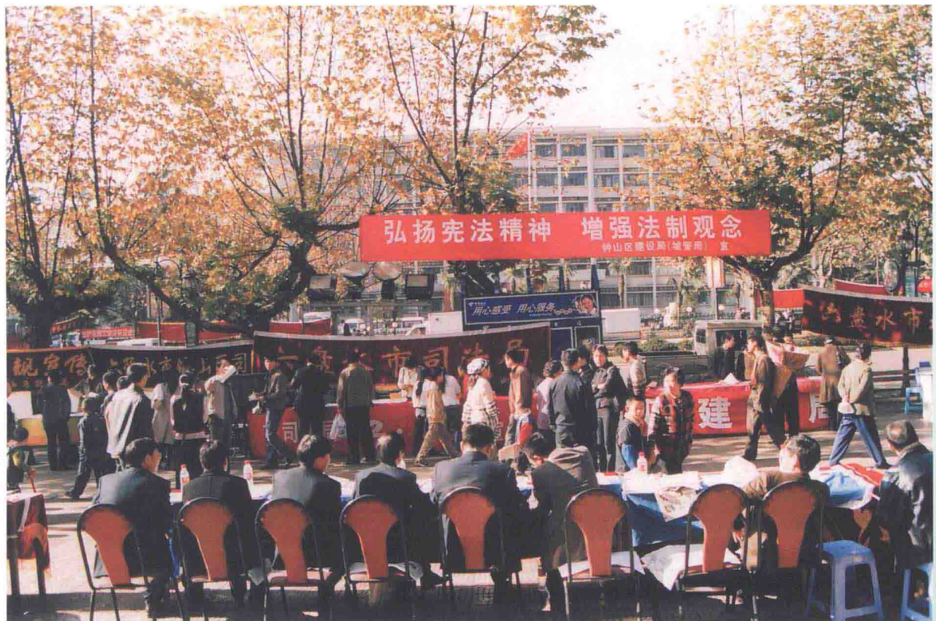
六盘水市司法局组织全市有关单位开展法制宣传活动。