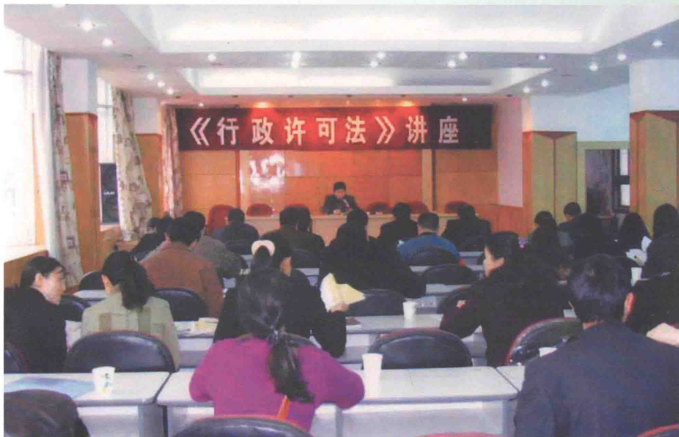
六盘水市司法局在地税局举办《行政许可法》讲座班。