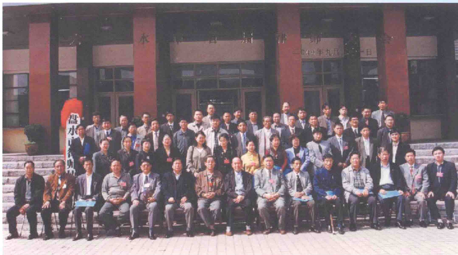
2000年9月21日，六盘水市首届律师大会合影。