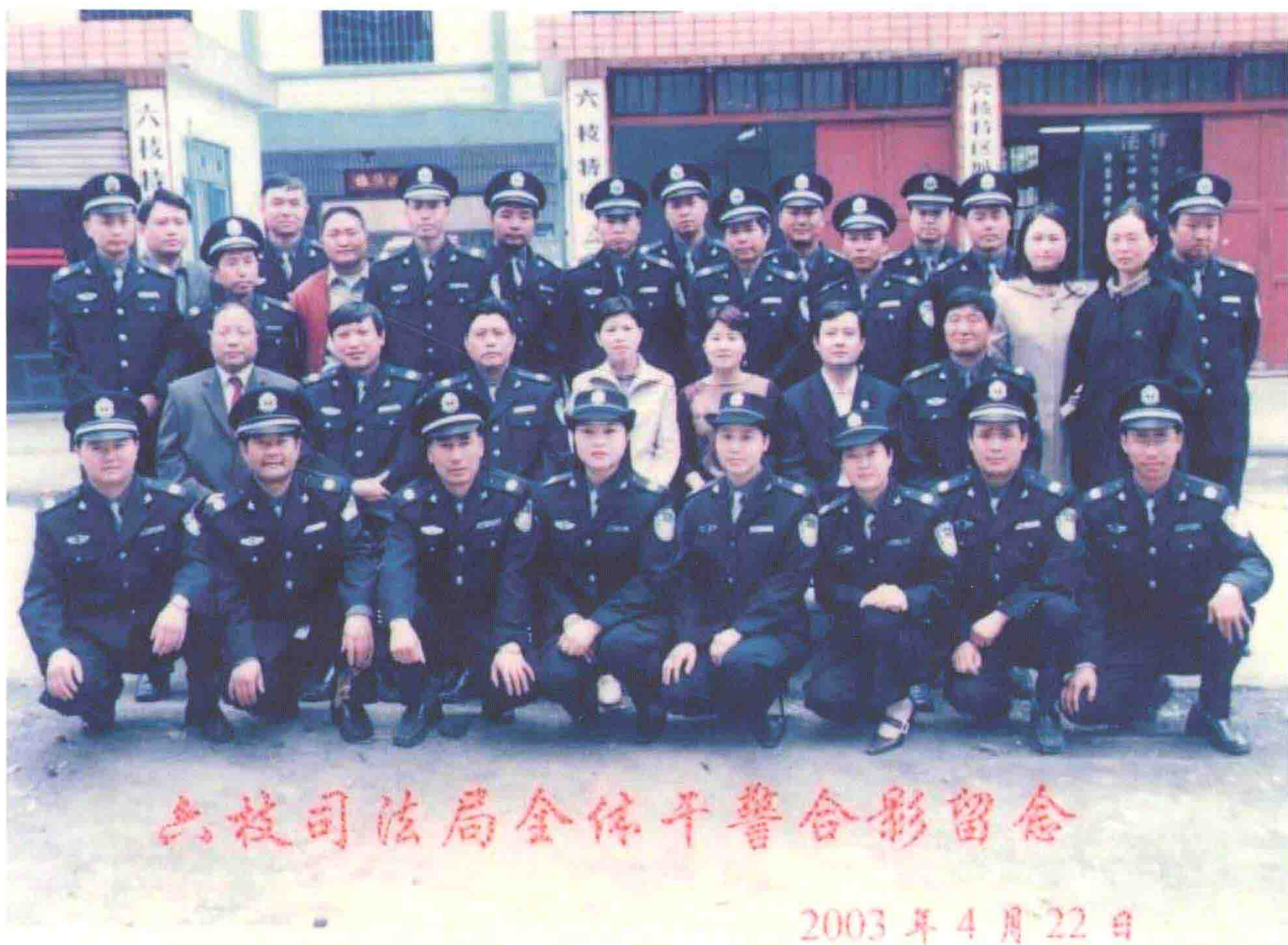
2003年六枝特区司法局全局人员合影。