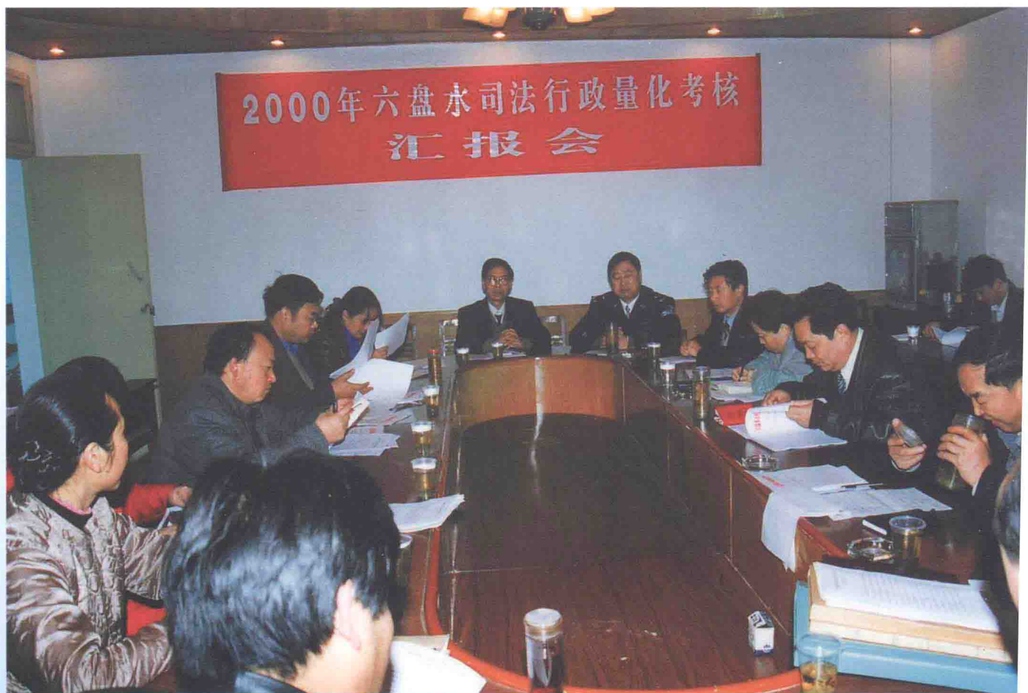
2000年六盘水司法行政量化考核汇报会。