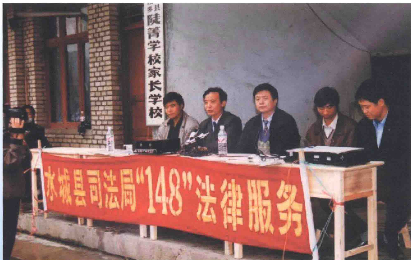
1998年9月29日，水城县领导参加在陡箐乡开展的“148”法律服务宣传活动。