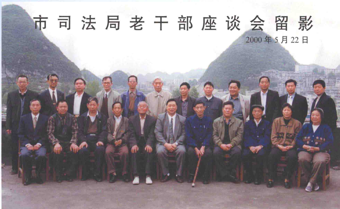
2000年市司法局老干部座谈会留影。