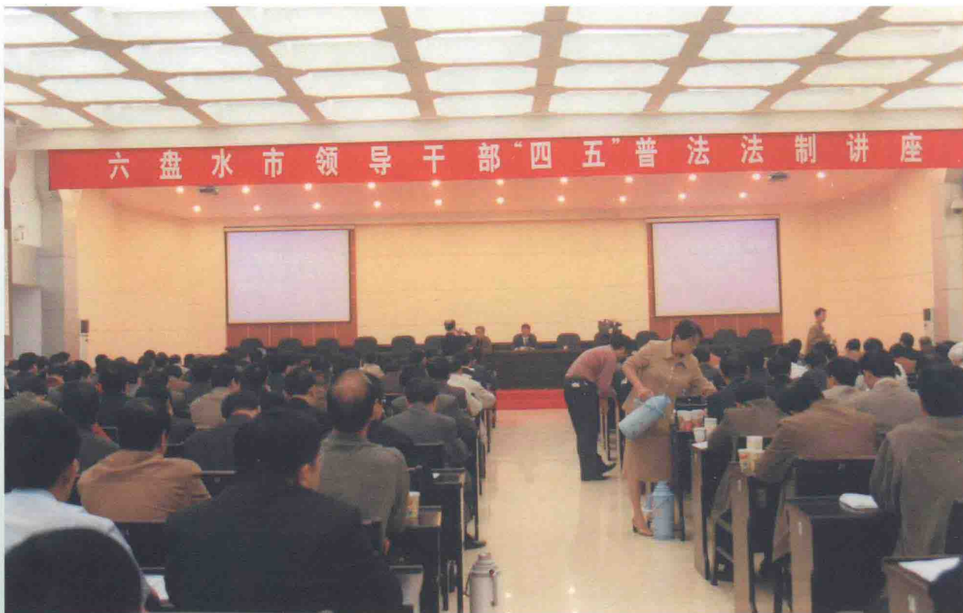
组织六盘水市领导干部听取“四五”普法法制讲座。