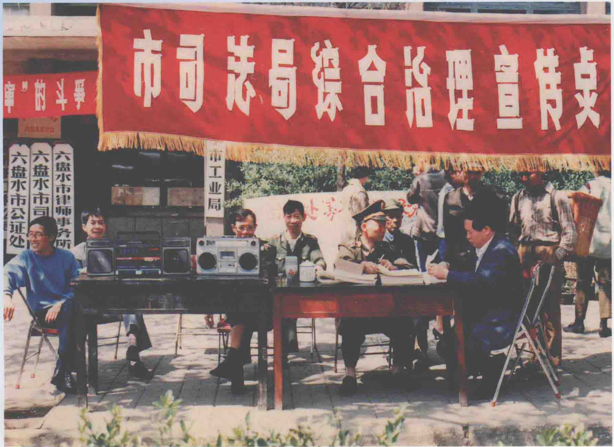
1992年5月3日，市司法局社会治安综合治理法制宣传活动。