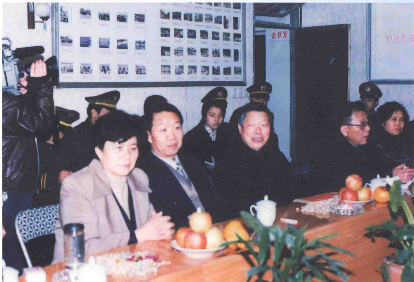
1998年春节，六盘水市委书记徐敬原（前排左三），市人大常委会副主任任万英（前排左四），市政府副市长罗贤能（前排左二），市政协副主席吴尚琼（前排左一）等领导到劳教所慰问一线民警。