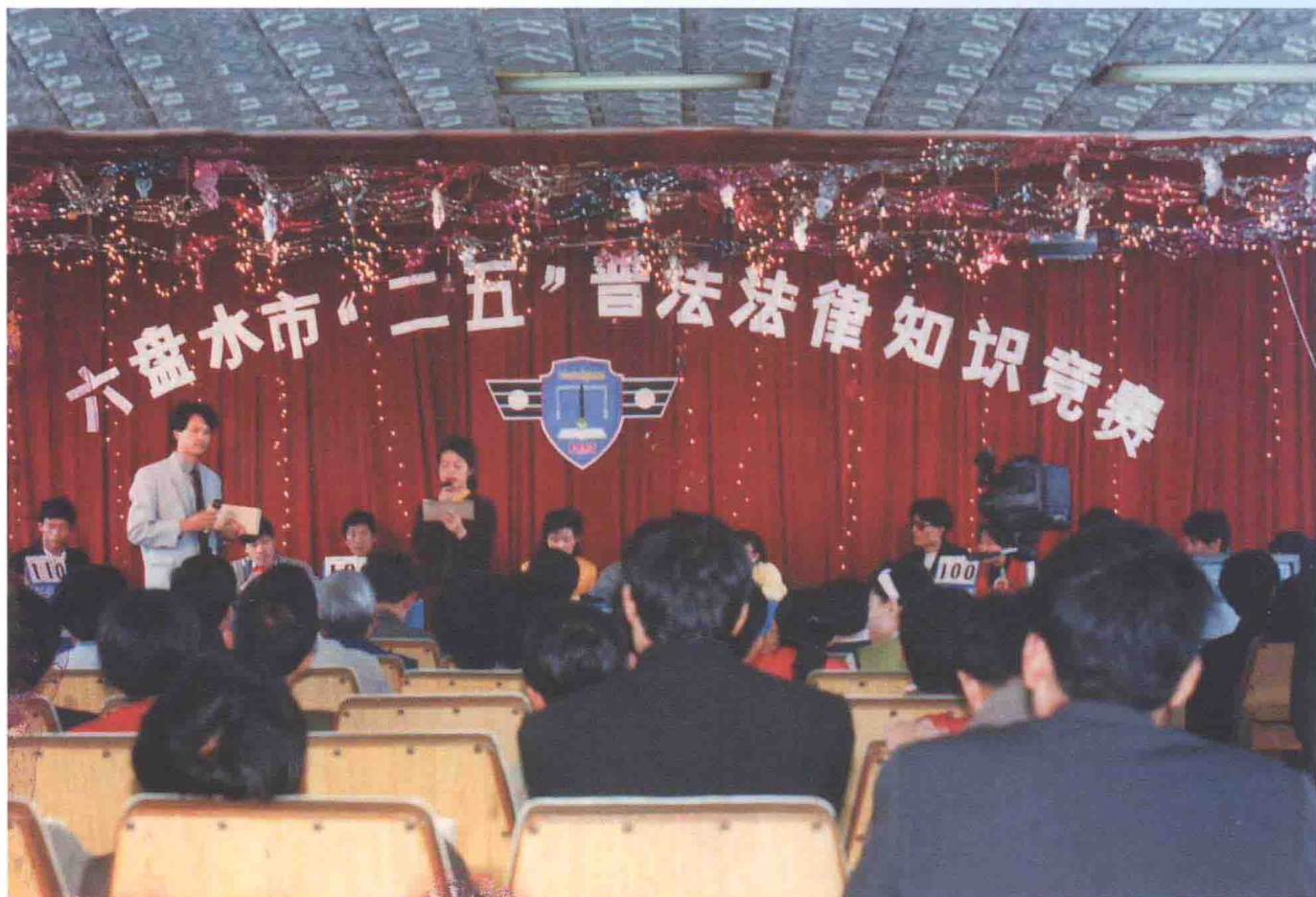
六盘水市举行“二五”普法法律知识竞赛。