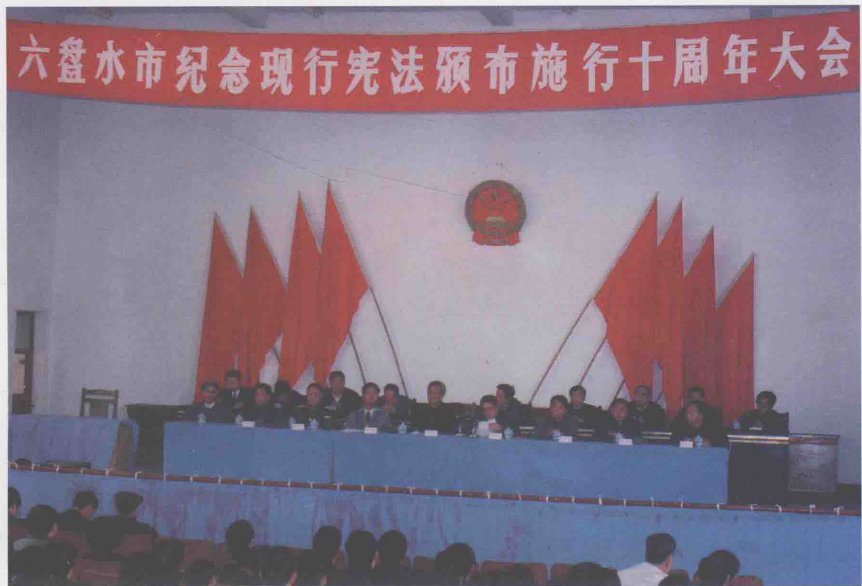
1992年，六盘水市召开纪念现行宪法颁布施行十周年大会。