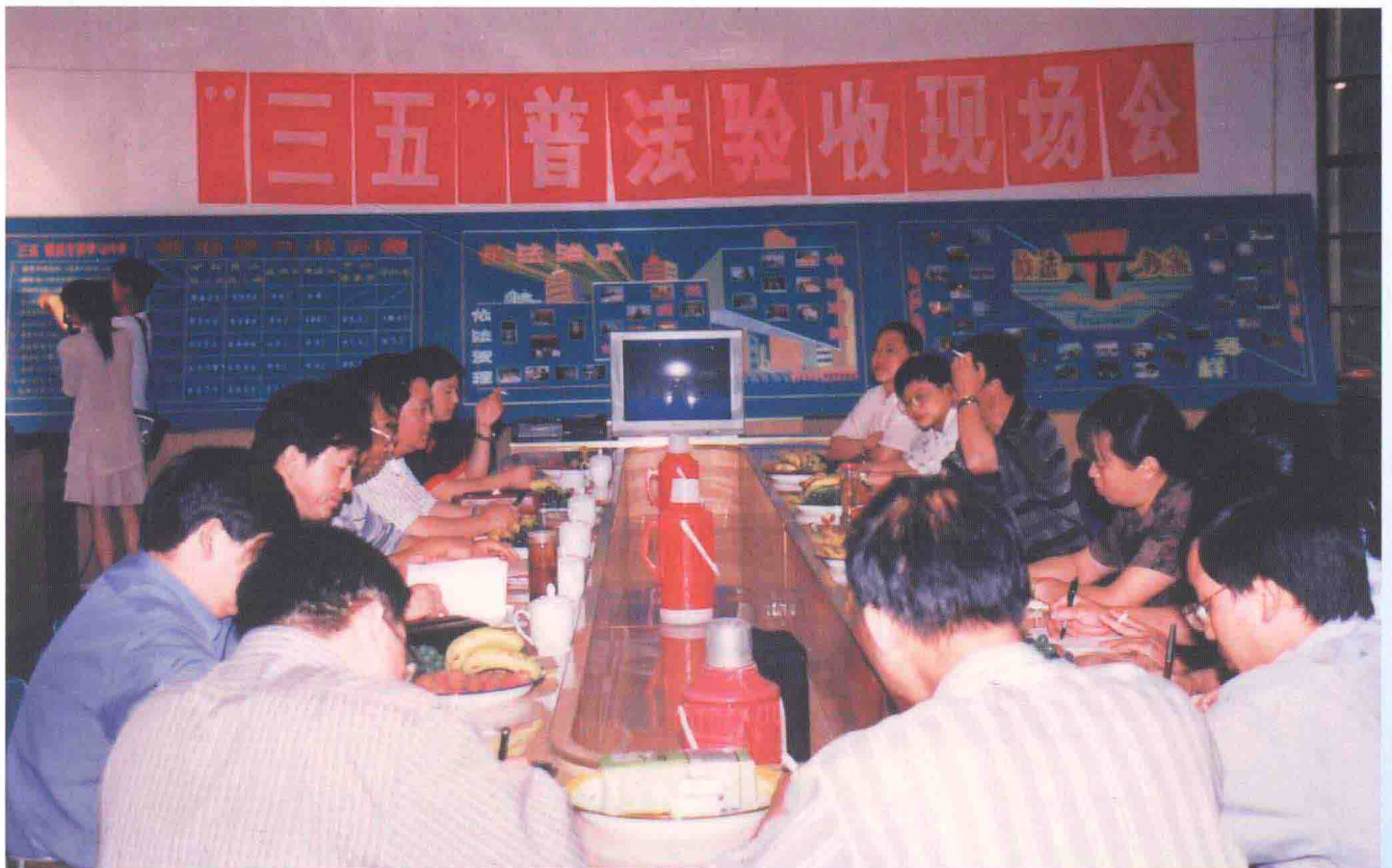
1999年，“三五”普法验收现场会。