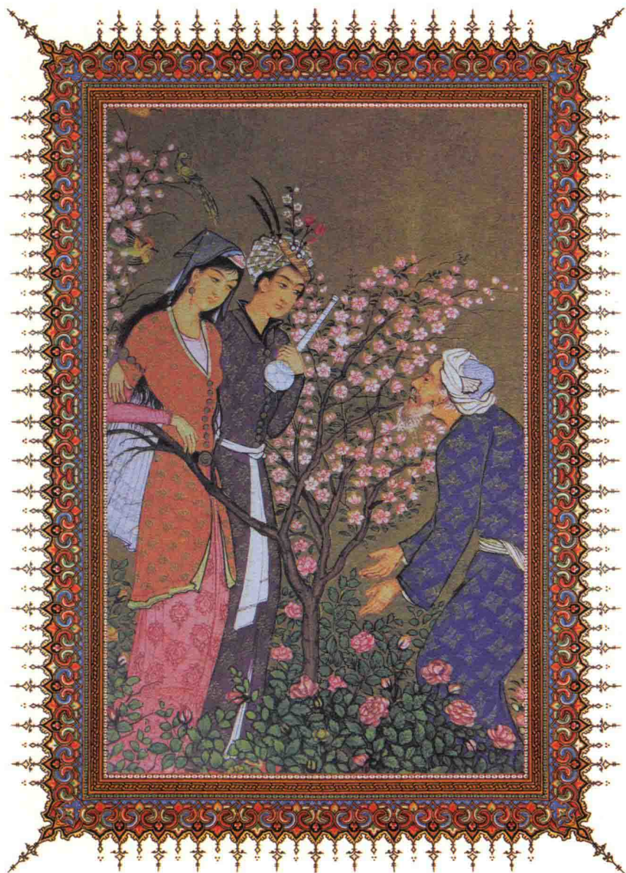
▲ 询问我触手可及的爱情