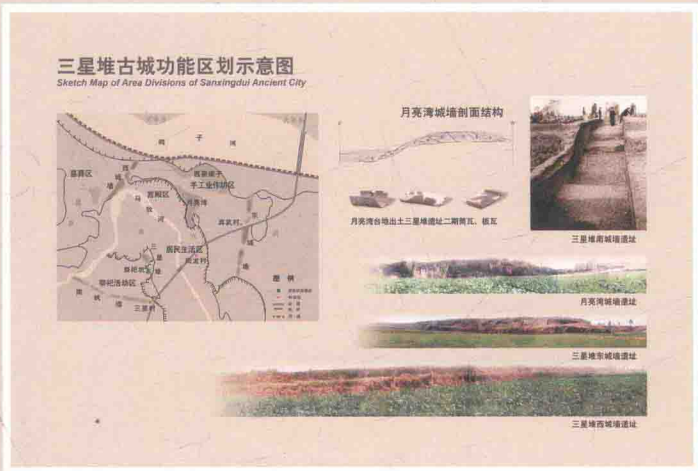
三星堆古城功能区划示意图