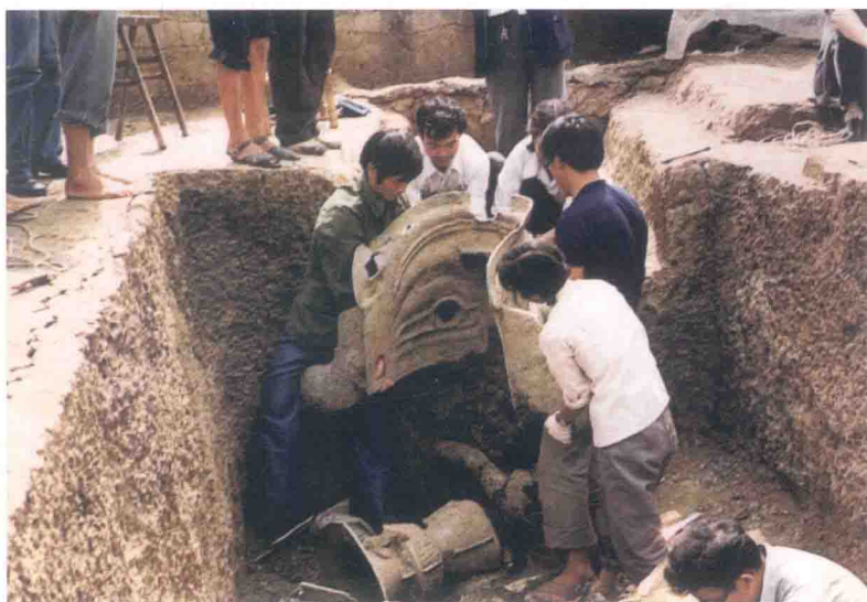
二号祭祀坑出土铜纵目面具场景

该面具出土时，尚见眼、眉描黛色，口唇涂朱砂。其整体造型意象神秘诡谲，风格雄奇华美，在三星堆各类人物形象中颇显特出。一般认为，面具的眼睛大致符合史书中有关蜀人始祖蚕丛“纵目”的记载。亦有认为“纵目”应是“竖眼”之意，即如中国古代神话人物二郎神额中的眼睛，其形象可能是祖先神造像。或联系夔龙形额饰的造型，认为它与神话中“人首龙（蛇）身”、“直目正乘”的天神烛龙有关。