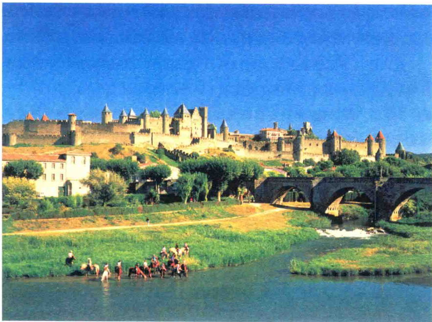
▲ 法国的卡尔卡松古城堡

这座城堡原是法兰克人的领地,460年被西哥特人占领,后来才回到法兰克王国的手中。