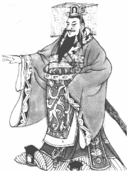
穿戴冕服的秦始皇画像

西周时，等级制度逐步确立，周王朝设“司服”“内司服”官职，掌管王室服饰。根据文献记载和出土文物分析，中国冠服制度，初步建立于夏商时期，到周代已基本完善，春秋战国之交被纳入礼治。王室公卿为表现尊贵威严，在不同礼仪场合，顶冠既要冕、弁有序，穿衣着裳也须采用不同形式、颜色和图案。从周代出土的人形文物看，服饰装饰虽繁简不同，但上衣下裳已分明，奠定了中国服装的基本形制。