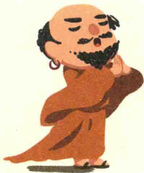
菩提达摩 禅宗初祖