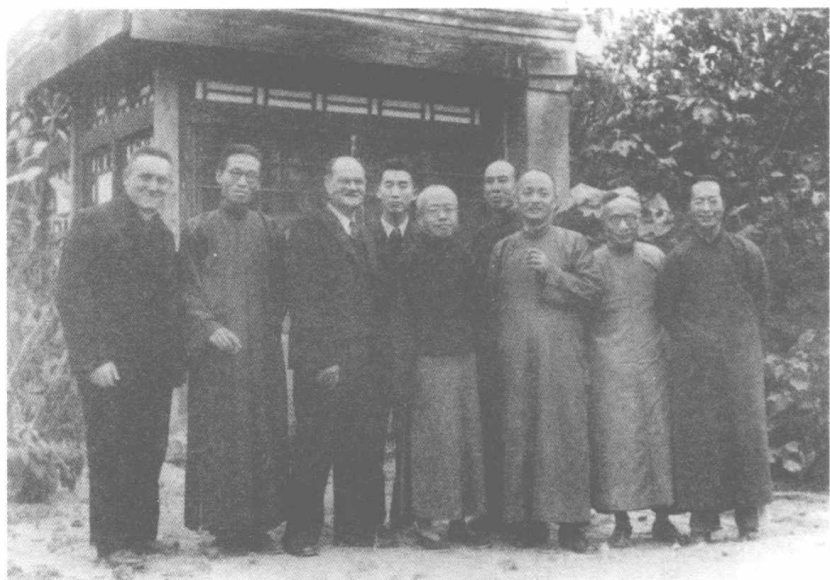
20 世纪 40 年代，朱光潜（前排右二）与北大教授们合影