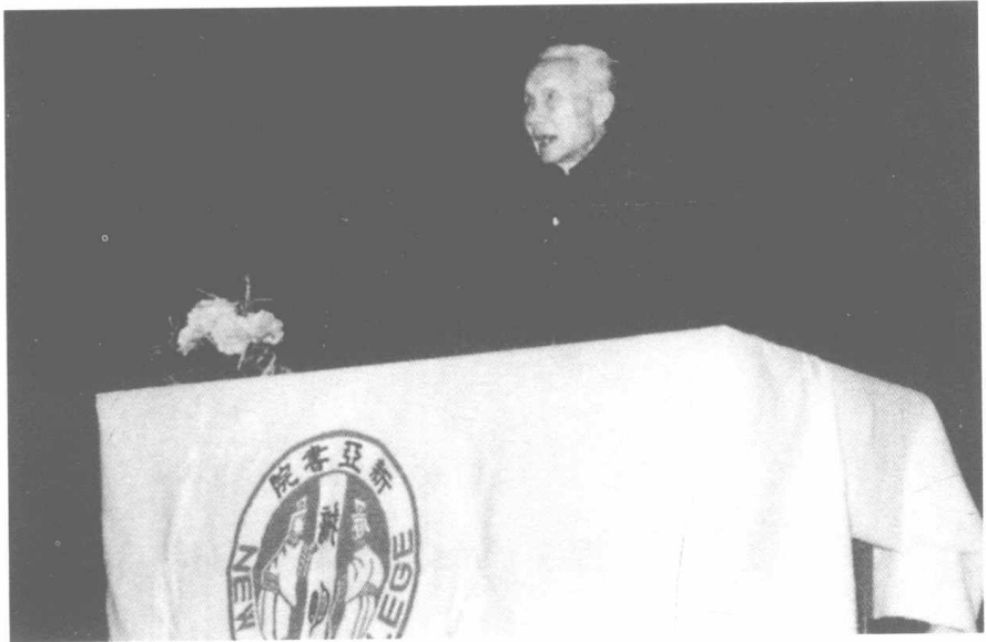
1983年朱光潜在香港新亚书院讲学