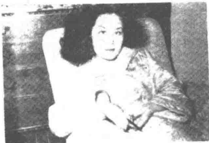
(攝翁飛翁)·光白的內室·

白光又會大膽的說過，祇要誰擁五萬元美金，她就願意下嫁，坦白的說來，她所嫁的對象是美金，