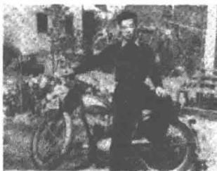
· 暫一之時勤運在原史 ·

一手很好的文章，有着青年前進的筆調，頗能引人入勝，這是他的特長。此外他對於交友有着很深的考慮。認爲古人所謂「在家靠父母，出外靠朋友」的，二句聖語，他是最爲需要的，所以他的爲人，和籠可親，善結四海中各色各樣的朋友。也肯爲朋友們