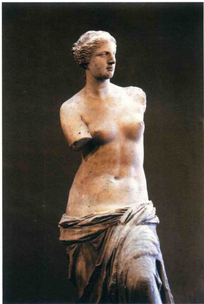
《米洛的维纳斯》( Venus de Milo )