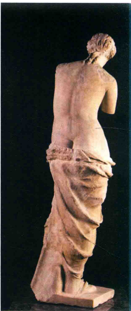
《米洛的维纳斯》正、背面