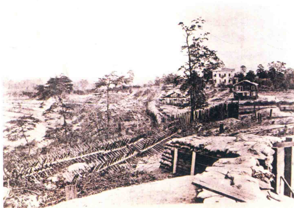
亚特兰大战役：上图为联邦军的一处炮兵阵地，位于桃树街附近，摄于1864年； 下图为邦联军的一处防御工事，摄于1864年