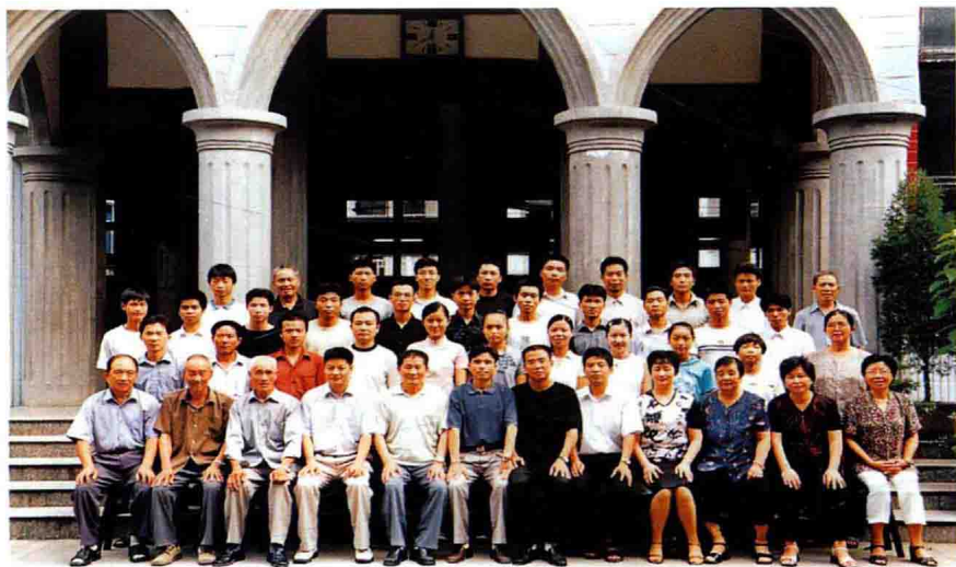
城关二堂义工培训班留影