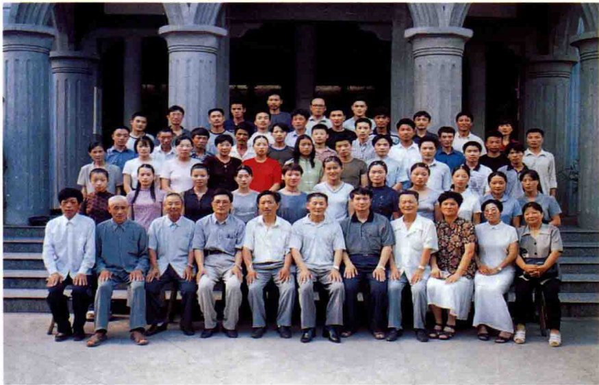
一九九九年九月福鼎市基督教“两会”义工培训班结业留影