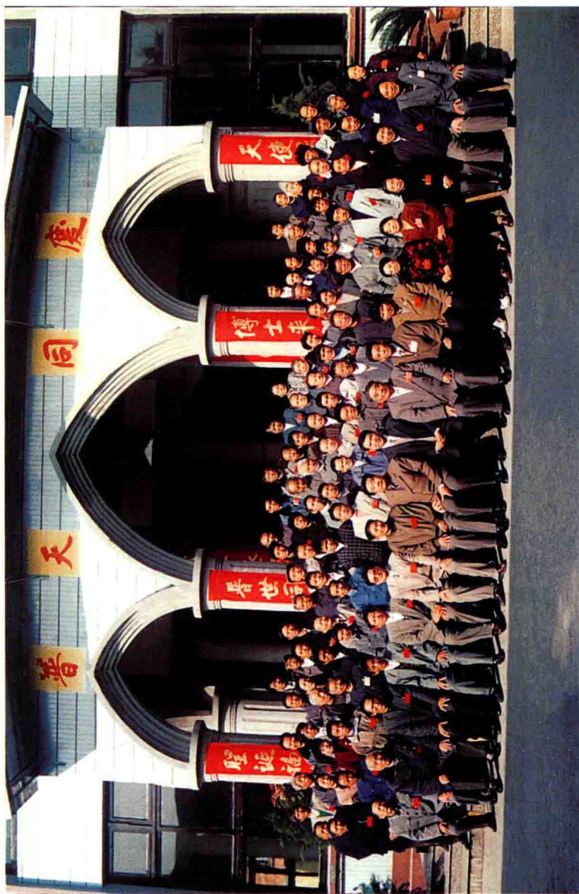
一九九八年十二月福鼎市基督教三自会第七届代表会议代表合影