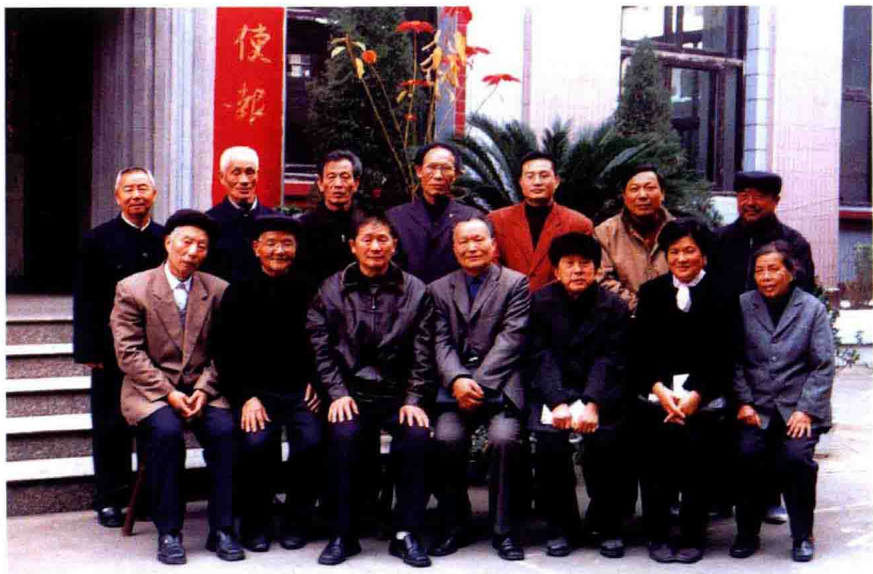
《福鼎基督教志》审稿会成员留影