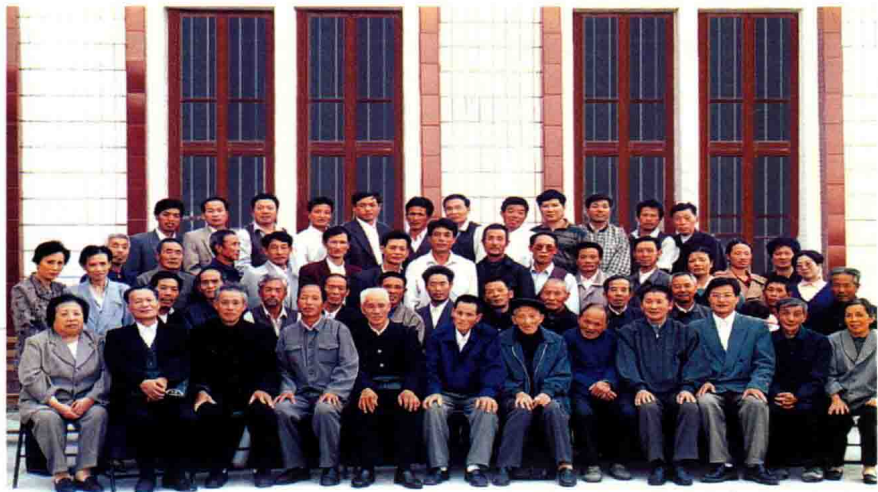
一九九九年十一月福鼎市基督教“两会”首届年会代表合影