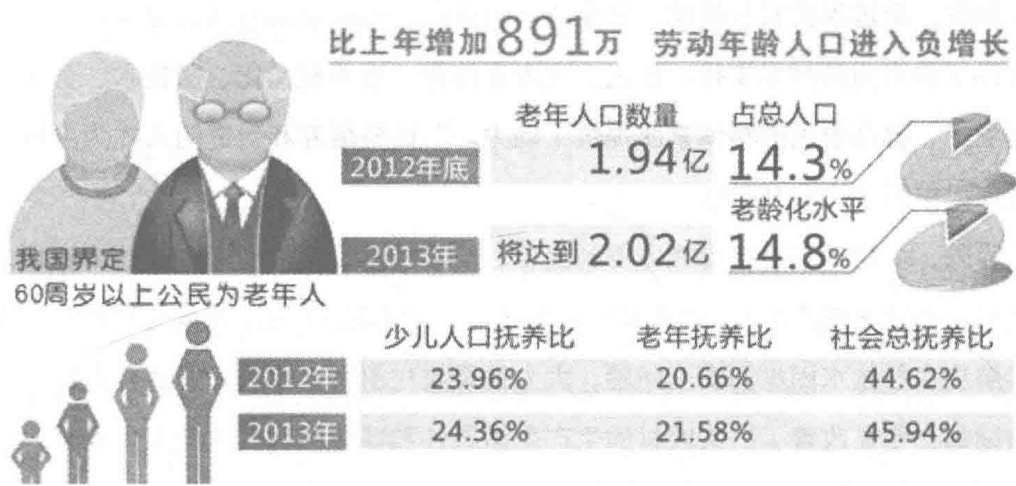
全国老龄委办公室发布蓝皮书——《中国老龄事业发展报告（2013）》

人口老龄化促进乡村旅游发展。据《中国老龄事业发展报告（2013）》显示：2012年，我国60岁及以上人口占总人口的比例为14.3%，2013年预计将达到14.8%（国际上把60岁以上人口超过总人口的10%作为一个国家和地区进入老龄化的标志）。报告还显示，中国老年人口基数大，人口老龄化进程快，老年人慢性病患率高，再加上老年人的“怀乡”情结，为发展乡村旅游提出了新要求。