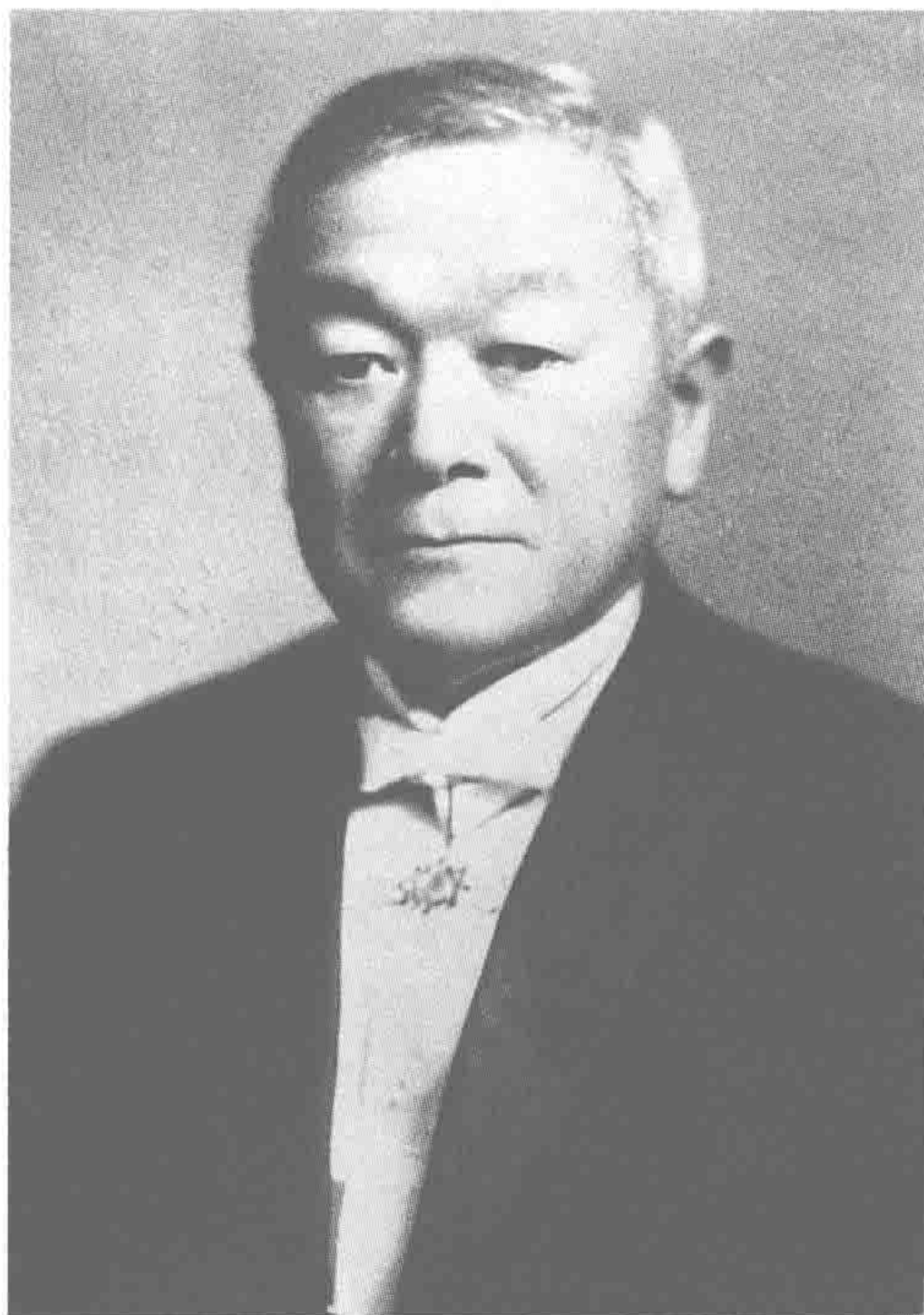
◎ 晚年时留影（采自《内藤湖南全集》）