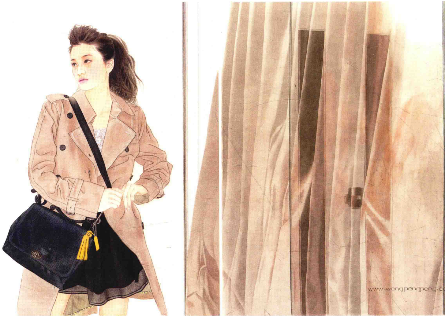
今天的你，昨天的我 110×176cm 纸本重彩 2015年