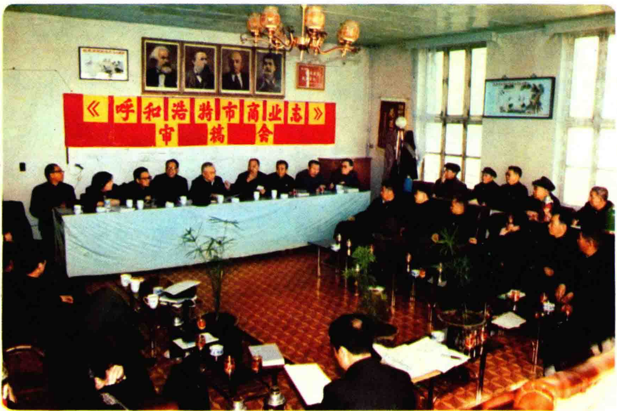
《商业志》审稿会会场