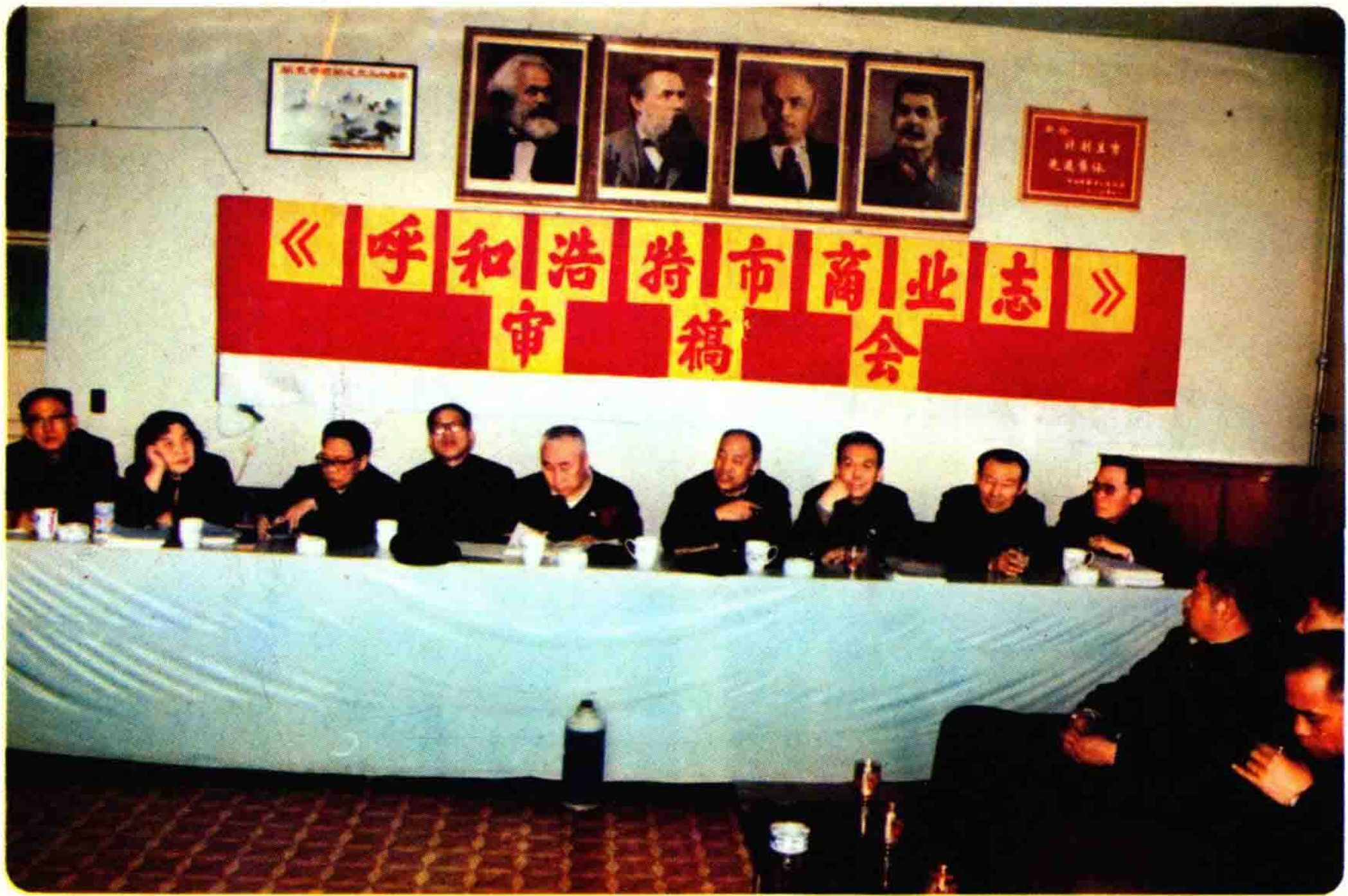
《商业志》审稿会主席台