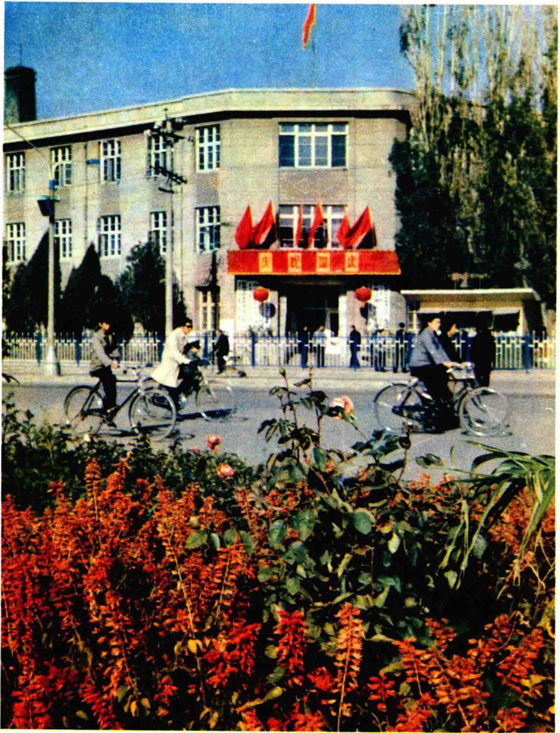
呼和浩特市商业局办公大楼