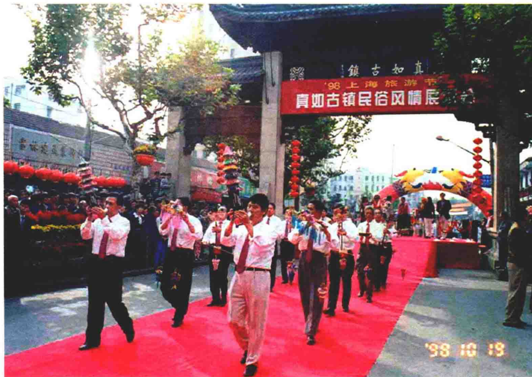
1998年，带彩头的丝竹乐手在真如庙会上进行行街表演

活动百余年来从不间断，全盛时期覆盖了整个上海市区和郊县，丝竹乐爱好者常在固定场所进行演奏活动，相互交流，共同琢磨，使江南丝竹这一乐种有了更多的发展。