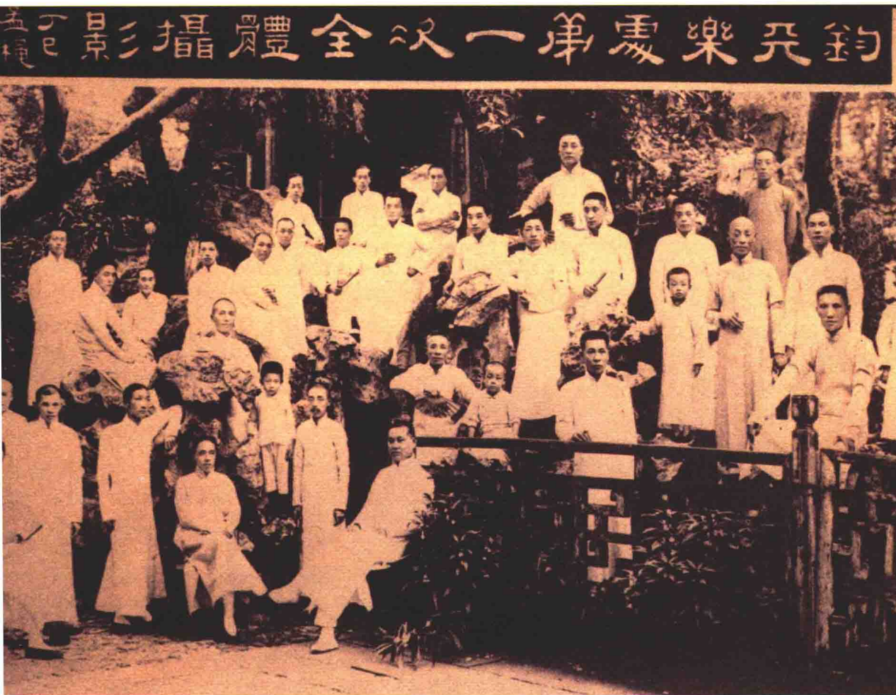
1917年，钧天乐社第一次全体集会

1911年后，江南丝竹的发展逐渐以上海为中心，出现了许多演奏团体，如“文明雅集”、“清平社”、“钧天社”等。1920年左右，在上海城隍庙点春堂举行了一次各地丝竹音乐爱好者集会，到会者有200多人。上海的丝竹