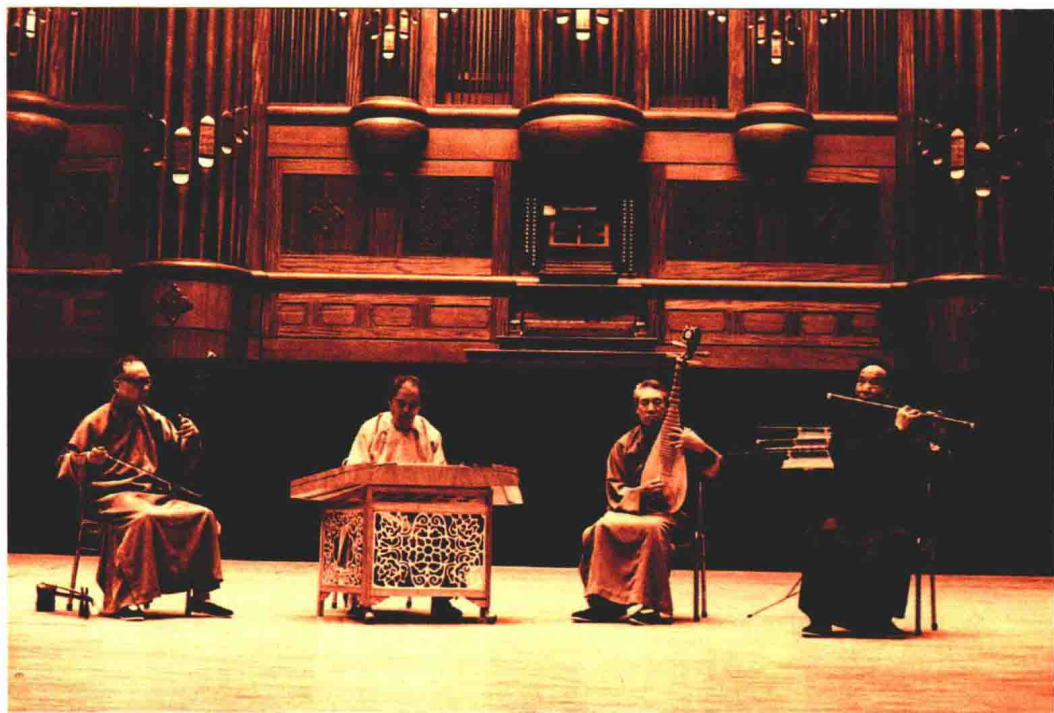
1994年，江南丝竹专场音乐会在台北音乐厅举行，丝竹名家周皓（左一）、周惠（左二）、马圣龙（右二）、陆春龄（右一）合奏丝竹曲

上海现有江南丝竹国家级非物质文化遗产项目代表性传承人陆春龄、周皓、周惠、沈凤泉等四位。陆春龄，是我国南派笛艺的杰出代表之一，享有“江南笛王”美誉。他一生与江南丝竹结下不解之缘，创作、改编和整理相关曲目两百多首，录制唱片近一百张。扬琴演奏家周惠、二胡演奏家周皓两兄弟出身于丝竹音乐世家，与琵琶演奏家马圣龙和笛子演奏家陆春龄合作演奏江南丝竹长达数十年，为上海地区江南丝竹的四大名宿。沈凤泉，著名二胡演奏家，其演奏的江南丝竹乐曲既保持了传统的演奏特点，又融合了现代二胡的各种技艺，有江南丝竹二胡演奏南汇派开创者之称。他们为江南丝竹的传承、发展做出了突出贡献。