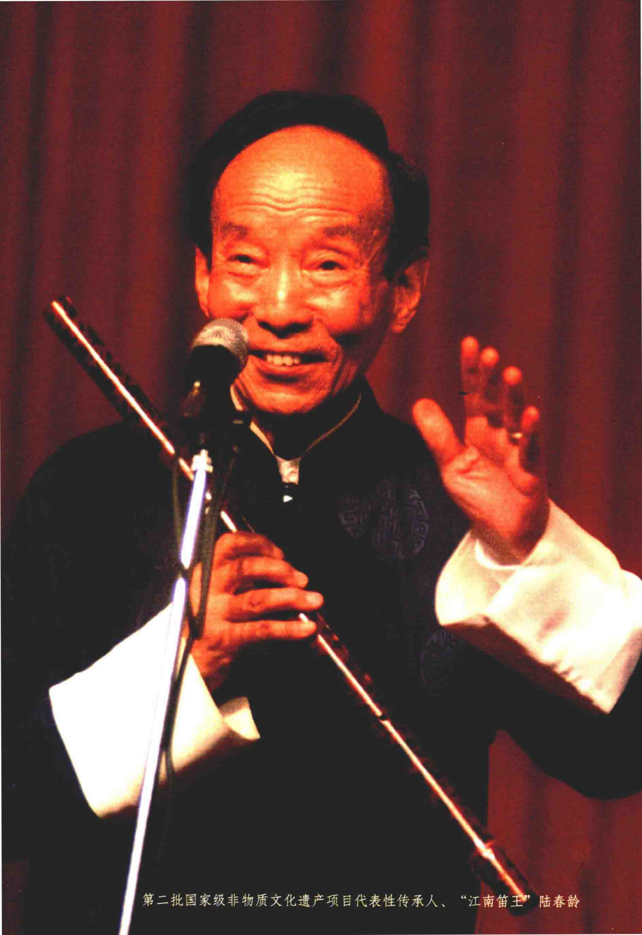
第二批国家级非物质文化遗产项目代表性传承人、“江南笛王”陆春龄