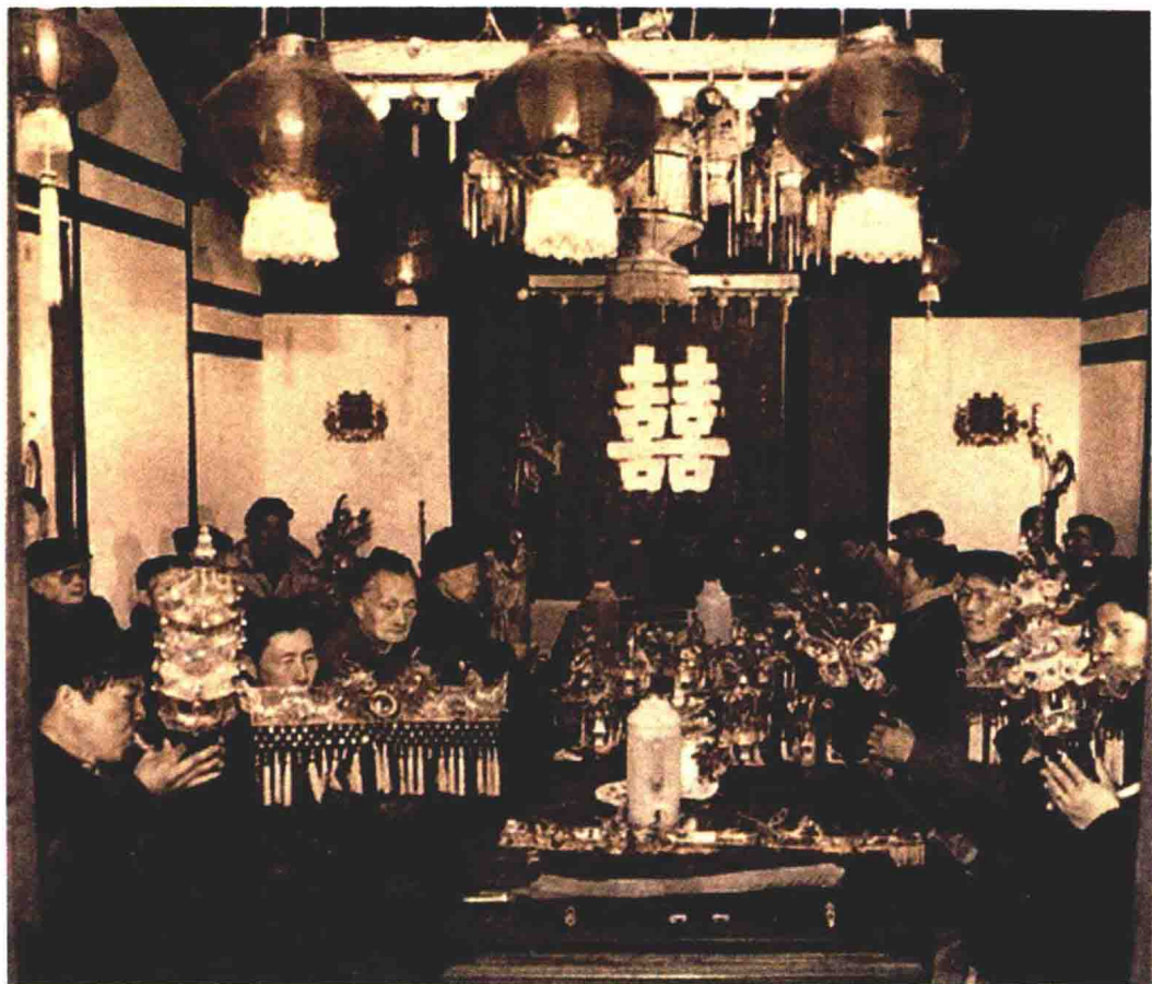
传统清音班应邀在婚礼上助兴

江南丝竹传统的技法中有你繁我简、你高我低、加花变奏、嵌档让路、即兴发挥等手法，逐步形成“小、细、轻、雅”的风格特色。因此，上海江南丝竹最大的音乐特点之一就是演奏风格秀雅精细，在合奏时各个乐器声部既富有个性又互相和谐。