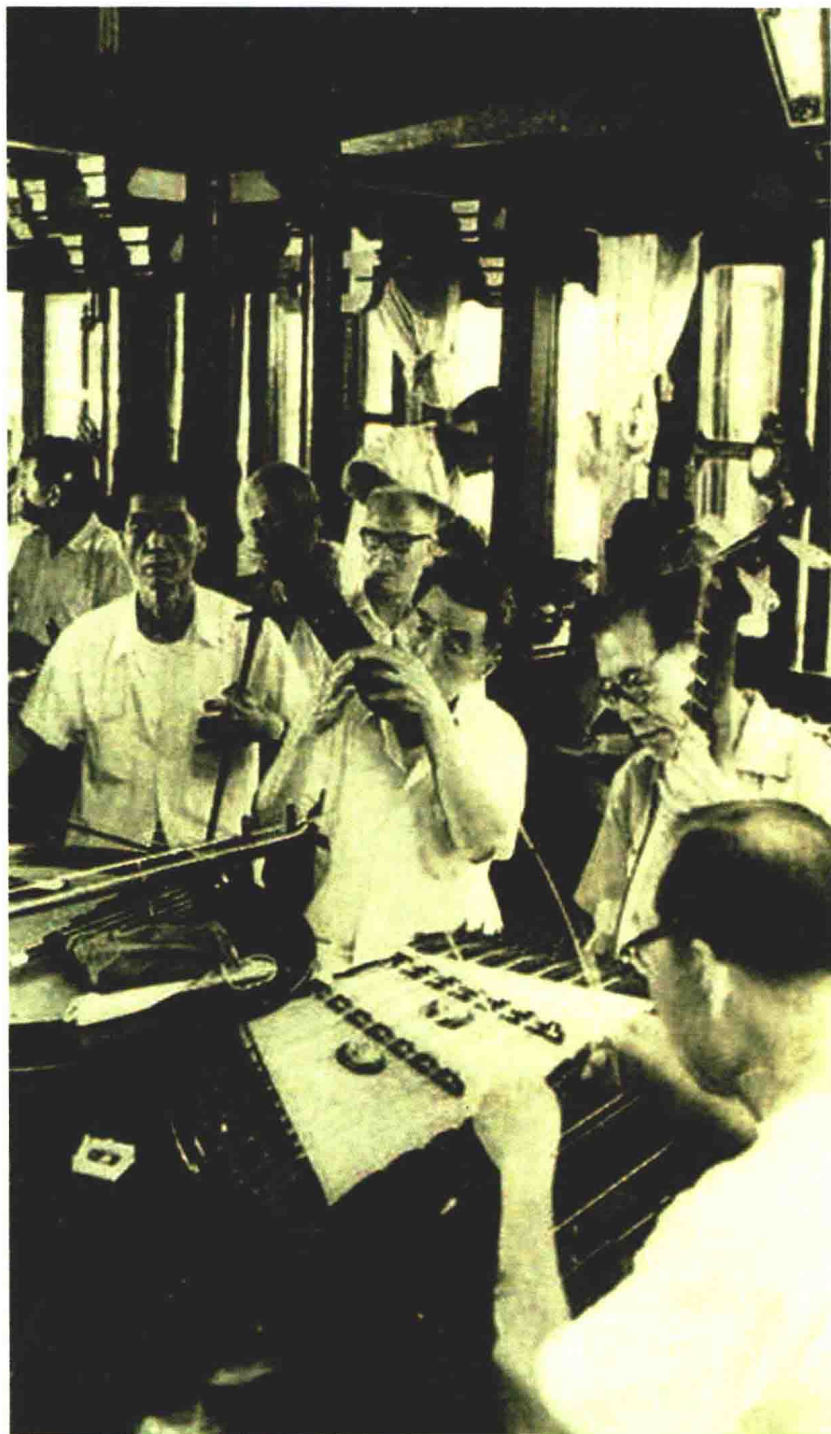
江南丝竹爱好者在上海城隍庙湖心亭活动