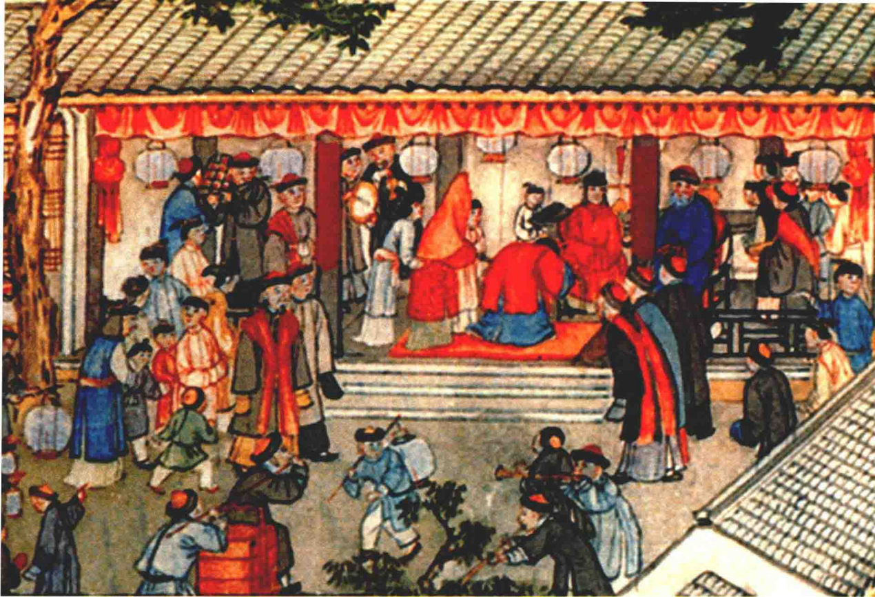
清代在婚礼中奏乐助兴的丝竹班子