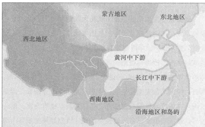
中国文化地理分区示意图

先从北边说起：蒙古地区横跨中国的北方，草原上的牧人逐水草而居；而东北地区，有大河和密集的大树林，那里的居民靠渔猎为生。草原牧人与东北森林居民是最早接触和交流的族群，他们的生活习惯有不同处，也有相同处，不同处是森林居民比较定居，相同处是他们都靠牧、猎为生，都能跨马作战驰骋千里，攻伐其他地区的居民。中国历史上重要事件之一，就是北边的牧人和猎人，会时时因粮食不足而