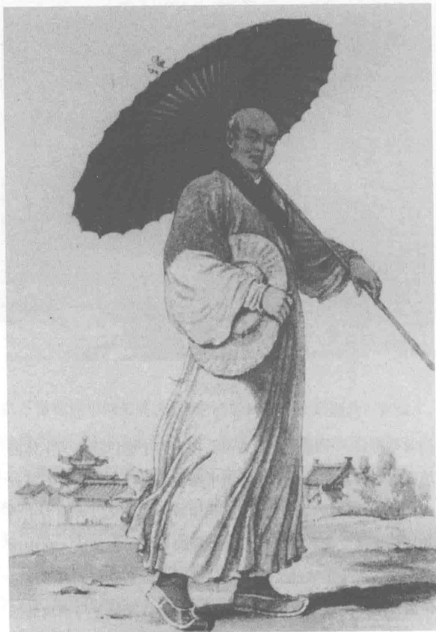
清代西方人所画的中国和尚