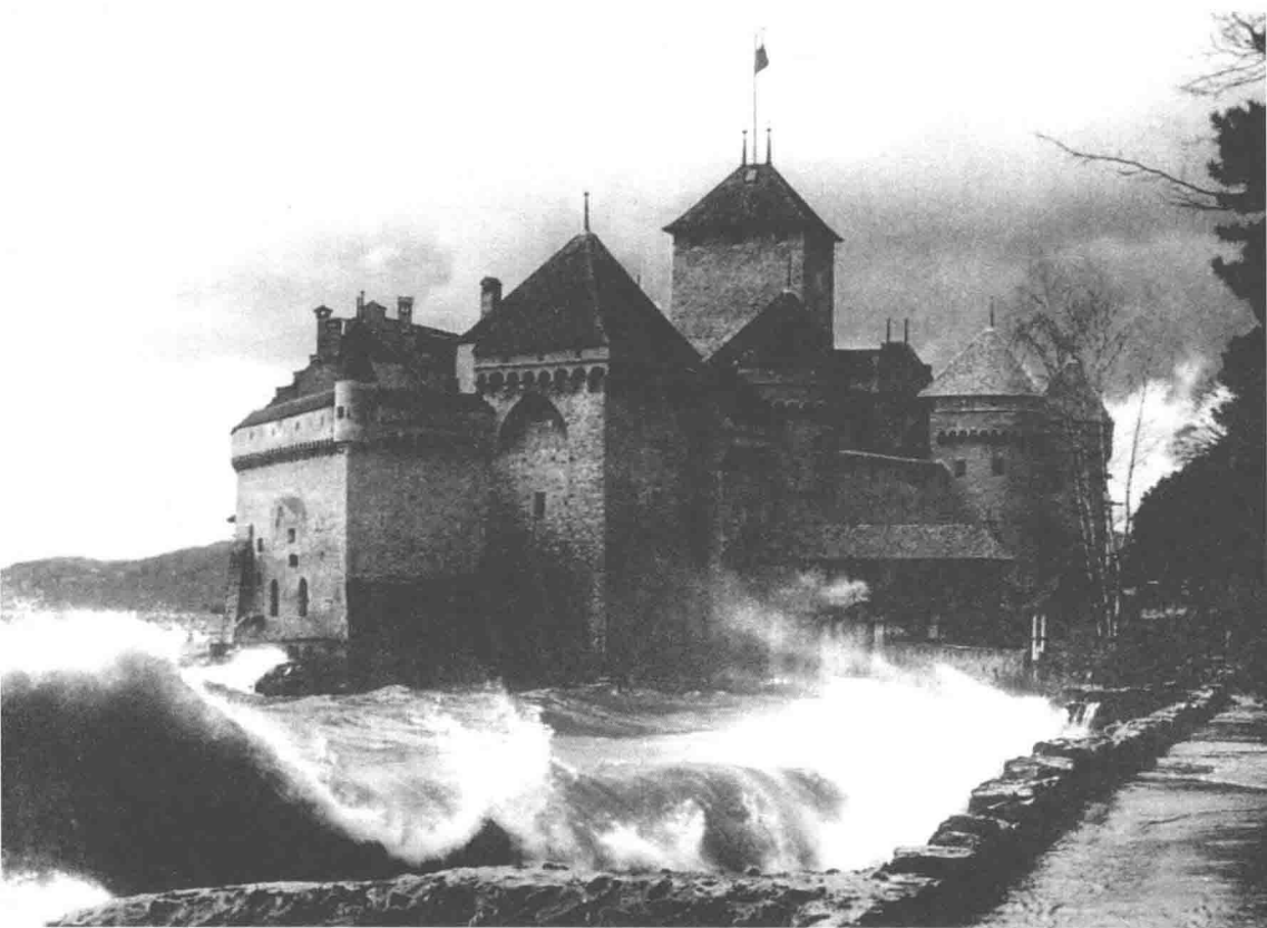
希隆古堡，欧洲最诡秘的城堡，近代第一批旅行者的向往。