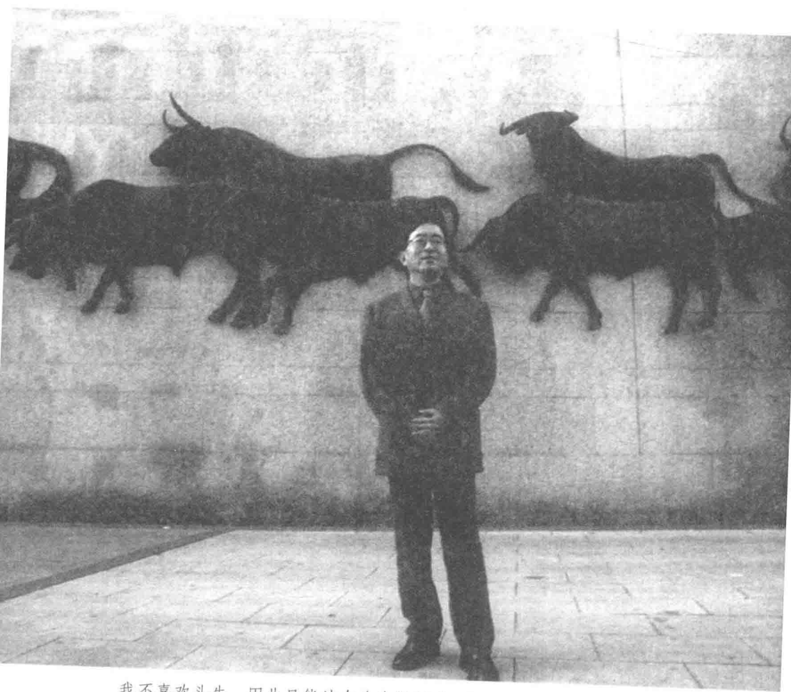
我不喜欢斗牛，因此只能站在斗牛场门外，默默祭奠这些人类最忠厚的朋友。