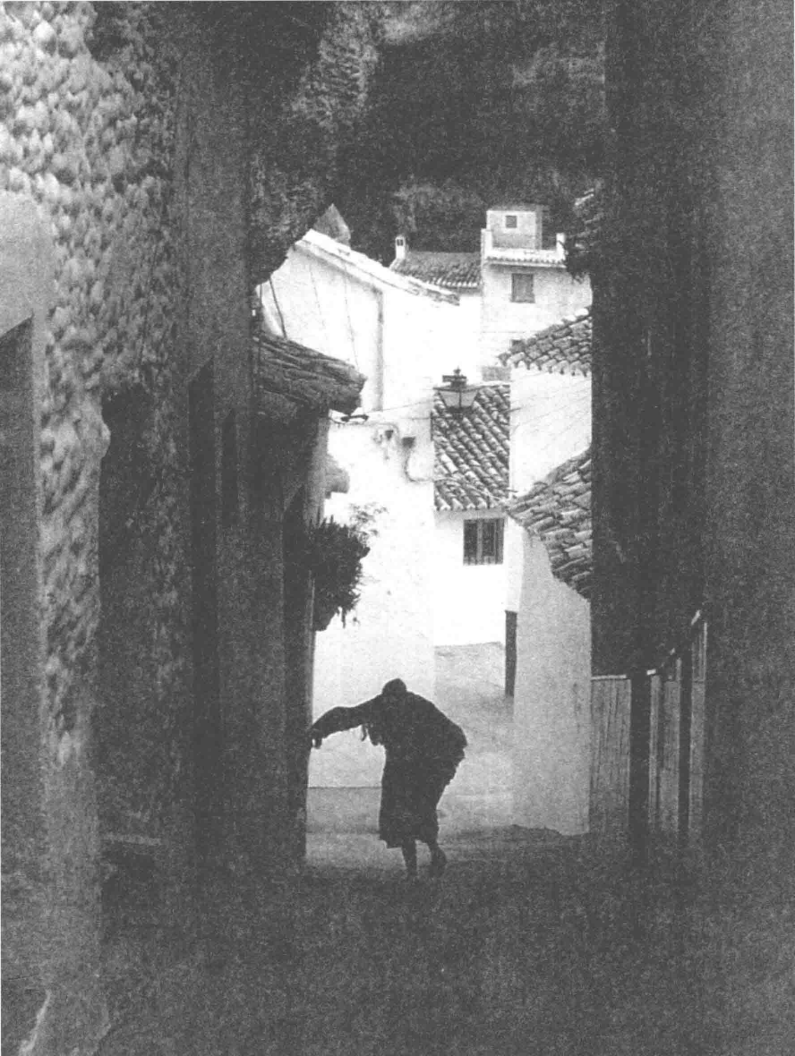
塞维利亚的小巷，走出过唐璜、费加罗和卡门。