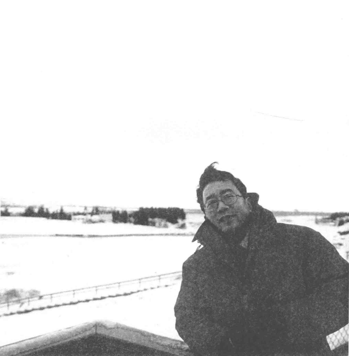
冰岛的魅力和恐怖，都在严冬。