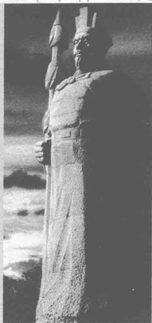
◀ 丝绸之路开拓者张骞雕像在其故里陕西汉中城固县