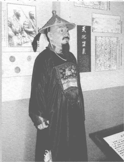
▲时任陕甘总督的左宗棠力主收复新疆

入侵，天山南北全部陷落。为了收复新疆，积贫积弱的清政府拼足了力气，好不容易拼凑军饷，调集军队，整装待发，但就在这时，日本又趁机出兵占据台湾，引发东南沿海海防危机。时任直隶总督的李鸿章公然主张放弃新疆，认为新疆乃化外之地，戈壁千里，人烟稀少，乾隆年间平定准噶尔、大小和卓之乱，毕全国之力，徒收数千里赤地，增加开支千百万银两，所得不抵所失。