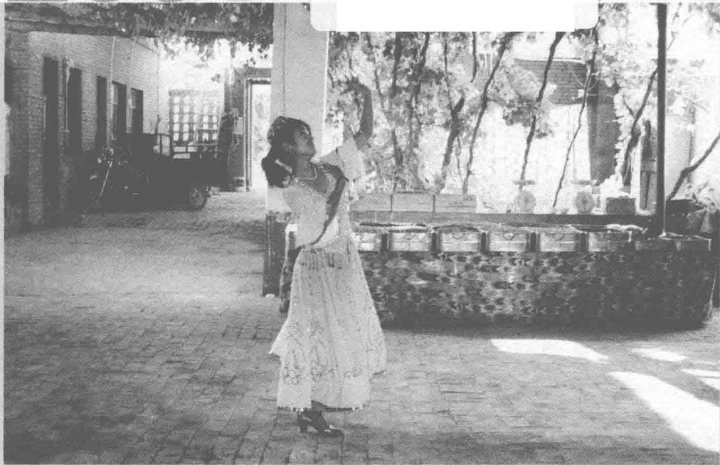
▲一位维吾尔族姑娘在自家的葡萄架下起舞

管理、开发西域的序幕，也使高昌进入了一个崭新的历史阶段。高昌古城曾被誉为“长安远在西域的翻版”，意思高昌平定之后完全按长安城规划建设，其城墙高达十二米，城门则冠以“玄德门”“金福门”“金章门”“建阳门”等中原名称。城门外则有瓮城护围。城内更是署衙、司狱、文庙、佛殿、城隍庙、三圣祠、接官厅、演武厅一应俱全。作为丝路重镇，自然驰驿奔诏，往来使者相望于道，东来西往的商队、驼队马帮络绎不绝。高昌城内完全按大唐西市模式，街道纵横，店铺林立，商幡招展，市声喧嚣，来自中亚、西亚乃至欧洲的波斯人、大食人、安集延人，以及周边回纥、吐蕃、突厥，不同民族，不同肤色，不同装束，不同语言的商人、僧人、旅人、艺人统统汇聚到高昌，给高昌带来了空前的繁荣。据吐鲁番出土的文书记载，唐时高昌城中，仅是商品行业，便有谷麦行、帛练行、布行、彩帛行、钫釜行、菜籽行以及经营驼马、鞍具、毛皮、饲草、药物、皮靴的，还有各种旅店、饭铺、酒楼、菜肆、浴池、歌苑等餐饮、娱乐休闲场所，不难想见当年高昌是何等繁华。另外，高昌作为长安和西域之间重要的商埠，也成为各种宗教文化汇聚之地。当地佛教昌盛，唐代高僧玄奘去印度取经途经高昌，曾被高昌国王奉为上宾，拜为国师。至今高昌故国还留有一座万余平方米的佛教寺院遗址，由此不难想见其晨钟暮鼓、香烟缭绕、万头攒动的佛事盛况。可惜，这座千年古城毁于宋末元初的战火，只是由于吐鲁番干旱少雨的特殊气候，方为我们留下这座高昌古城，是幸运也是奇迹！