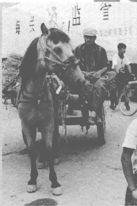
▲维吾尔族群众使用的马车

语，仿佛叙说着长长的旧事。若是登上那高大的城垣，放眼望去，这片巨大的城垣在戈壁绿洲中，宛如童话中的古堡傲然屹立。远处，仿佛驼铃叮咚，驼队逶迤。“无数铃声摇过碛，应驮白练到安西”，立时把你带入云烟苍茫的历史深处。