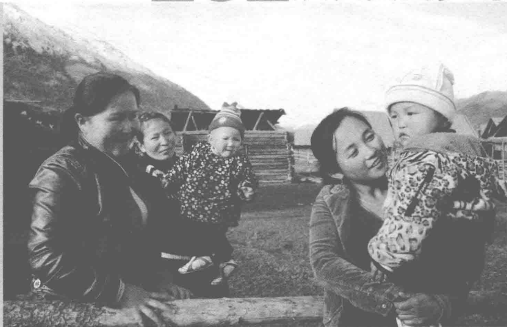
▲现在的新疆是各民族的共同家园

无不欢欣鼓舞。西征大军在当地群众的大力支持下，仅用两年时间便全歼阿古柏匪帮，收复了天山南北的大片疆土和被俄国占领的伊犁就城，维护了国土的完整。