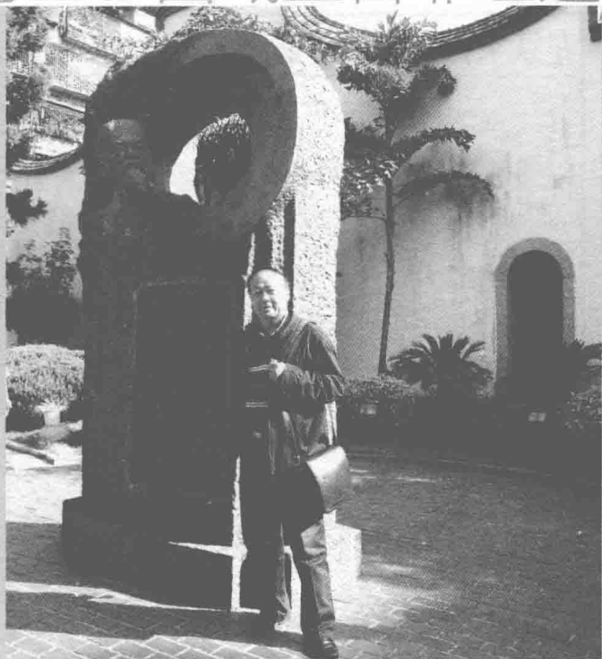
▲作者在福州林则徐故居

1848年，林则徐复出，任云贵总督。两江总督陶澍的女婿湘中名士胡林翼向林则徐推荐左宗棠，称赞其“近日楚才第一”，文武之学可堪大用。林则徐即致信左宗棠去云贵总督府入幕。其时陶澍过世，左宗棠正为其打理家务，对林公早“心神倚，惘之欲随”，常以未能去仰慕已久的林公