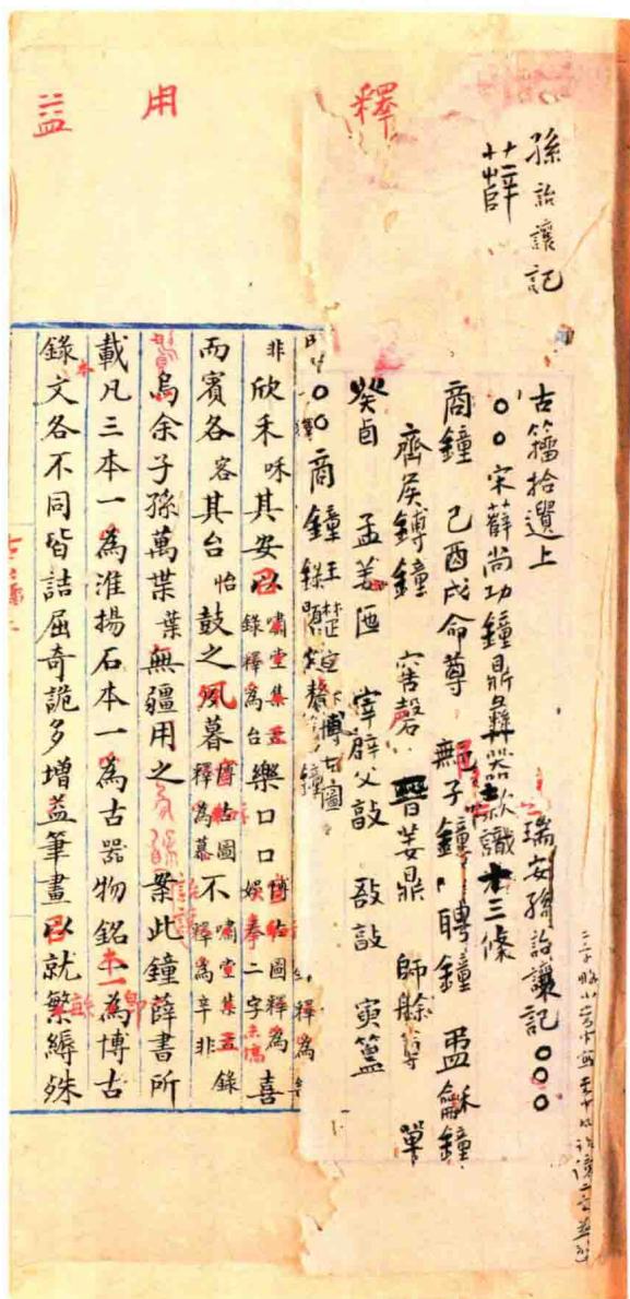
古籀拾遺三卷 (清)孫詒讓撰 稿本