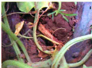
发病植株茎基部变褐腐烂