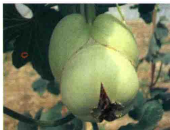
彩图 44 畸形瓜