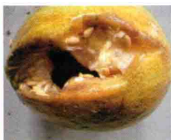
果实发病后期症状