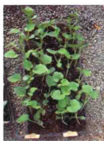
彩图 36 甜瓜高脚苗