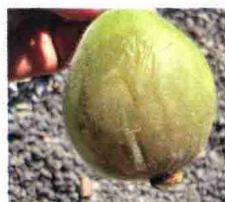
果实发病初期症状