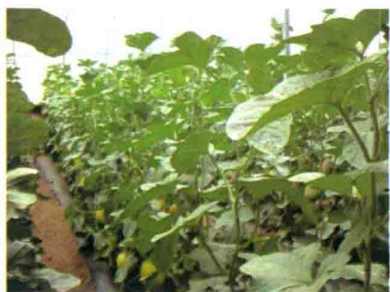
彩图 3 日光温室甜瓜生产图