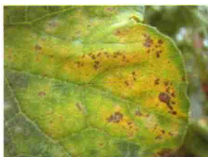
发病初期叶面呈水渍状褐色斑点