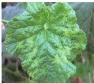
斑驳型病毒叶片发病症状