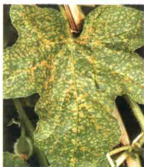
彩图 21 甜瓜褐点病叶面病斑