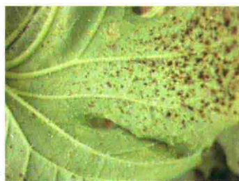
彩图 47 白粉虱诱发煤污病