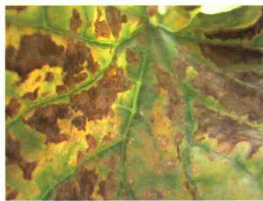
发病后期叶片症状（正面）