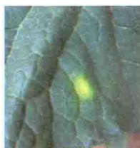
霜霉病发病初期叶片