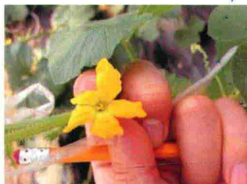
彩图 48 黄蓍马