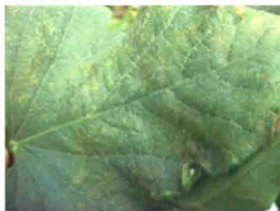
叶片发病初期症状