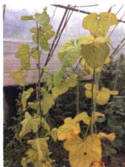
彩图 40 甜瓜黄化症