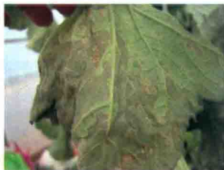
叶背发病后期症状