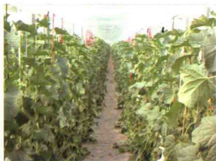
彩图 2 大棚甜瓜生产图