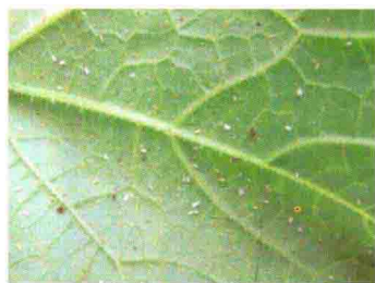
彩图 46 白粉虱