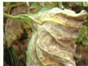
叶背发病后期症状