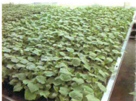
彩图 1 瓜类育苗床