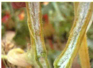
发病植株茎维管束变褐