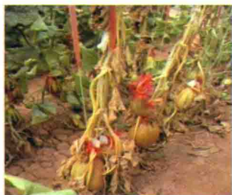
发病植株枯萎死亡