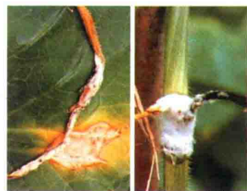
彩图 31 甜瓜菌核病叶片、叶柄病斑