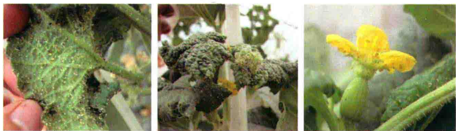
彩图 45 瓜蚜为害叶片和幼瓜症状