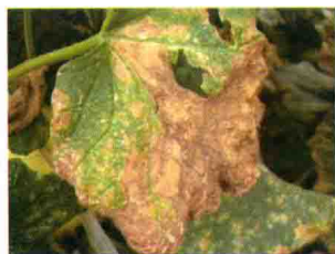
发病中期叶缘呈“V”字形褐斑