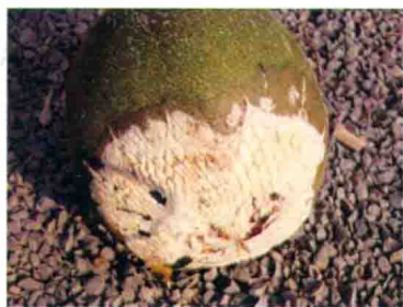
彩图 27 甜瓜链孢霉红粉病病瓜