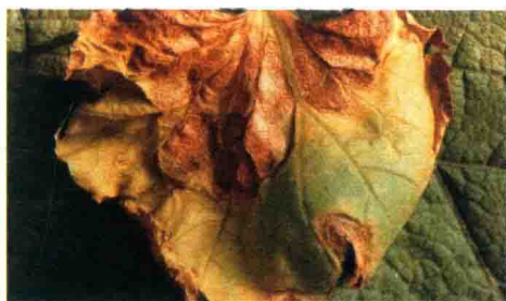
彩图 23 甜瓜靶斑病叶面病斑