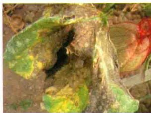
叶片发病后期症状