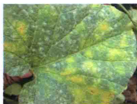
霜霉病发病中期叶片