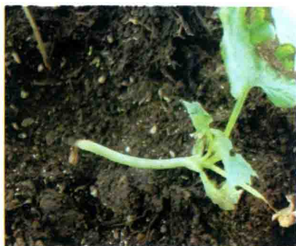
彩图 5 甜瓜猝倒病