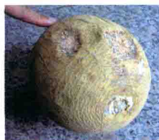
果实发病后期症状