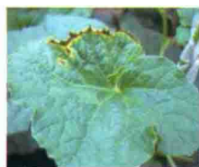
叶片发病初期症状