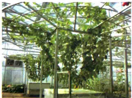
彩图 4 甜瓜水培