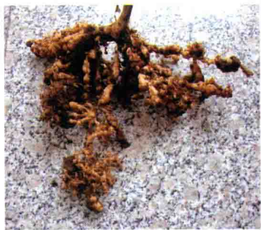
彩图 14 甜瓜根结线虫病发病症状