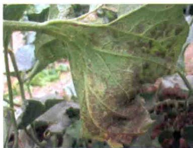
发病后期叶片症状（背面）