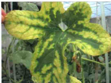
彩图 38 甜瓜缺镁症状