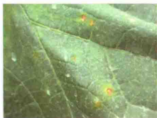
叶片发病症状（正面）