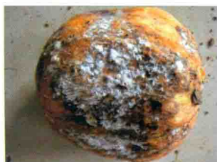
彩图 25 根霉果腐病病瓜