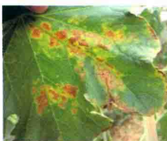
叶片发病中期症状