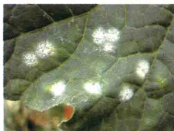
白粉病发病初期叶片