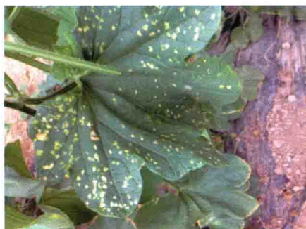
彩图 20 甜瓜叶点病病斑