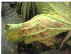
霜霉病发病后期叶片(背面)