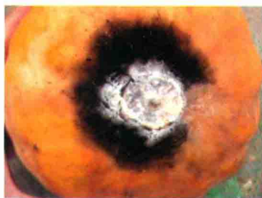
彩图 33 甜瓜白绢病病果