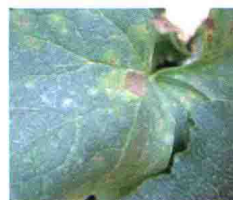
叶片发病初期症状