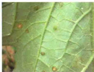
叶片发病症状（背面）