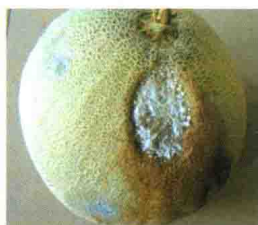
彩图 26 甜瓜酸腐病病瓜