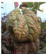
叶面发病后期症状