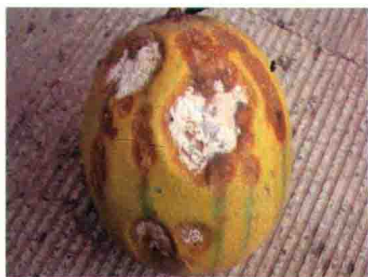
彩图 28 甜瓜红粉病病瓜