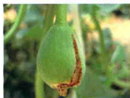
病瓜病部开裂有红色黏稠物溢出