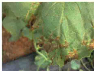
叶片发病后期症状