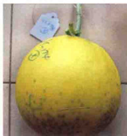
彩图 37 甜瓜缺钙症状