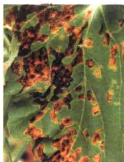
彩图 22 甜瓜黑斑病叶面病斑