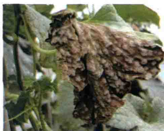
白粉病发病后期叶片