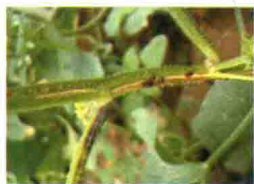
茎和叶柄发病症状