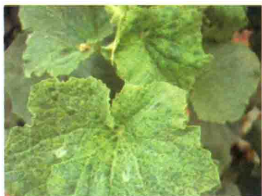
花叶型病毒叶片发病症状