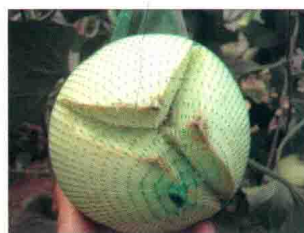
彩图 43 生理裂瓜