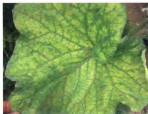
彩图 39 甜瓜缺铁症状