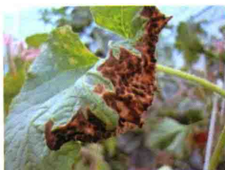
叶片发病中期症状