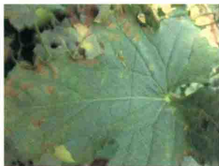
叶片发病中期症状