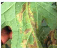
叶背发病中期症状