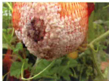
彩图 32 甜瓜菌核病果实