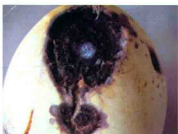
彩图 30 炭腐病病瓜