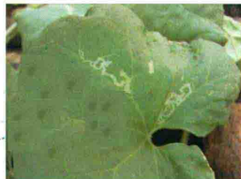
彩图 49 美洲斑潜蝇为害症状