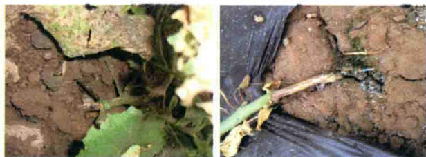
彩图 24 甜瓜根腐病植株茎基部