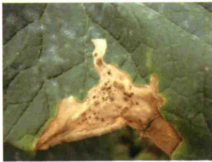
彩图 15 甜瓜灰霉病叶片“V”字形病斑