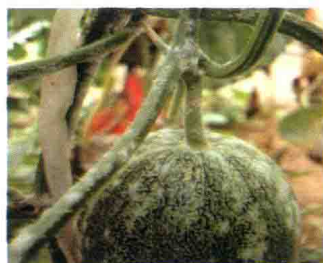
白粉病病瓜和病茎