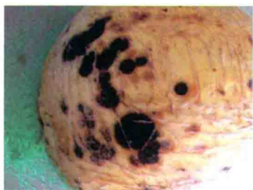
彩图 29 甜瓜褐腐病病瓜