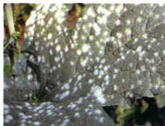
白粉病发病盛期叶片