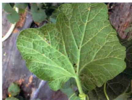
彩图 19 甜瓜炭疽病