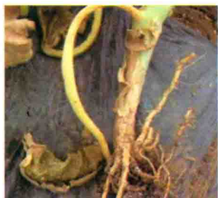
发病植株根部变褐腐烂