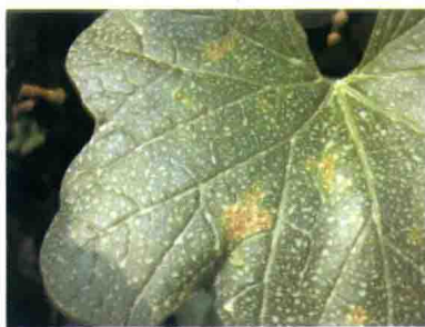
发病初期叶片症状