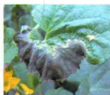
叶片发病中期症状