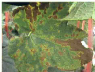
叶片发病后期症状