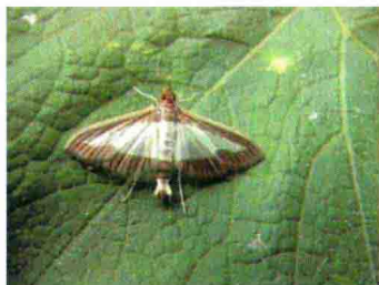
彩图 50 瓜绢螟幼虫和成虫