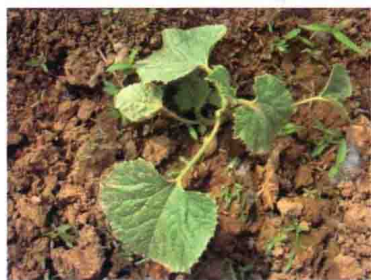
彩图 35 甜瓜冷害