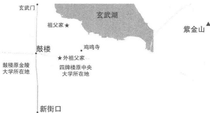
南京市区鼓楼至鸡鸣寺一带示意图