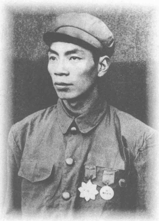
特等功臣、特级战斗英雄杨根思