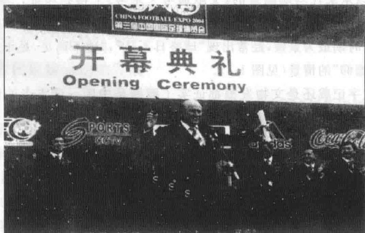
图 1-2 布拉特宣布足球运动起源于中国

国是足球的故乡,中国淄博是足球最早发源地”这一论证得到了国际足联和亚足联的一致认同。国际足联主席布拉特先生(见图 1-2)在开幕式上对几百位来自国际足联、亚足联的官员和世界各地的嘉宾说道,“淄博临淄的蹴鞠,对足球运动的发展有着极大的贡献,感谢中国将这项运动带给了世界,世界因为有了足球而变得更精彩!”