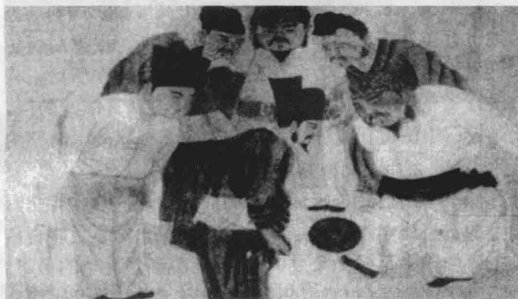
图 1-1 宋太祖在蹴鞠

无论文字记载还是文物发掘都证实了蹴鞠是中国一项古老的体育运动。流行了数千年的蹴鞠的兴衰，符合人类社会发展变化的历史规律。岁月变迁，曾经一度消亡的古代蹴鞠又在现代足球中获得新生。