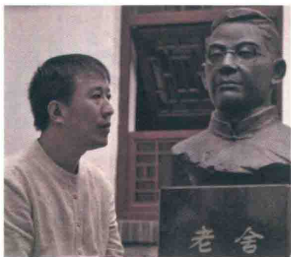
魏新，文化学者，全国青联常委， 央视《百家讲坛》主讲人。