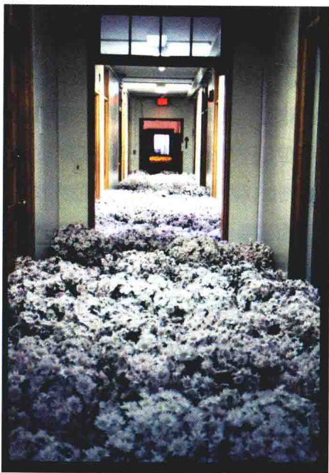
安娜·舒蕾特·哈勃，《花：一个特定地点的装置艺术》，2003

我听到的最常见的回答是——一座废弃建筑物里被当作艺术品的花和草。这个回答部分正确。这是一座老建筑，摆放的是真花，它们是被艺术家有意放在这里的。你觉得这是一座什么样的建筑？我们看到一台空调，一个很多扇门的过道，一间摆放着椅子的房间。有人猜测这是一座办公楼，也有人猜测这是某类学校，但是都不对。绝大多数人都不会想到的：这是一家精神病院。