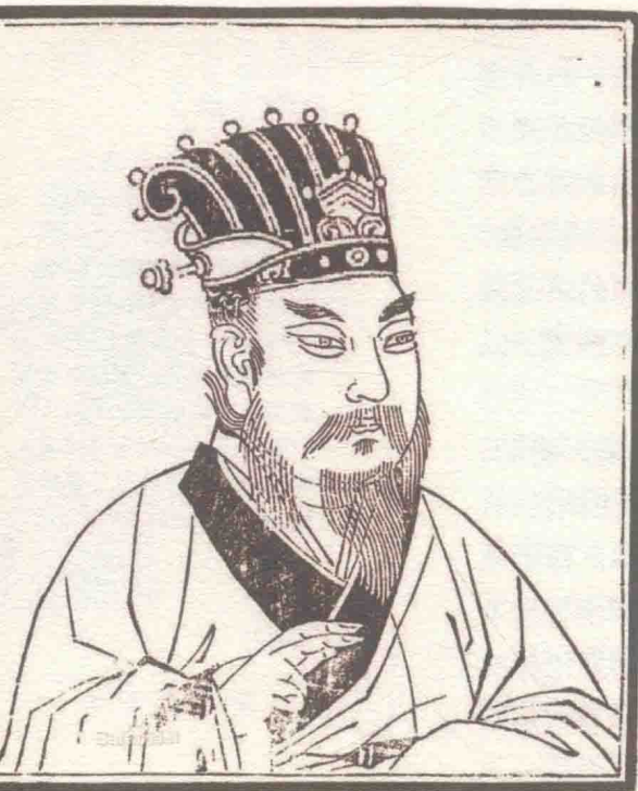
▲ 袁绍 (?~202)，东汉末军阀