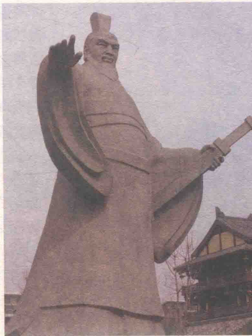
▲ 河南许昌曹操石像

189 年，汉灵帝驾崩，太子刘辩登基，太后临朝听政。大将军何进想趁此机会剿灭宦官势力，但太后却并不支持。于是，何进便召并州刺史董卓进