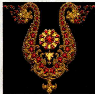
图 1-30 印度首饰

在现代首饰设计中，开始出现讲究实用性的多功能首饰、适合大批量生产的时尚首饰、引领潮流的展览和参赛首饰、消费者参与制作或者设计的套件首饰、传统文化的仿古首饰以及情侣婚庆和节日纪念性的热销首饰成为当今的主流。设计并制作成一个完美成功的首饰，必须具备以下条件：