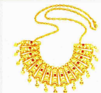
图 1-28 古罗马首饰项链