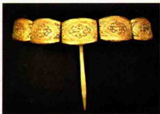
图 1-20 宋元时期黄金簪