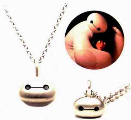
图 1-7 流行首饰

(6) 纪念首饰：为纪念人生中重要事件，如出生、订婚、结婚、金婚、获奖、节日等制作，可以永久收藏或者随身佩戴的首饰称为纪念首饰（图 1-8）。