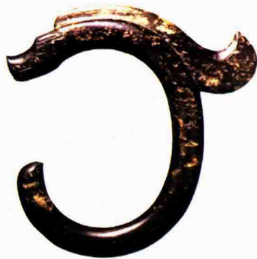
图 1-12 新石器时代玉龙

(3) 殷商时期, 逐渐出现更多的首饰品种, 人们的衣带上开始有玉佩, 头上开始佩戴骨笄, 无论是造型、纹样还是铸造工艺都达到了登峰造极的阶段, 而且充满神秘之感, 充分显示出奴隶主统治阶级希望用神灵的观念来威慑奴隶阶层的本意。由于青铜工艺的发展以及黄金被人们所认识, 黄金也被用来制作首饰(图 1-13 至图 1-14)。