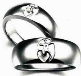
图 1-8 纪念首饰