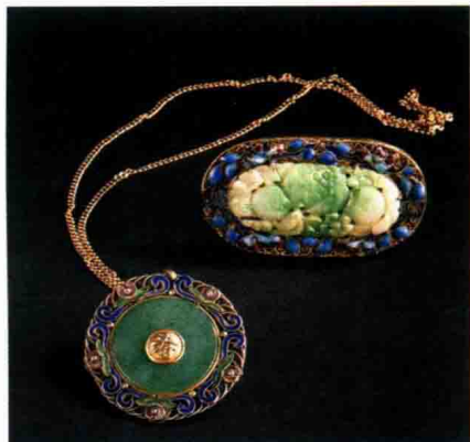
图 1-1 传统工艺首饰