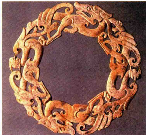
图 1-16 秦汉时期首饰配饰