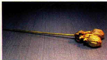
图 1-21 宋元时期荔枝金簪