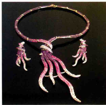
图 1-4 套件首饰

(4) 时装首饰：时装首饰是指与时装色彩款式协调配合的时装饰物和首饰，由于舞台上要求艳丽光彩，时装首饰一般选用折光强烈的材料制作。现代人对于首饰的装饰功能要求也比原先更加强烈，动机也更为单纯，今后人们对首饰的装饰性的要求也将会超越对首饰保值的要求（图 1-6）。