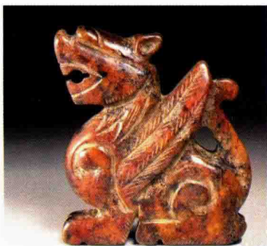
图 1-14 出土殷商时期的麒麟瑞兽随葬玉摆件

(4) 秦汉时期, 随着服饰进一步的发展, 男士佩玉、贵妇插簪较为普遍, 金饰及金丝镶嵌工艺已经具有较高的水平, 在造型上表现出线条简约的特点, 却又洋溢着秦汉无拘无羁的情感个性特征, 或表现出不事雕琢、气势博大的汉人气概; 在装饰纹样上则体现了秦汉儒学为宗的宗教神学思想意识和社会生活的缩影; 在工艺上, 精细的各种金属加工工艺和高超的玉饰雕琢工艺则更体现了秦汉强盛之实力(图 1-15 至图 1-16)。