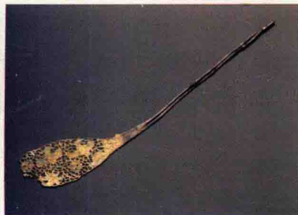
图 1-19 隋唐时期四蝶银步摇