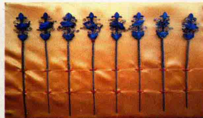
图 1-23 明清时期点翠发簪