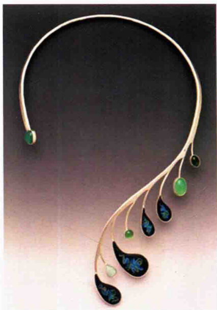
图 1-2 烧蓝首饰