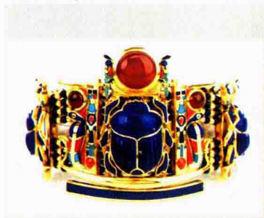
图 1-26 古埃及皇冠