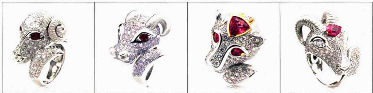
图 1-3 单件首饰

(2) 套件首饰：采用相同的材料、相同的设计方式，款式呼应的若干首饰组成的成套首饰。其特点是装饰效果强烈，整体表现和谐完美（三件套、四件套等）（图 1-4）。