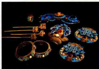
图 1-22 明清时期首饰