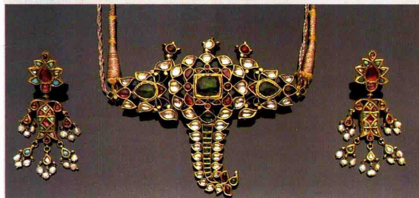
图 1-29 印度首饰套件