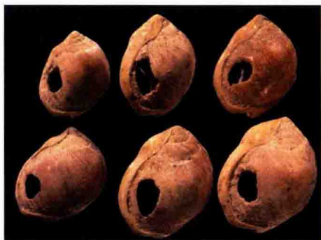
图 1-10 石器时代首饰物件（2）