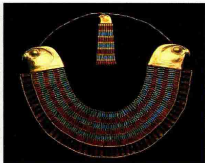
图 1-25 古埃及首饰

当今，世界经济发展有全球化的趋向，珠宝首饰设计和加工也应该尽快汇入这股时代潮流，学习和吸收国外一切好的技术及经验，为赶超世界先进水平而不懈努力。