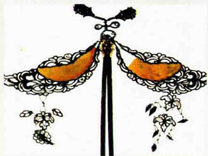
图 1-17 隋唐时期金镶玉步摇

(7) 明清时期, 首饰在用料、用工和款式设计上更加精美成熟, 流传和出土的首饰很多, 在玉石饰品的设计上采用各种动物和花卉图案, 利用透雕和浮雕等手法进行精细加工, 并充分利用宝石和各种材料的色彩和光泽, 形成绚丽、风雅得体的精美首饰。近百年来, 在继承悠久历史传统、学习外来优秀文化、注重材料和工艺及设备的研究与开发的基础上, 我国珠宝首饰进入了新的发展阶段, 出现了大批量精美的首饰真品 (图 1-22 至图 1-24)。