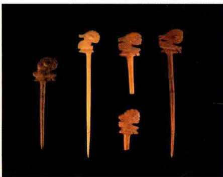
图 1-13 殷商玉笄

(3) 殷商时期, 逐渐出现更多的首饰品种, 人们的衣带上开始有玉佩, 头上开始佩戴骨笄, 无论是造型、纹样还是铸造工艺都达到了登峰造极的阶段, 而且充满神秘之感, 充分显示出奴隶主统治阶级希望用神灵的观念来威慑奴隶阶层的本意。由于青铜工艺的发展以及黄金被人们所认识, 黄金也被用来制作首饰(图 1-13 至图 1-14)。