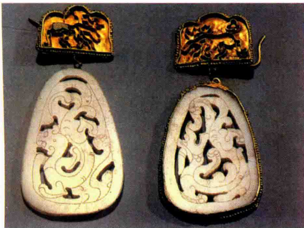
图 1-15 秦汉时期首饰

(4) 秦汉时期, 随着服饰进一步的发展, 男士佩玉、贵妇插簪较为普遍, 金饰及金丝镶嵌工艺已经具有较高的水平, 在造型上表现出线条简约的特点, 却又洋溢着秦汉无拘无羁的情感个性特征, 或表现出不事雕琢、气势博大的汉人气概; 在装饰纹样上则体现了秦汉儒学为宗的宗教神学思想意识和社会生活的缩影; 在工艺上, 精细的各种金属加工工艺和高超的玉饰雕琢工艺则更体现了秦汉强盛之实力(图 1-15 至图 1-16)。