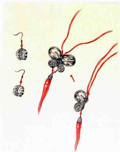
图 1-5 多用首饰