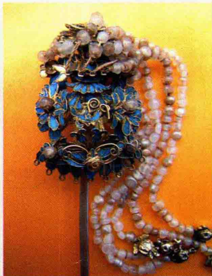
图 1-24 明清时期点翠首饰

外国的珠宝首饰产生和发展与中国有着相似的情况。古埃及, 由于埃及是一个文明古国, 在出土的文物中, 有以贝壳、漂亮的小石子、念珠穿成的项链, 更有将水晶、玛瑙、紫石英等宝石雕琢成圆形或长方形再串接成的项链 (图 1-25 至图 1-26); 古罗马, 古代罗马人用以固定披挂缠绕式服装的各种饰针成为必需的服饰品, 款式也比较多, 罗马人善于石雕和镶嵌, 制作大量以金银等金属为托架、镶嵌有琢磨加工的珠宝, 成为贵妇小姐们真爱的首饰 (图 1-27 至图 1-28); 印度, 印度有着恒河流域的古老文明, 珠宝