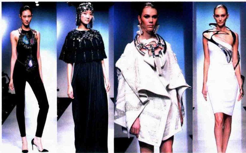
图 1-6 时装首饰