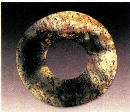
图 1-11 石器时代首饰物件

(2) 发展到新石器时代, 除了一般的粗制石器和雕刻有一些花纹的骨器外, 已经出现了用心选材、尽心加工的玉石饰品, 从形式和组合方式等方面有了明显的进步, 完美地体现了原始人类的审美观和装饰意识(图 1-11 至图 1-12)。