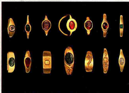
图 1-27 古罗马时期首饰