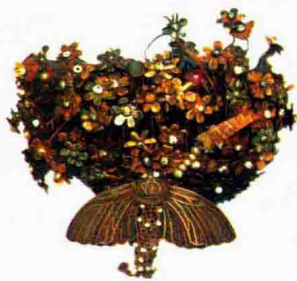
图 1-18 隋唐时期首饰