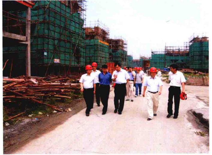
中国农业银行总行部门领导考察嘉兴市“两新”建设项目