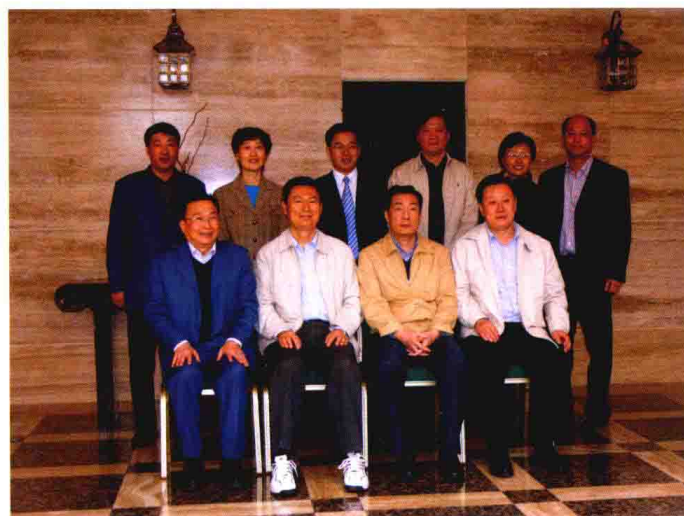
2007年11月，时任中国人民银行副行长苏宁（前排左二）来嘉兴视察