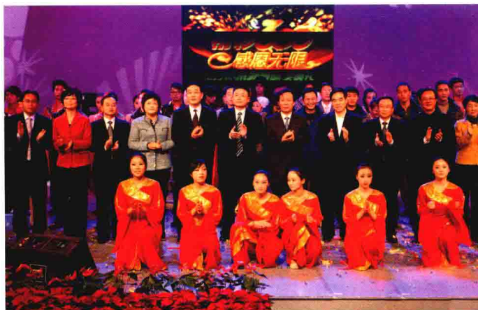
2009年11月29日晚，中国工商银行嘉兴分行举办“精彩300 感恩无限”工行杯系列赛颁奖典礼