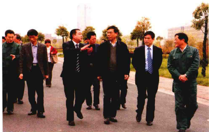
2010年4月2日，中国工商银行董事长姜建清一行到加西贝拉压缩机有限公司进行考察