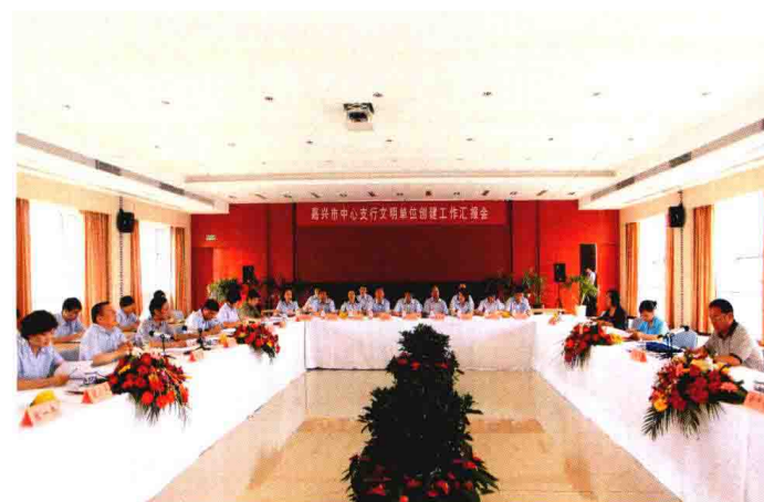
2010年11月24日，中组部来中国人民银行嘉兴市中心支行调研创先争优活动开展情况，并给予高度评价