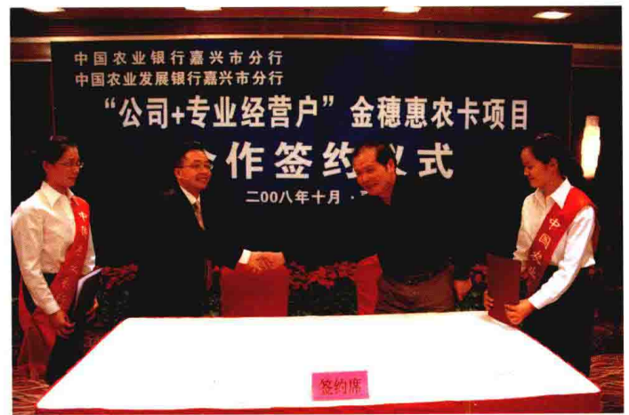
2008年10月，中国农业银行嘉兴市分行与中国农业发展银行嘉兴市分行举行“公司+专业经营户”惠农卡项目签约仪式