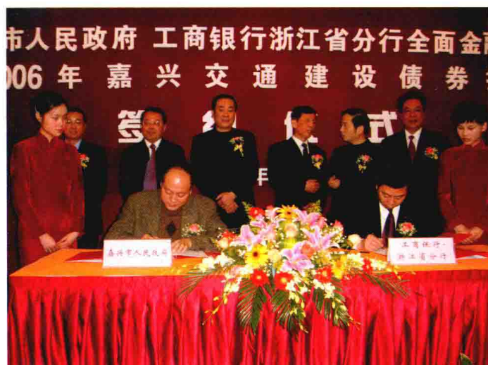
2006年1月7日，中国工商银行浙江省分行与嘉兴市人民政府举办全面金融合作暨2006年嘉兴交通建设债券担保签约仪式