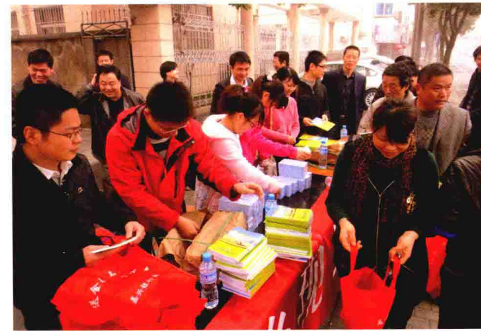
2010年11月，嘉兴银监分局团委在凤桥镇开展“送金融知识下乡”活动