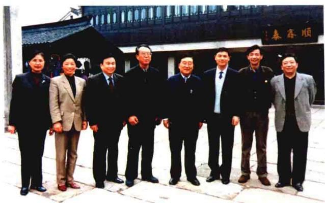
2002年3月，时任全国政协副主席、原国务委员兼中国人民银行行长李贵鲜（左五）来嘉兴视察