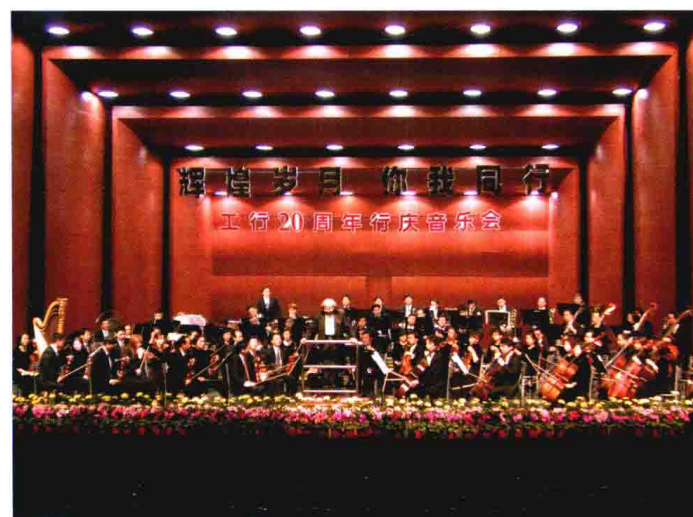
2004年12月18日晚，中国工商银行嘉兴市分行举办“辉煌岁月 你我同行”工行20周年行庆音乐会