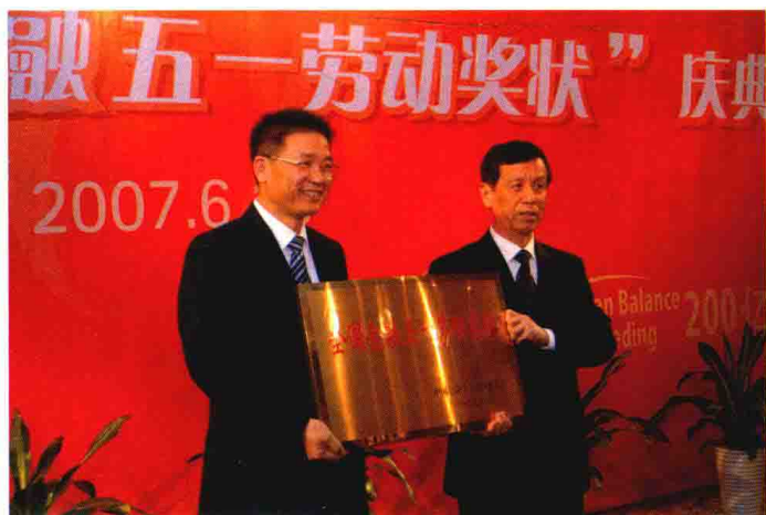
2007年6月18日，中国工商银行嘉兴分行举办庆祝贷款超200亿元暨荣获“全国金融五一劳动奖状”庆典仪式