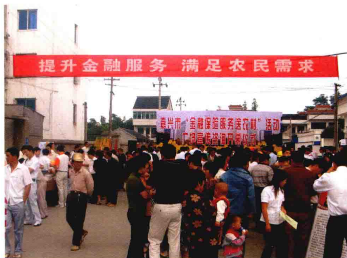
2007年，组织开展嘉兴市“金融保险服务送农村”活动