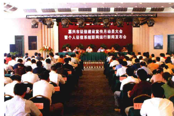
2005年7月1日，中国人民银行个人征信系统全国联网运行