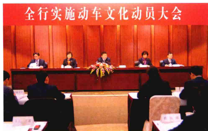
2008年，中国工商银行嘉兴分行在全行实施动车文化项目