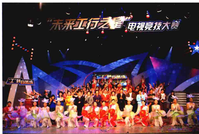
2007年3月11日晚，中国工商银行嘉兴分行在嘉兴市广播电视总台630演播室举办“‘工’到自然成——未来工行之星电视竞技大赛”决赛