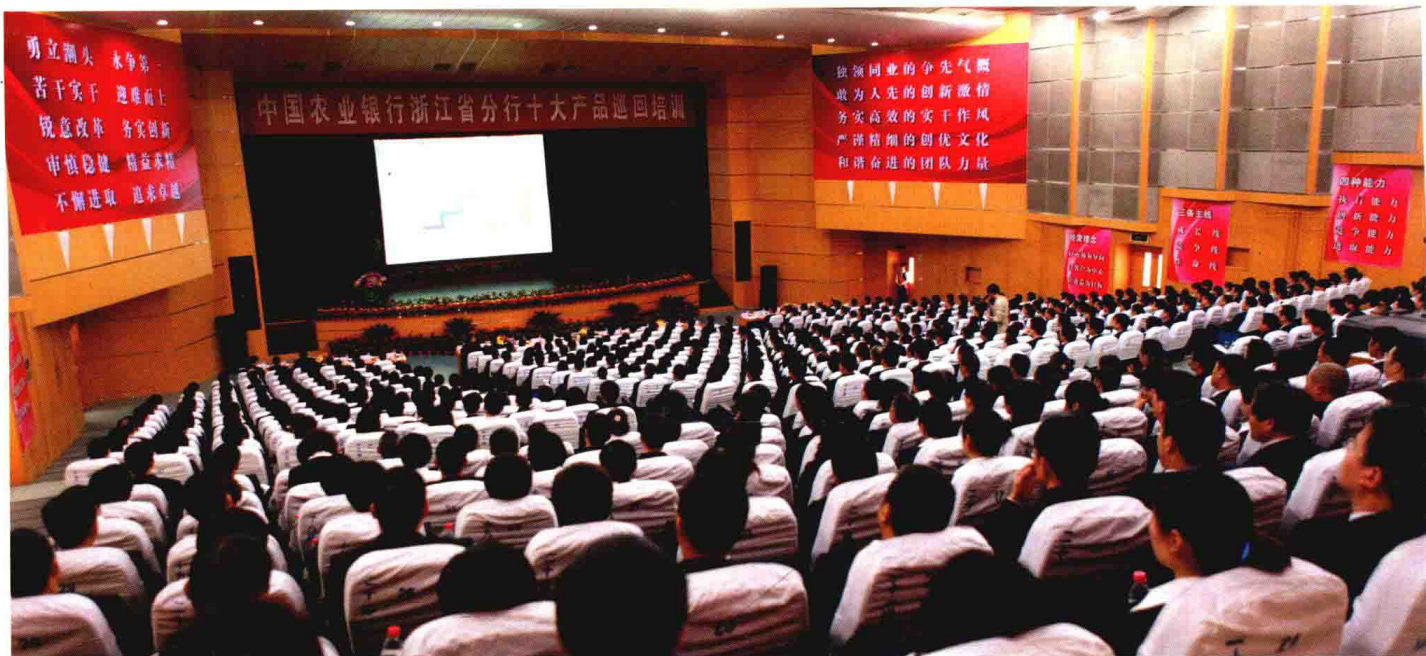
2010年5月，中国农业银行浙江省分行十大产品巡回培训走进嘉兴