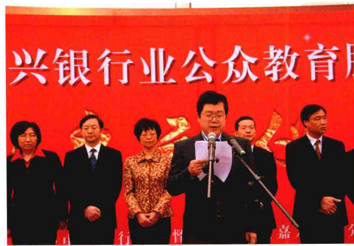
2010年10月28日，嘉兴银监分局举行“嘉兴银行业公众教育服务日”活动