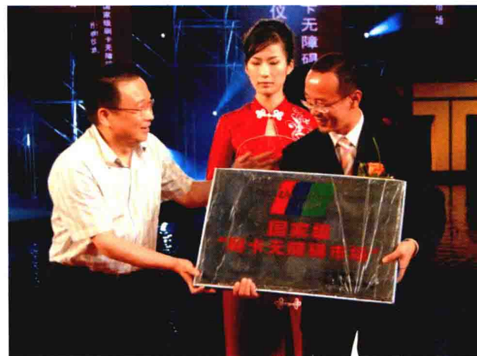
2008年9月27日，在海宁中国皮革城举行国家级“刷卡无障碍市场”授牌仪式