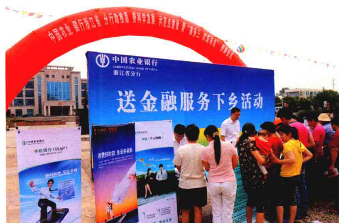
中国农业银行嘉兴分行送金融服务下乡