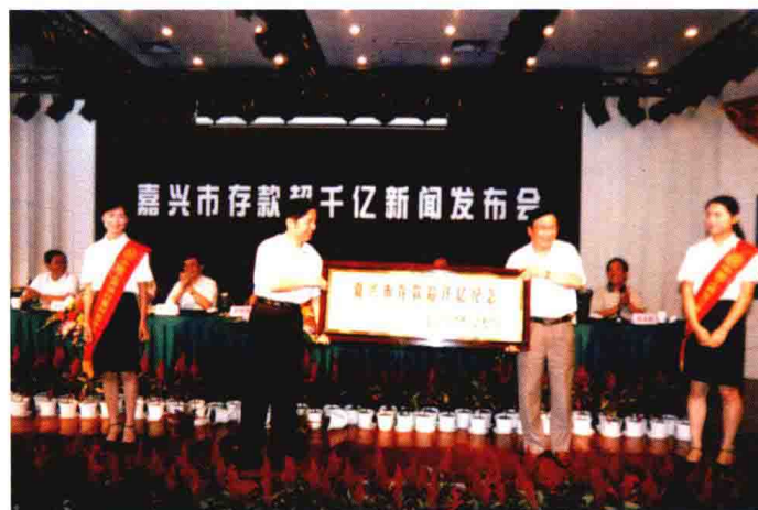
2003年9月16日，召开金融系统各项存款超千亿新闻发布会