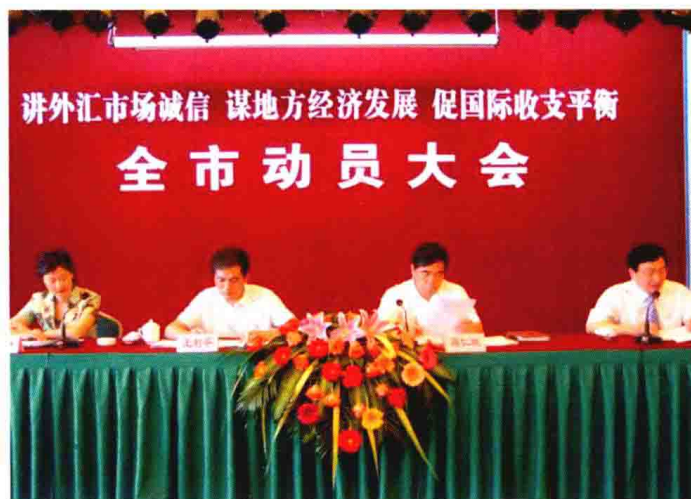
2007年5月21日，召开“讲诚信、谋发展、促平衡”主题活动动员大会