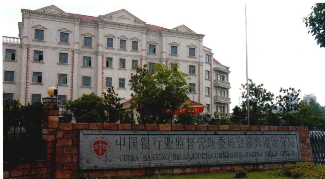
2008年3月，嘉兴银监分局搬入秀洲区新平路21号机关大楼