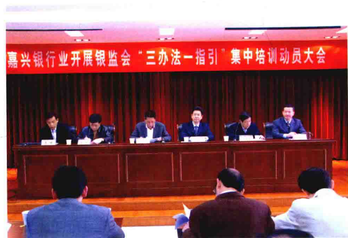
2010年4月，嘉兴银监分局组织召开嘉兴银行业“三办法一指引”集中培训