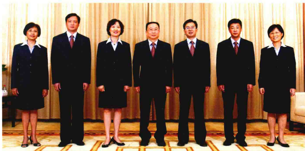
2010年领导班子集体合影