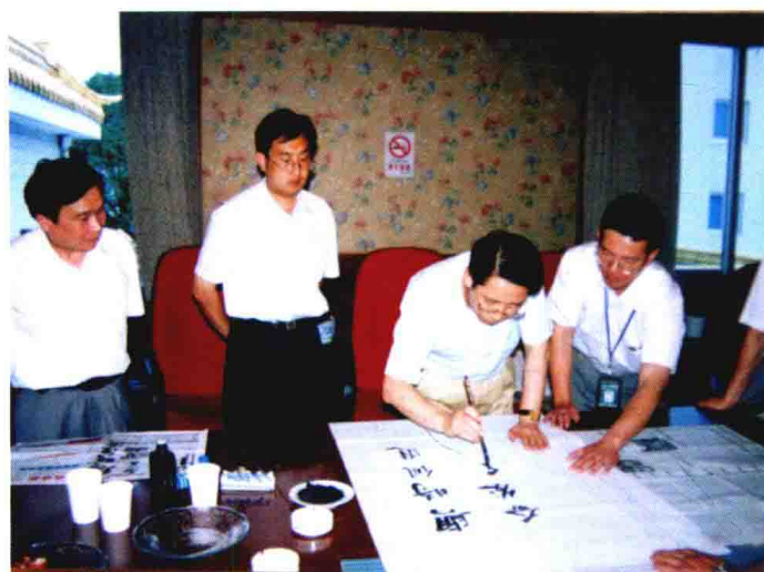
2002年6月，时任中国人民银行副行长刘廷焕（左三）来嘉兴调研