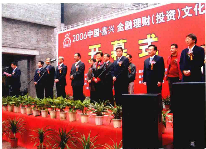
2006年11月17日至19日，举办“嘉兴市金融理财（投资）文化节”