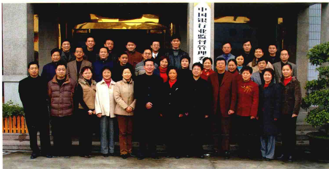
2004年1月，嘉兴银监分局挂牌成立