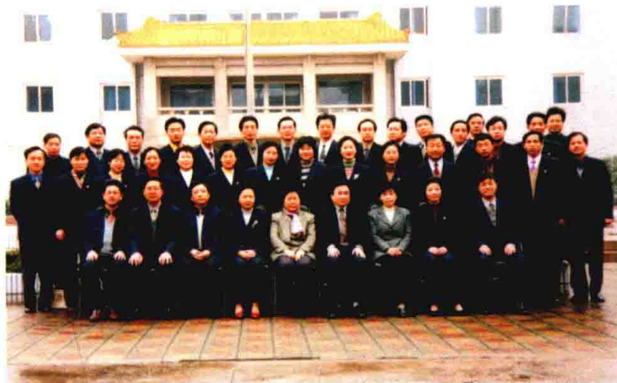
2001年3月，时任中国人民银行副行长吴晓灵（前排左五）来嘉兴调研