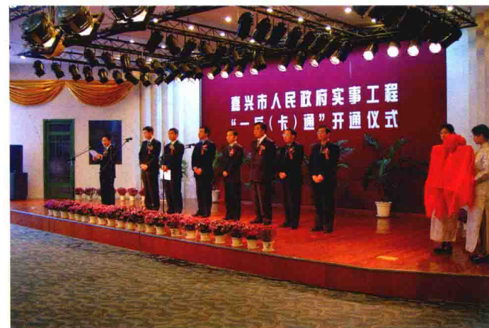
2003年11月18日，嘉兴市缴费“一户(卡)通”工程正式开通