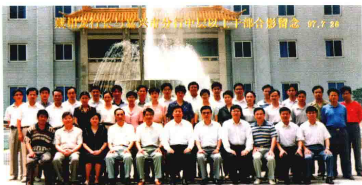
1997年7月，时任中国人民银行行长戴相龙（前排左六）来嘉兴调研