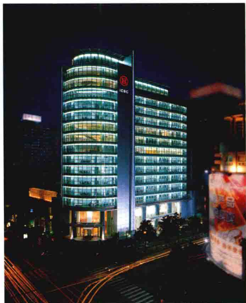
中国工商银行嘉兴分行大楼