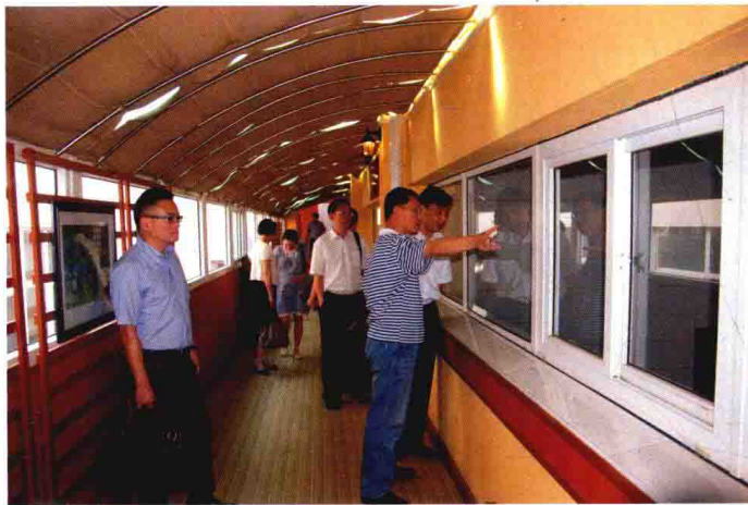
2010年8月，中国农业银行嘉兴分行领导走访考察信贷企业