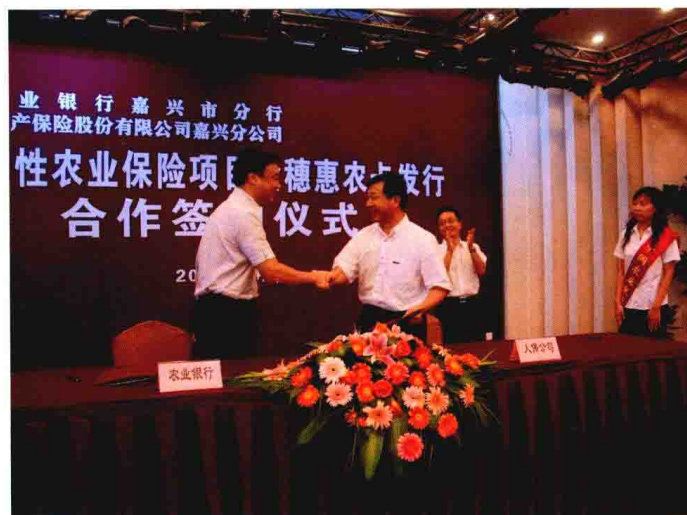
2008年9月，中国农业银行嘉兴市分行与人保公司嘉兴分公司举行政策性农业保险惠农卡项目签约仪式