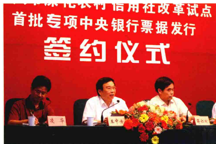
2004年6月3日，举行“深化农村信用社改革试点首批专项中央银行票据发行”签约仪式