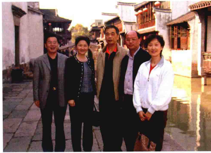
2007年11月，时任国家外汇管理局副局长李东荣（左三）来嘉兴考察