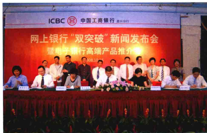
2008年10月15日，中国工商银行嘉兴分行隆重举行网上银行“双突破”新闻发布会