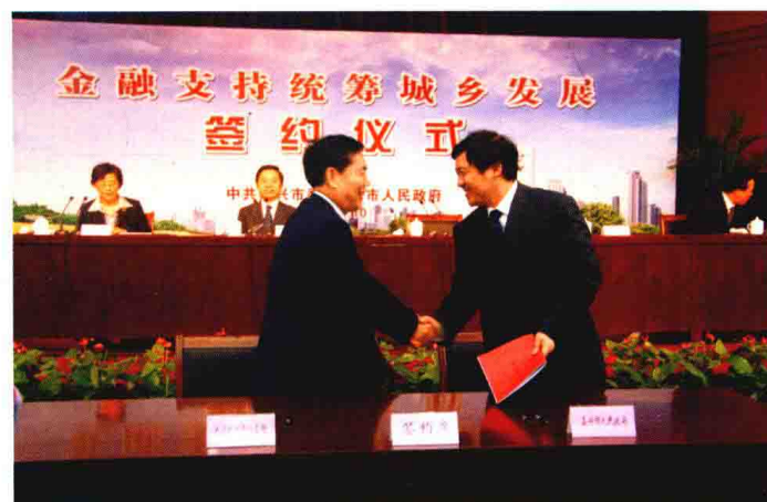
2009年4月10日，举办嘉兴市金融支持统筹城乡发展签约仪式