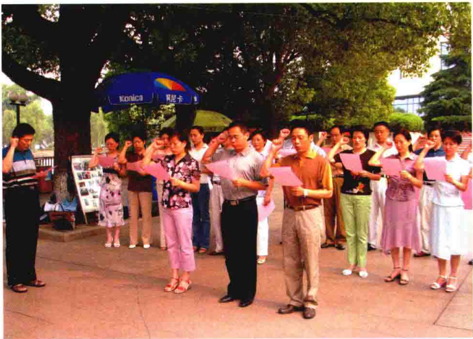
2005年6月，嘉兴银监分局机关党总支组织党员到南湖重温入党誓词