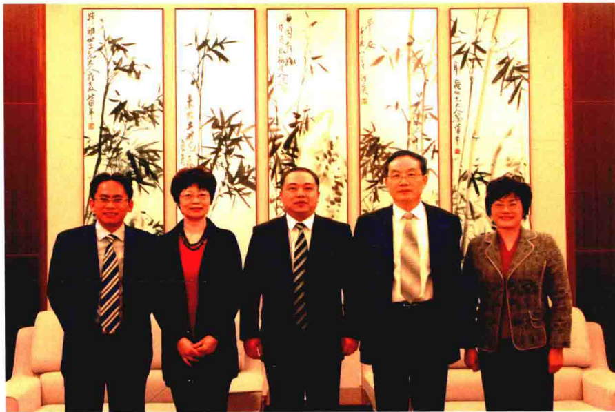
中国工商银行嘉兴分行领导班子合影