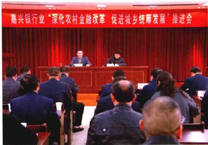
2009年12月，嘉兴银监分局组织召开嘉兴银行业支持城乡统筹发展推进会