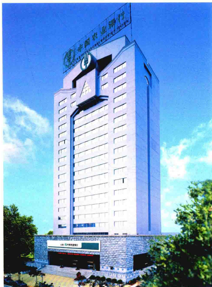
中国农业银行嘉兴分行办公大楼，行址：嘉兴市南湖区斜西街461号