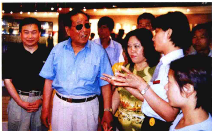
2001年6月，原中国人民银行副行长李飞（左二）来嘉兴考察