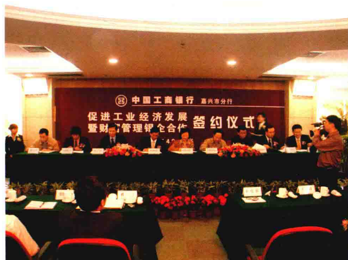
2005年4月8日，中国工商银行嘉兴市分行举行促进工业经济发展暨财富管理银企合作签约仪式