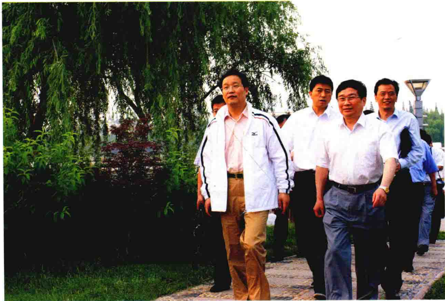
2007年5月，时任中国人民银行副行长项俊波（左一）来嘉兴调研