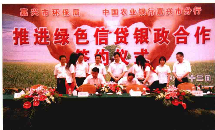
2008年6月，中国农业银行嘉兴市分行与市环保局携手合作开展绿色信贷创新试点