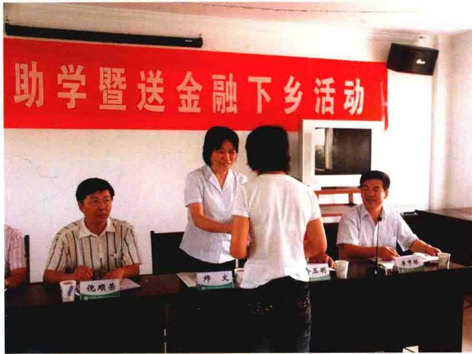
中国农业银行嘉兴分行开展扶贫助学暨送金融下乡活动