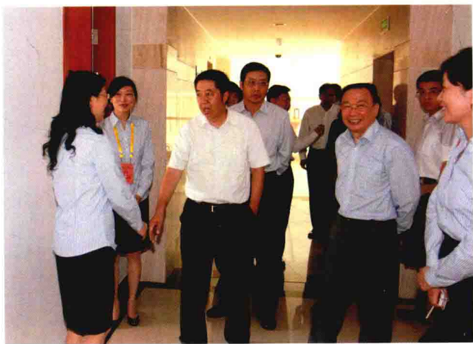
2010年10月，时任中国人民银行副行长马德伦（左三）来嘉兴调研