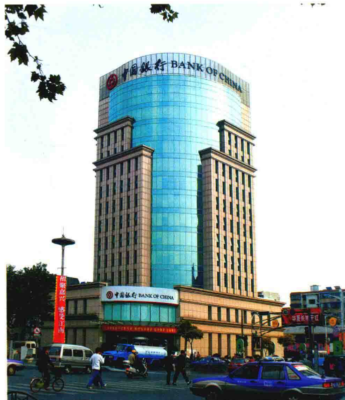
中国银行嘉兴市分行办公大楼外貌

◀ 2005年4月，中国银行嘉兴市分行储蓄专柜被团中央授予全国级“青年文明号”称号