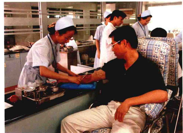
中国农业银行嘉兴分行党员带头参加献血活动