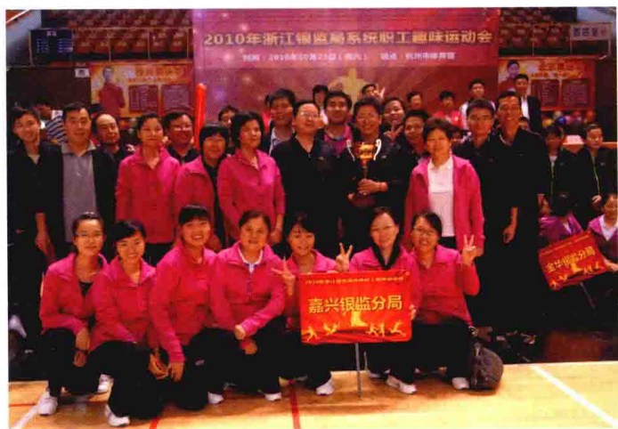
2010年10月，嘉兴银监分局勇夺浙江银监局系统首届职工趣味运动会团体第四名