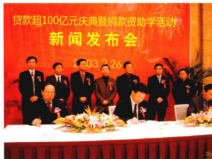
2003年2月26日，中国工商银行嘉兴市分行隆重举行贷款超100亿元庆典暨捐资助学活动新闻发布会