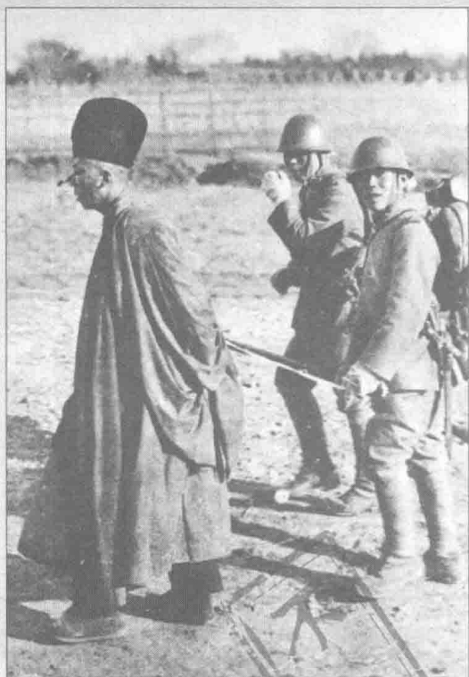
► 1932年2月20日，在李家湾的日军把和尚当作士兵抓了起来。