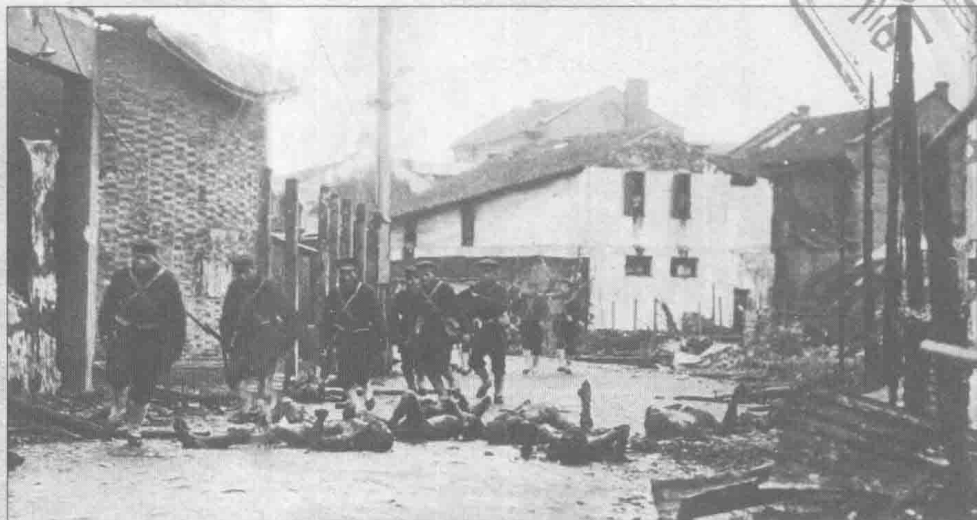
▲ 1932年2月5日，在部署于扬子江、黄浦江的部队猛烈炮火的支援下进攻的海军特别陆战队。