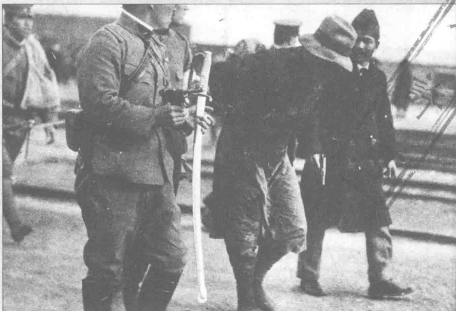
▲“九一八”事变后，东北及全国各地的抗日浪潮空前高涨。在沈阳，以东北大学为中心，知识分子举行了抗日集会游行。图为9月22日在郑家屯被逮捕的抗日人士。