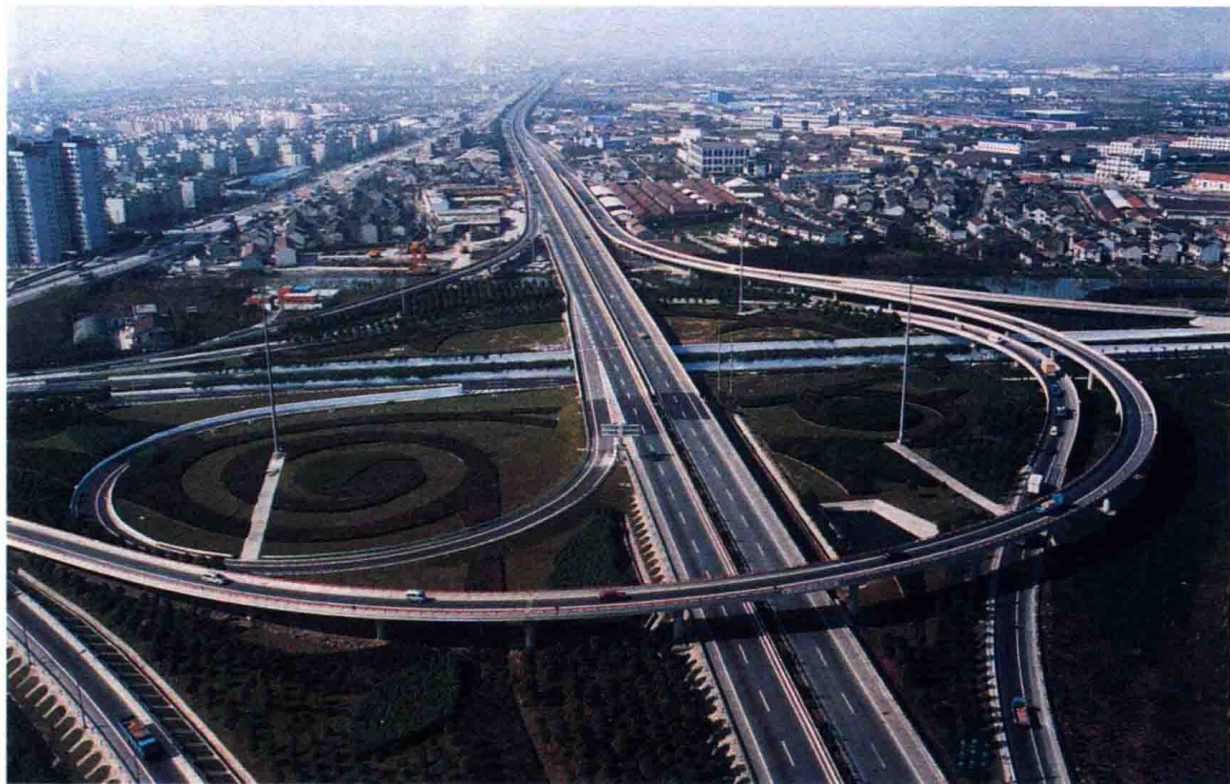
图3 2001年12月，沈海高速公路上海徐泾立交建成通车