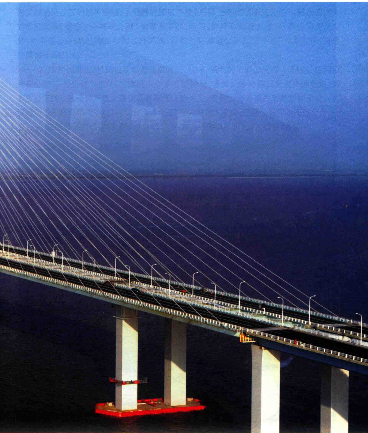
图 11 2011 年 10 月，沪陕高速公路上海长江隧桥建成通车