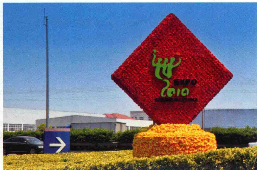
图10 2010年5月，迎世博高速公路绿化小品