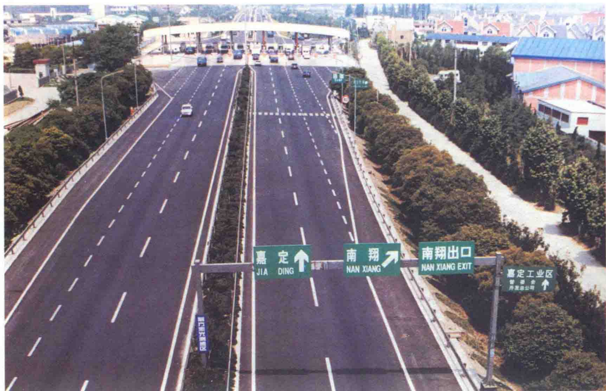
图1 1988年10月，中国第一条高速公路——沪嘉高速公路建成通车