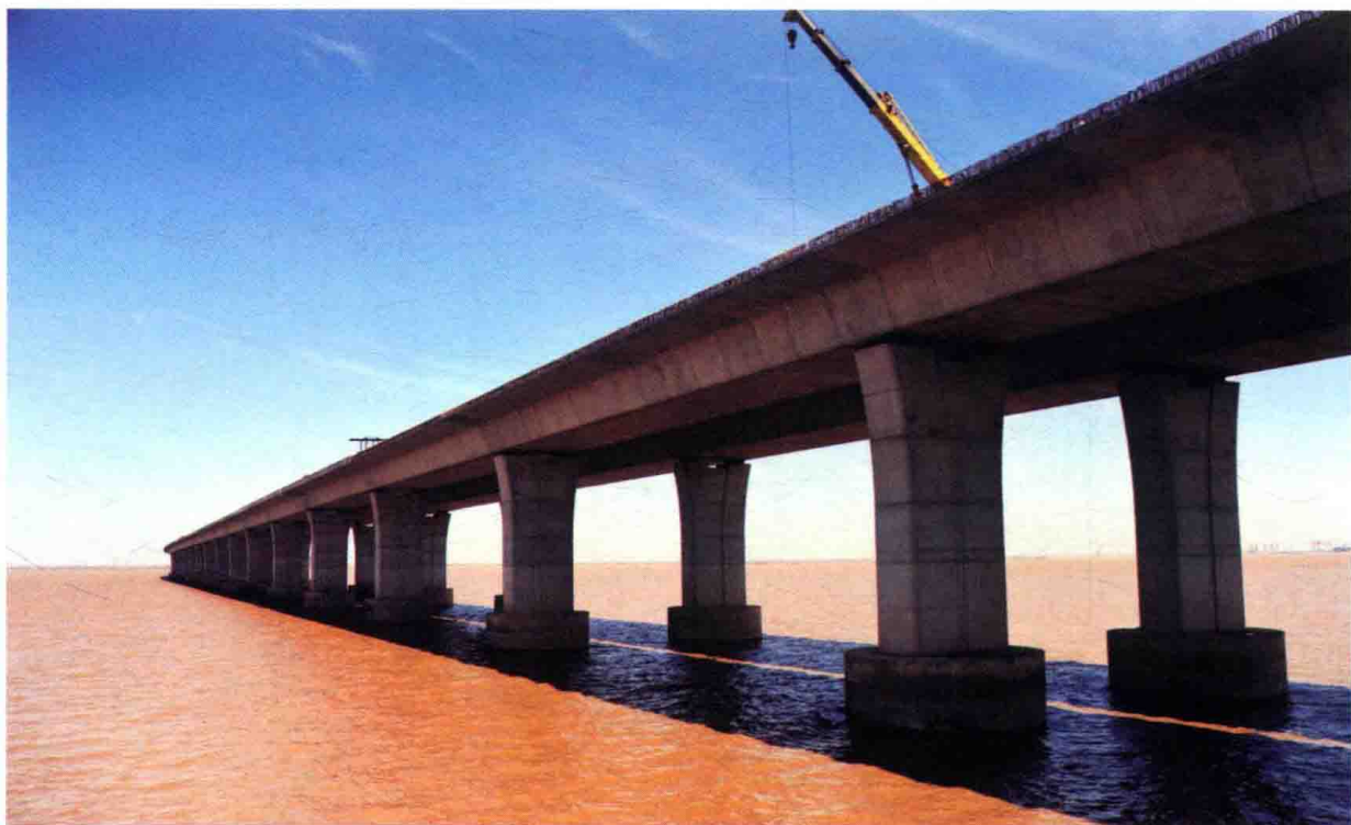
图12 沪陕高速公路崇启通道工程施工