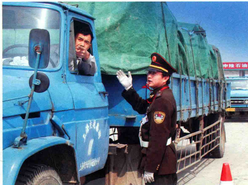
图9 2010年1月，公路路政治理双超