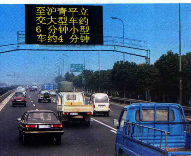
图5 2004年2月，外环高速公路信息诱导系统