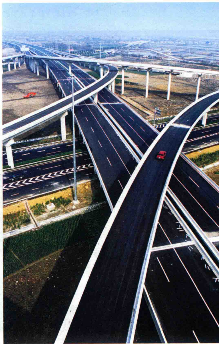
图6 2005年12月，沪渝高速公路上海朱枫立交建成通车