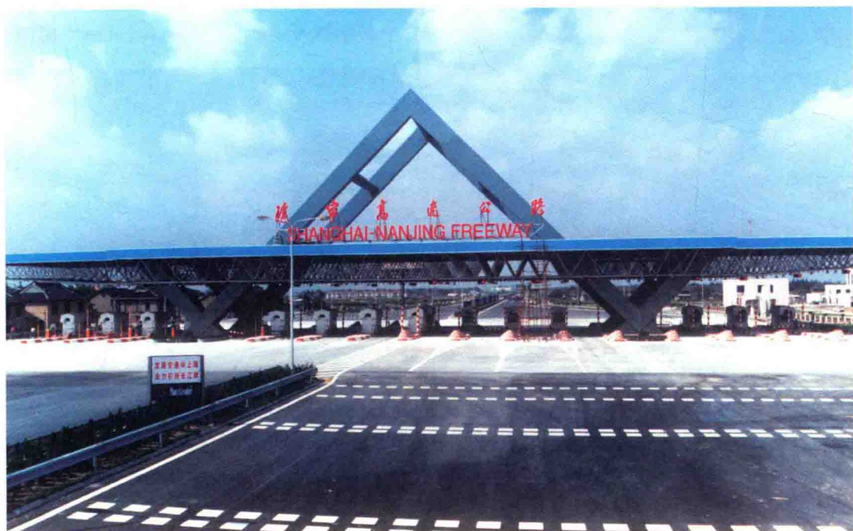
图2 1996年9月，沪宁高速公路上海江桥收费站建成运营