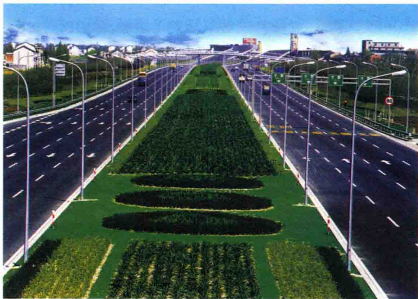
图4 2002年10月，外环高速公路（二期）浦东段工程建成通车