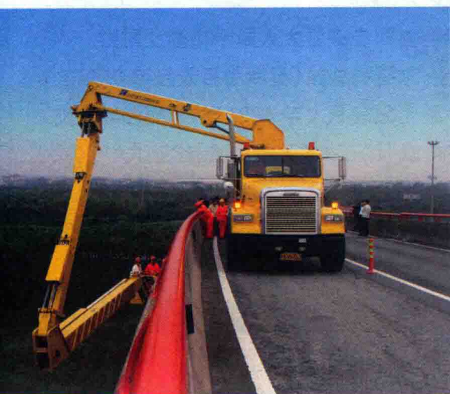
图7 2007年10月，交通部省际互查组检查公路桥梁