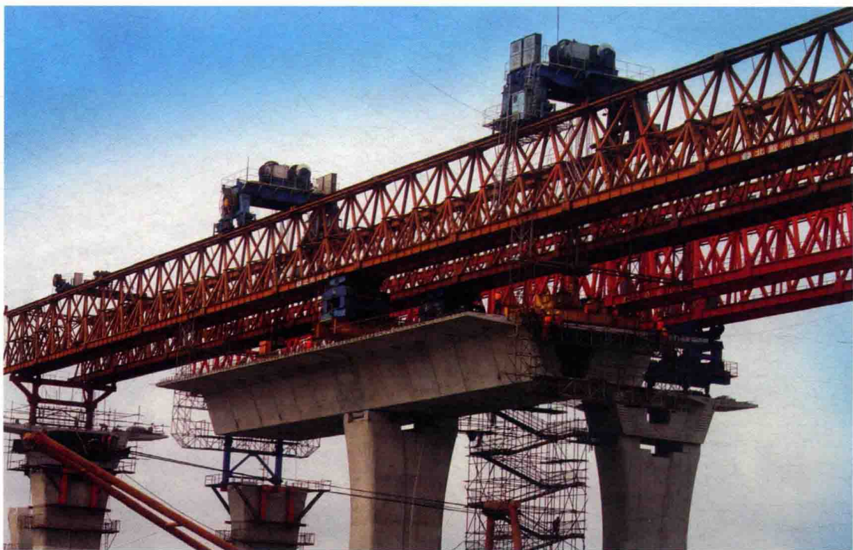
图13 上海长江隧桥工程获得“国家科技进步二等奖”