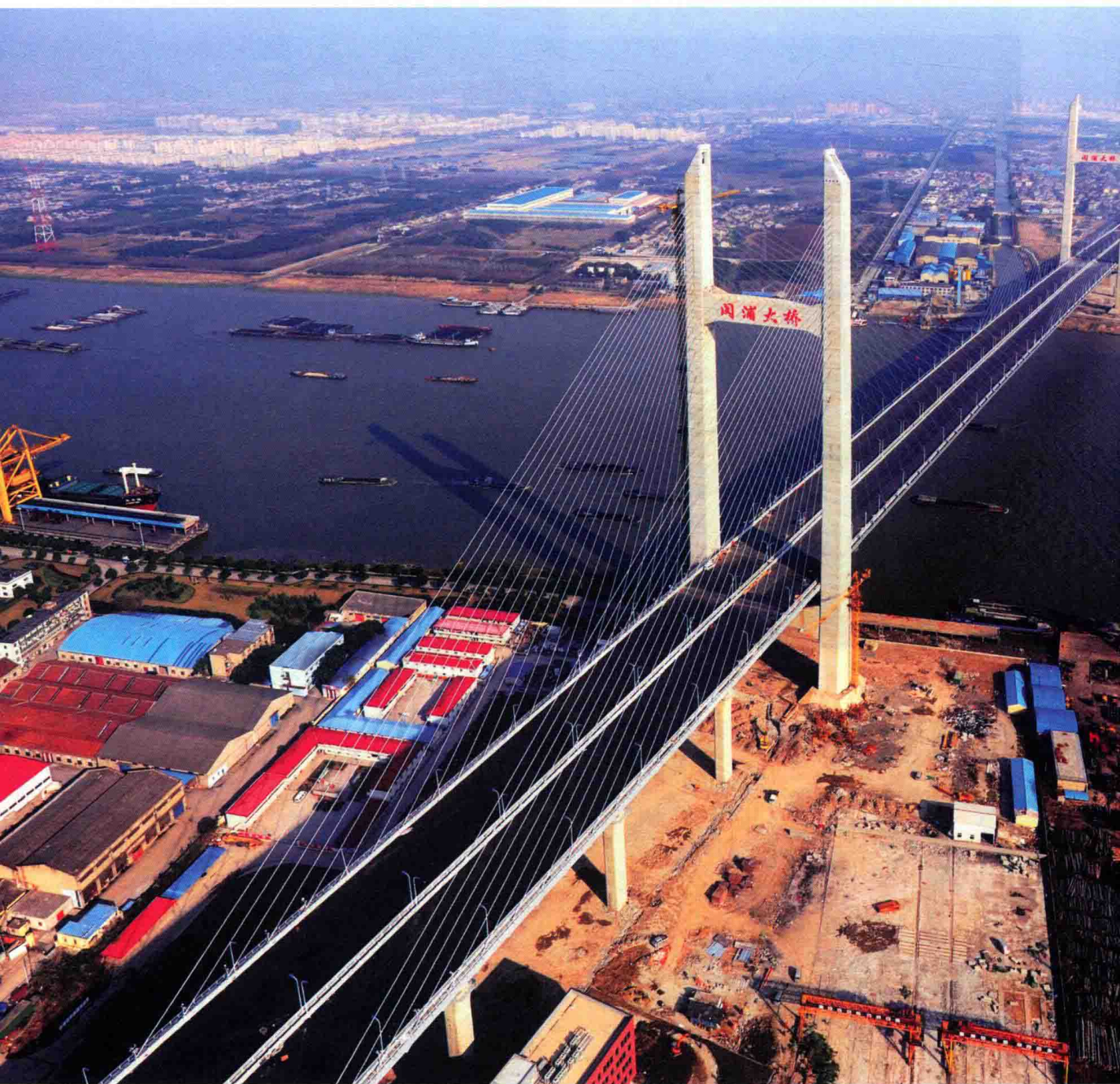
图8 2009年12月，申嘉湖高速公路上海闵浦大桥建成通车