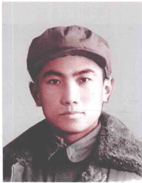
1949年7月，作者调至中共天津市青委工作。