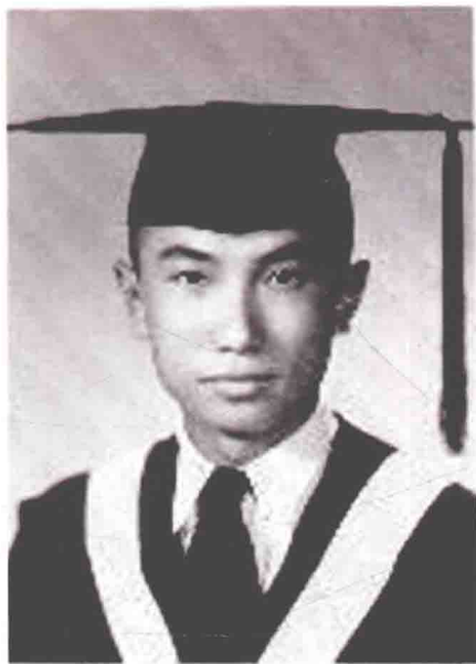
1949年7月，作者在南开大学毕业，获得文学士学位。