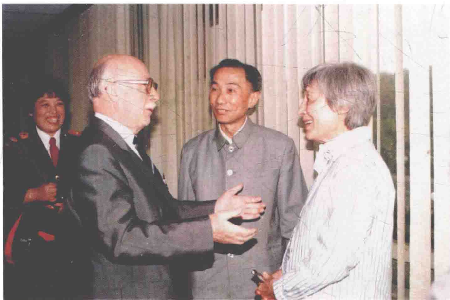
1988年，首届周恩来研究国际学术讨论会上，作者与苏联科学院主席团委员、苏中友好协会会长齐赫文斯基院士，知名英籍作家韩素英女士交谈。