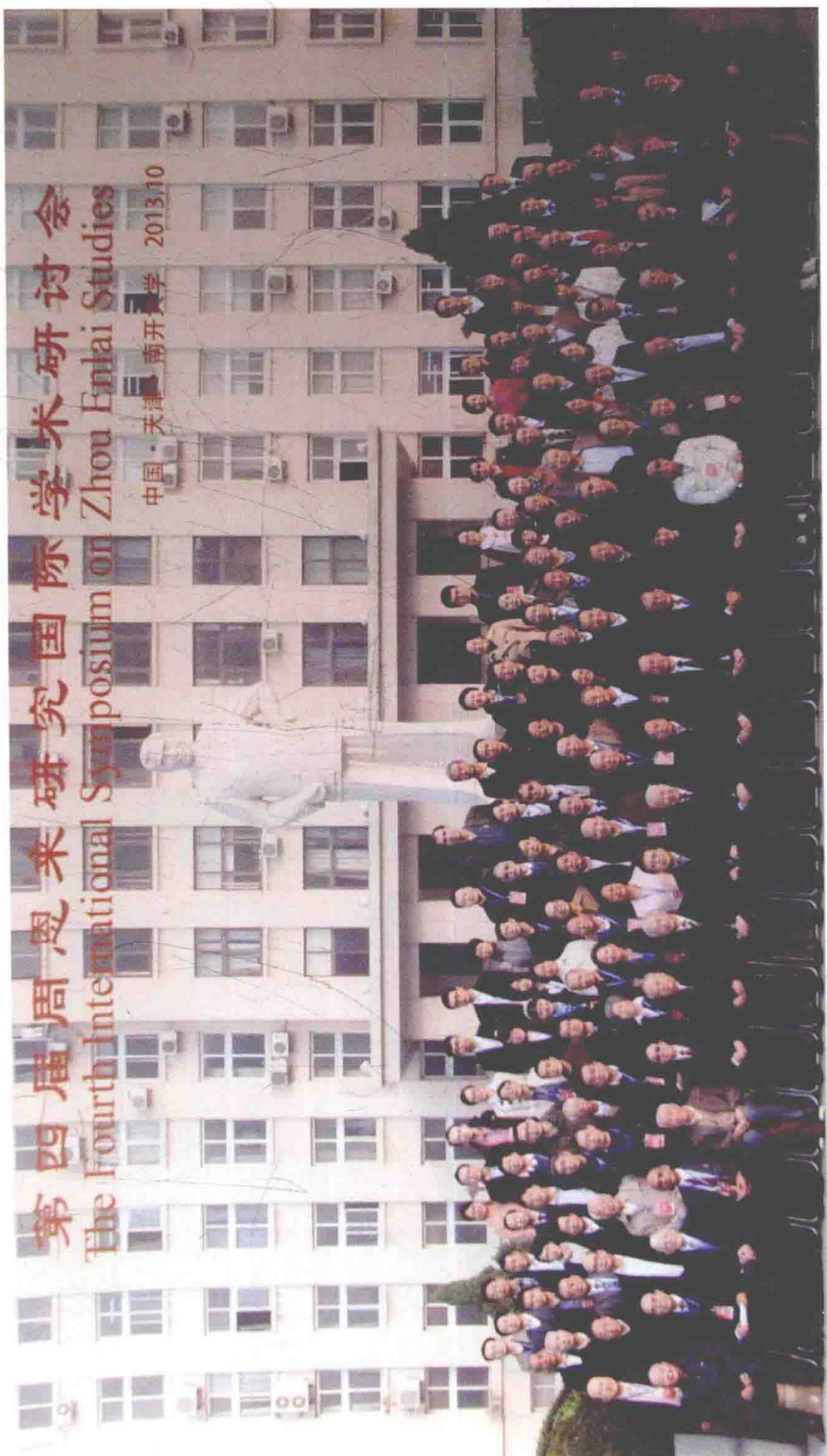
2013年10月，第四届周恩来研究国际学术研讨会全体人员合影。