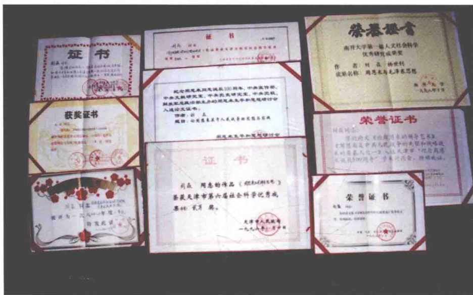
作者获得的周恩来研究优秀成果的各种证书。