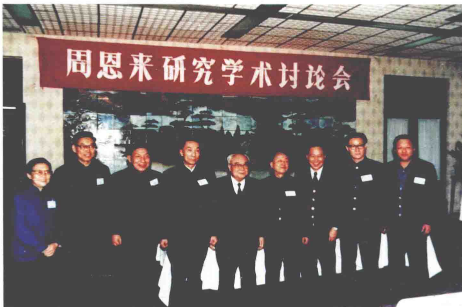
1996年，在中共中央文献研究室主办的周恩来研究学术讨论会上，作者（左四）与中央文献研究室主任李琦（左五）、副主任金冲及（左七）、国务院总理办公室原主任童小鹏（左六）、国务院经济法规研究中心主任顾明（左三）等同志合影。