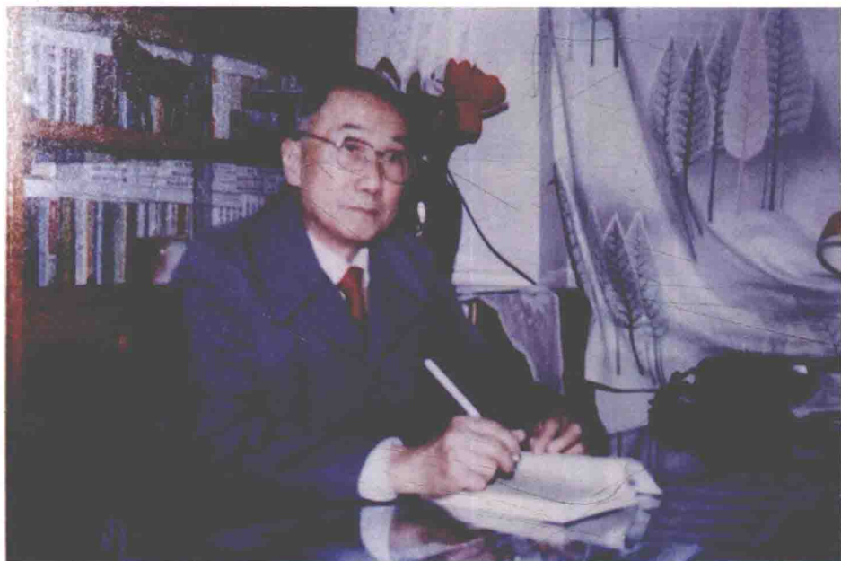
20世纪80年代以来，作者长期兼任南开大学周恩来研究室主任，从事周恩来研究。